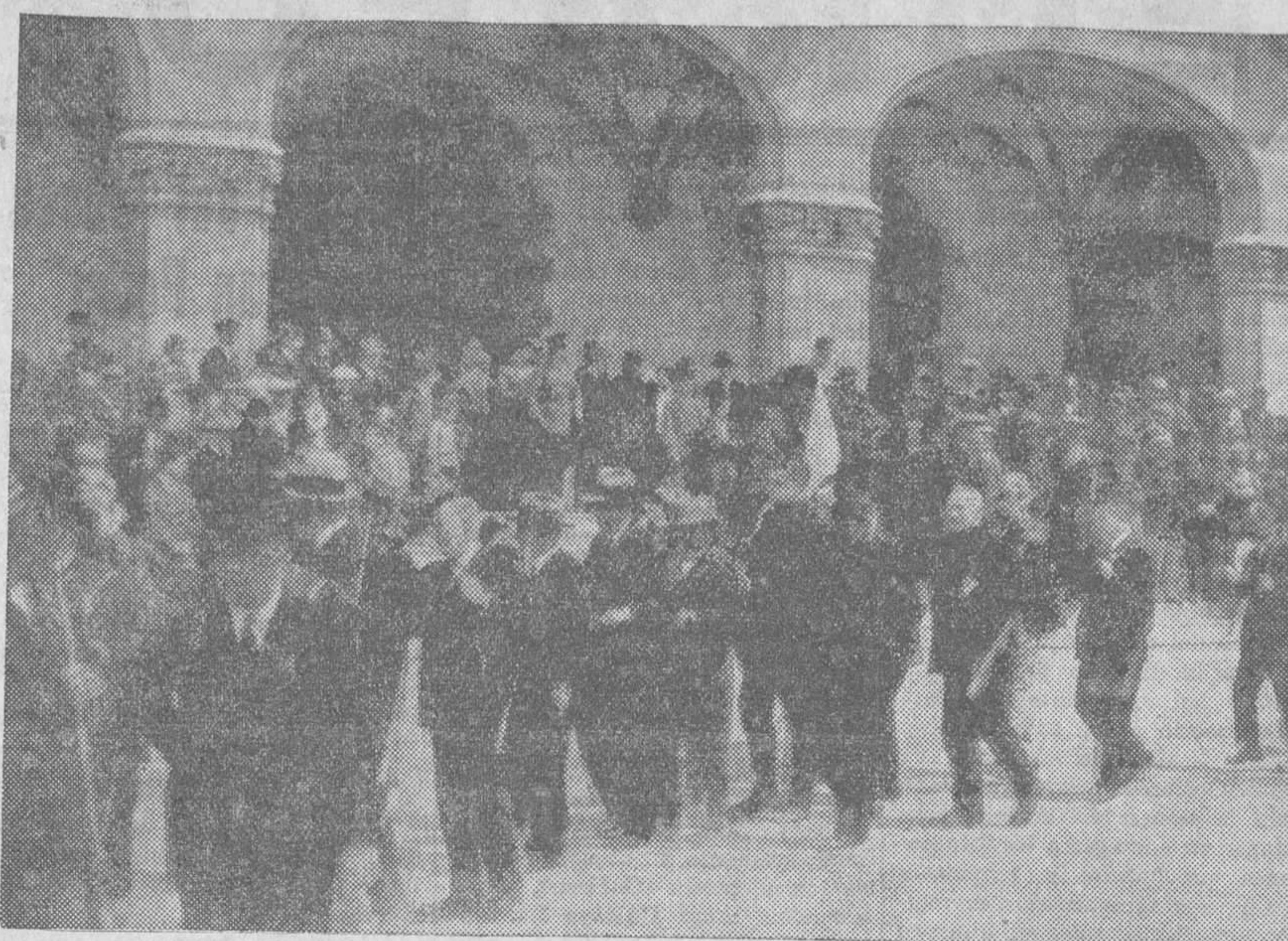
Desfile de los somatenistas ante las autoridades frente al Palacio Municipal