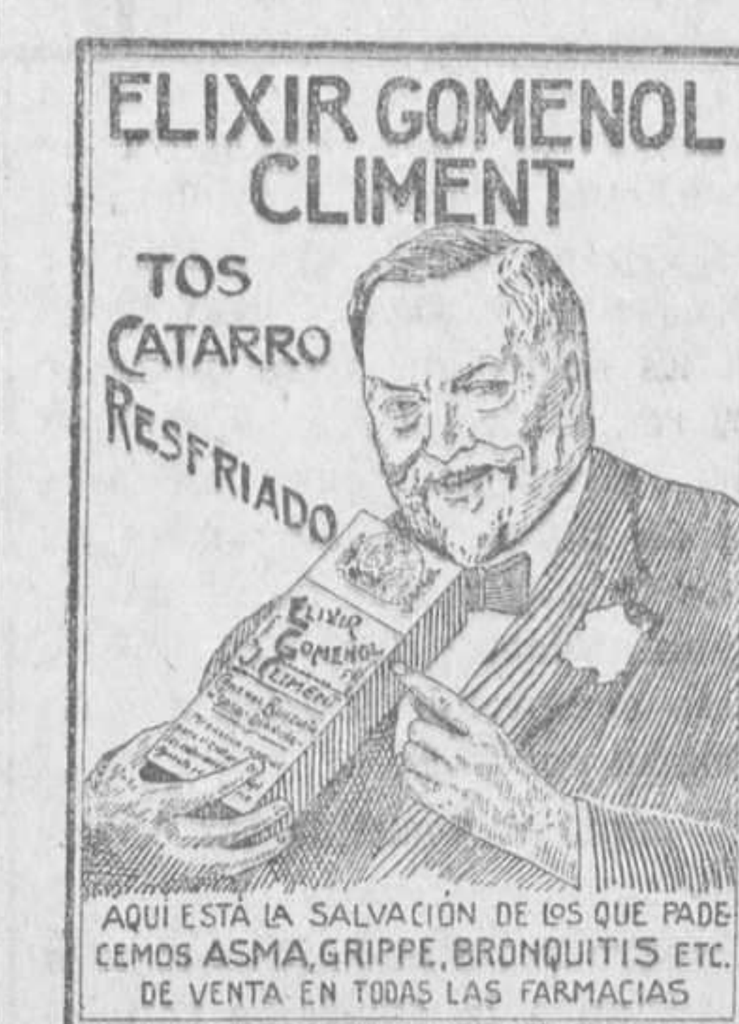
ELIXIR GOMENOL CLIMENT TOS CATARRO RESFRIADO

SAN MARTIN, NÚM. 1 (Junto a los Entresuelos San Martín)