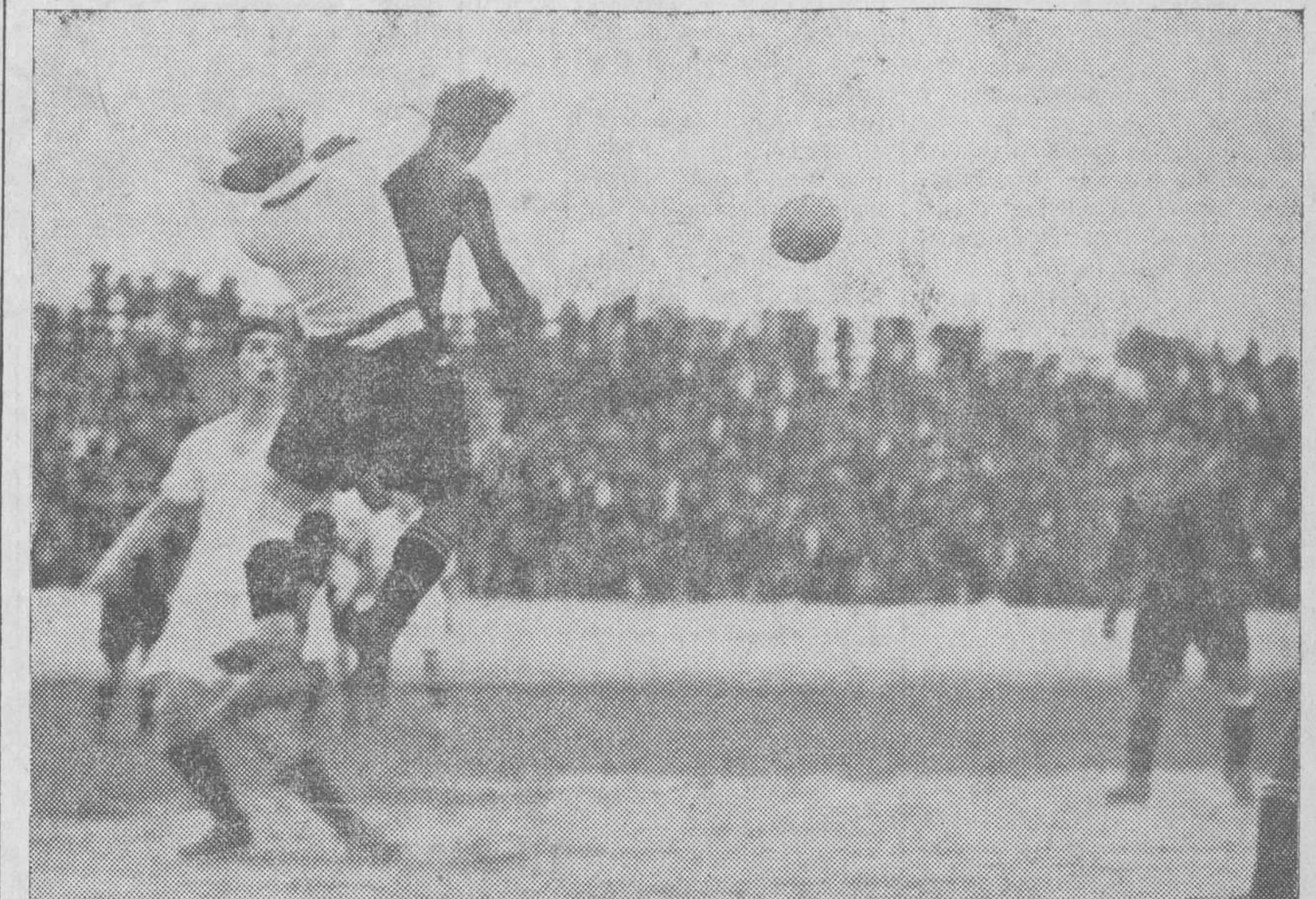
Otra excelente intervención que acredita al guardameta madrileño

El ataque madrileño, con algún destello de rapidez y shot, no pudo conseguir tanto, que por otro lado tampoco mereciera.