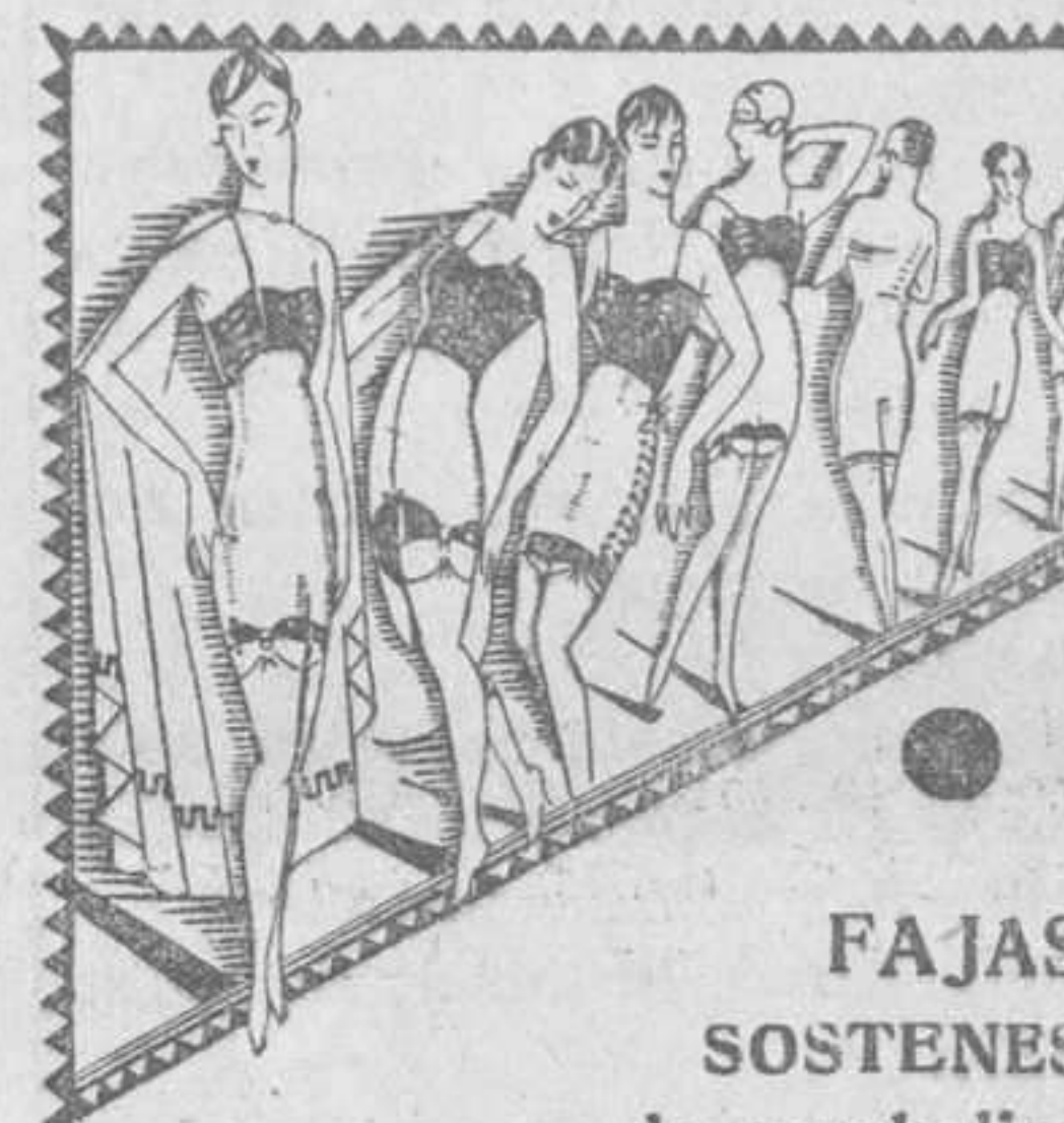
FAJAS SOSTENES de caucholina MADAME X para adelgazar MADAME X VALERIA

La cara, espejo de la salud. Un rostro pálido, demacrado, jaco y triste, denota un organismo débil, raquítico, agotado. Quienes al verse así toman el FOSFOLICO-KOLA DOMENECH, regeneran su salud, tonifican sus nervios y cambian su rostro de día en día, hasta aparecer los sanos colores que denotan vida, salud y alegría.