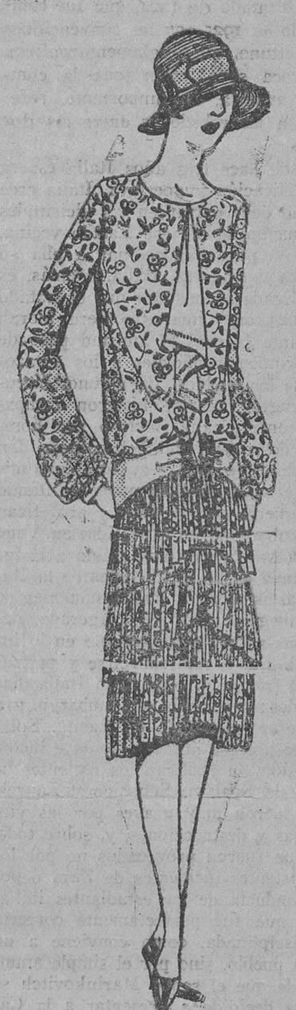
De fondo negro, tabaco o verde, este vestido estampado a florecillas; se confecciona con dos o tres volantes plisados, la falda, y liso el cuerpo.