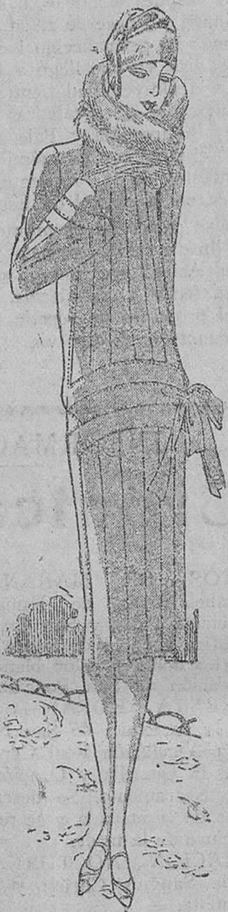
Traje abrigo en drapella gris, muy cruzado y sujeto por la lazada de la izquierda, trabajada con vigorosas nervaduras. Cuello de renard, al tono. (Creación de Lucyen Ainé).

Antes de dñar los kashas necesito decirlos que el kashafilla es un mudo alrededor de abejas y tiene un hilo blanco, que se mueve felizmente a