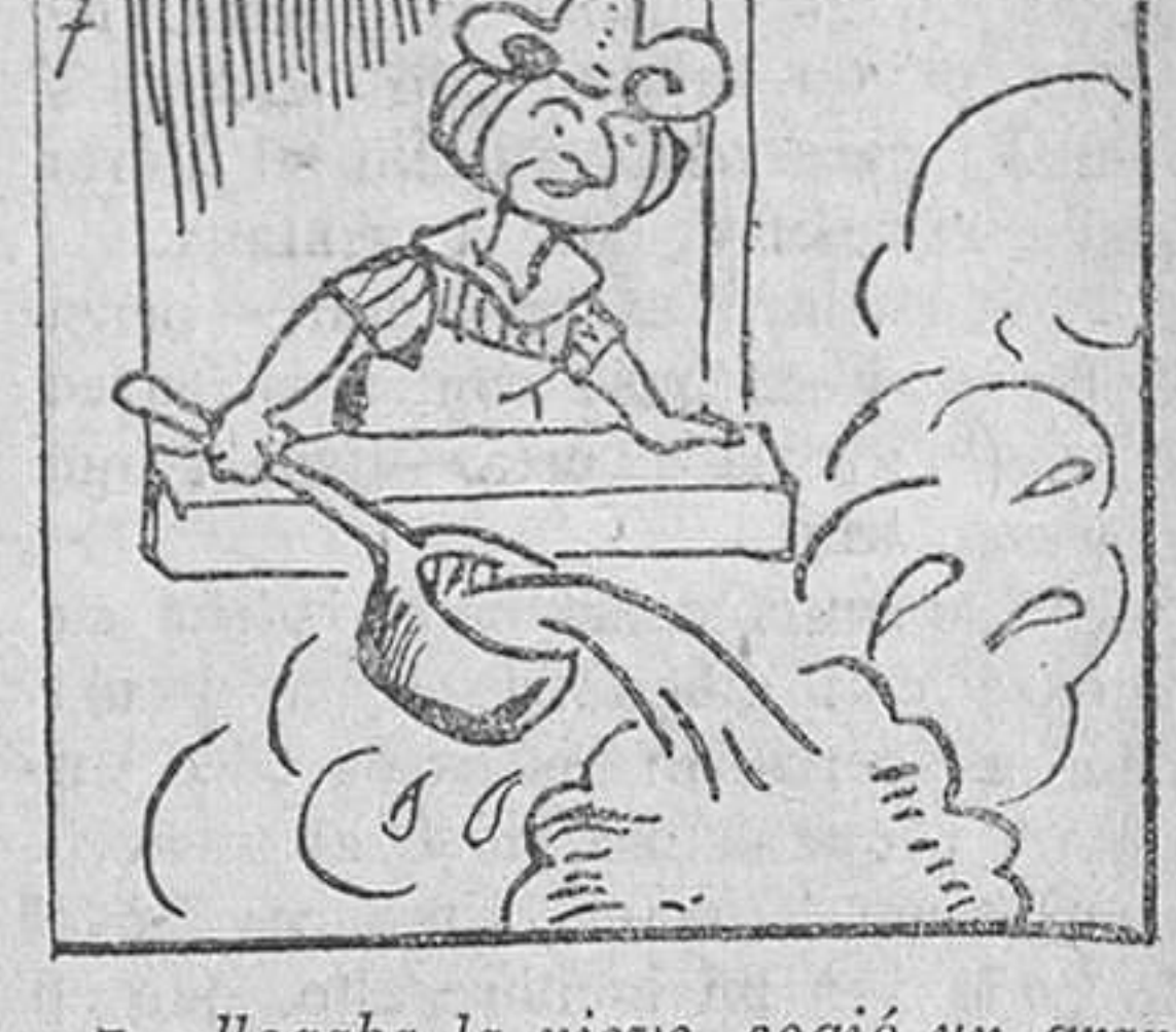
7. Llegaba la nieve, cogió un gran caso de agua hirviendo y lo vertió sobre aquéllo.