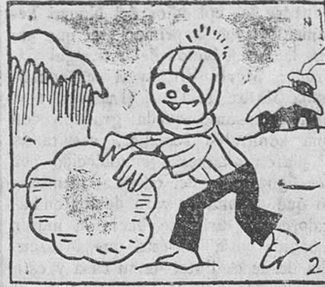
2. Su diversión favorita es fabricar grandes bolas de nieve, que luego arrastra gozoso.