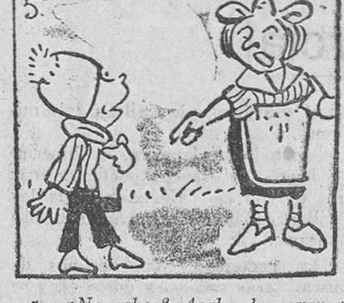
5. ¿No sabes? Acaba de nevar, y los copos alcanzan hasta la ventana. Dudó con razón la chica...