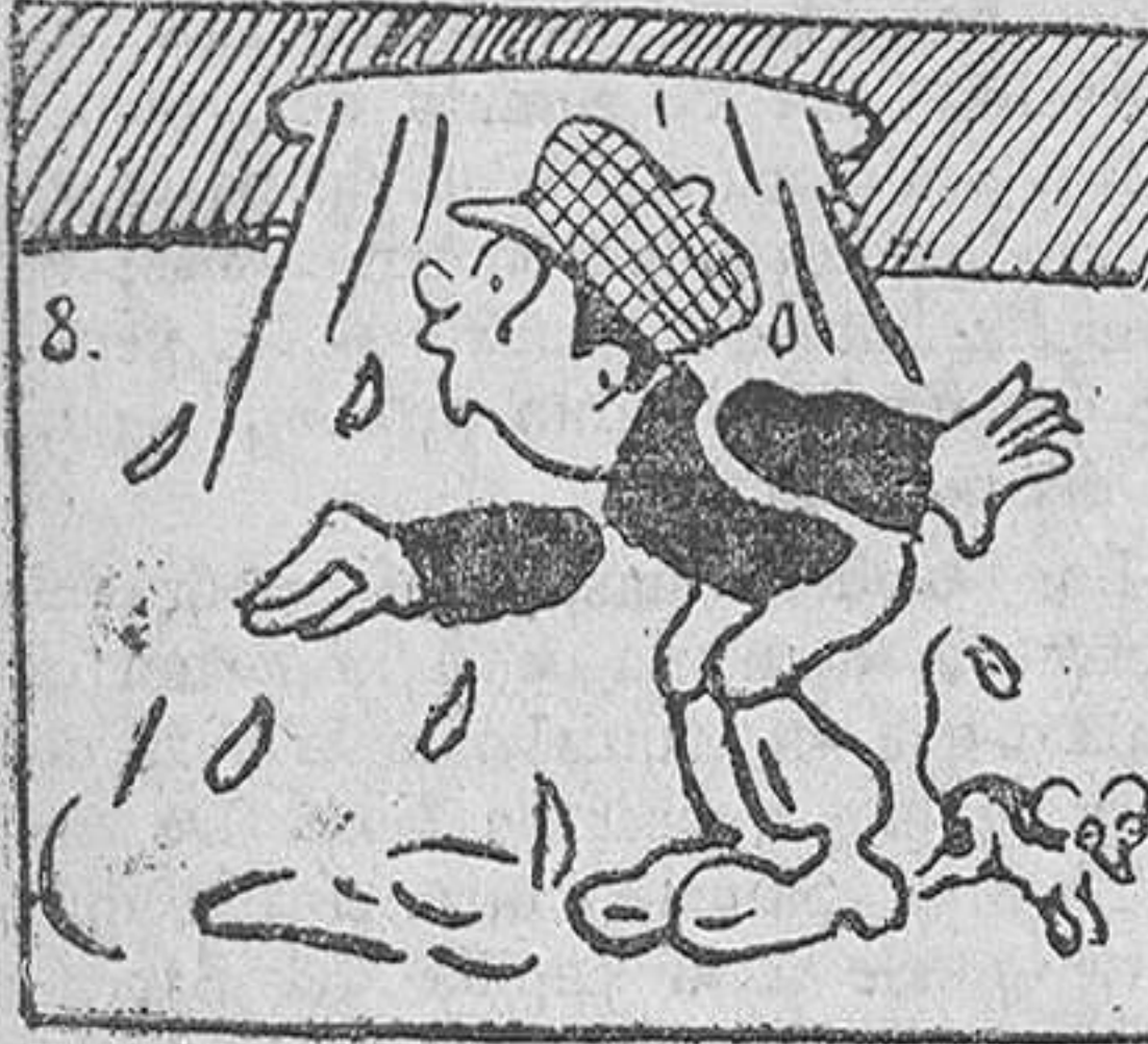
8. con tan mala fortuna, que al fundirse la bola, propinó un baño muy húsculo a su novio.

después vuelve a levantarse, pero con más lentitud que bajó. La duración del movimiento de caída varía de setenta y cinco a noventa y una milésimas de segundo: el tiempo que el párpado está bajo, es, cuando menos, de quince o diecisiete centésimas de segundo, y la tercera fase del acto, o sea el levantamiento del párpado, dura otras diecisiete centésimas de segundo. La duración del parpadeo completo es, por lo tanto, de unas cuarenta centésimas (o sea cuatro décimas) de segundo. Con lo dicho basta para probar que no hablamos con toda exactitud cuando decimos que un hecho tuvo lugar "en un abrir y cerrar de ojos", para indicar que fue prácticamente instantáneo.