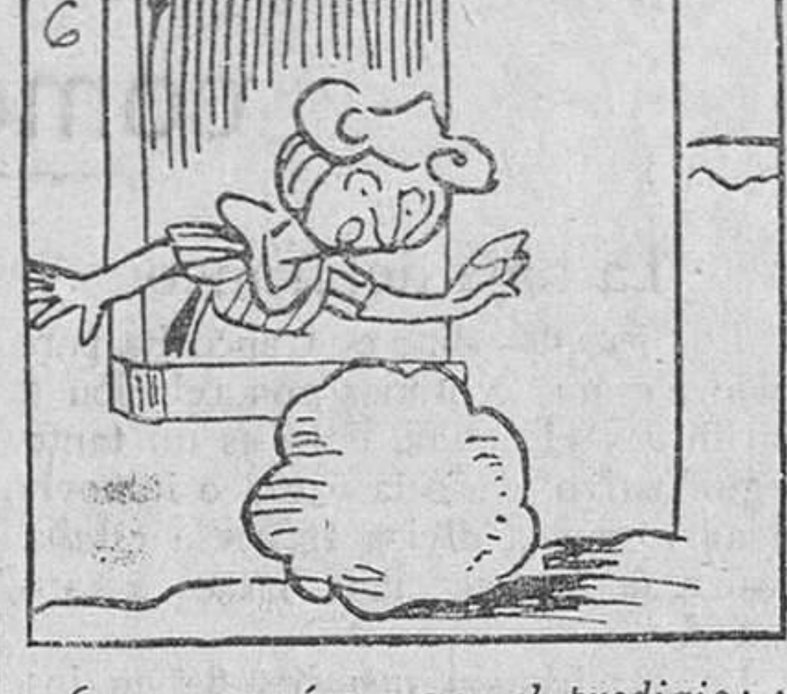
6. y asomóse a ver el prodigio; y al convencerse de que efectivamente hasta el pozo de la ventana