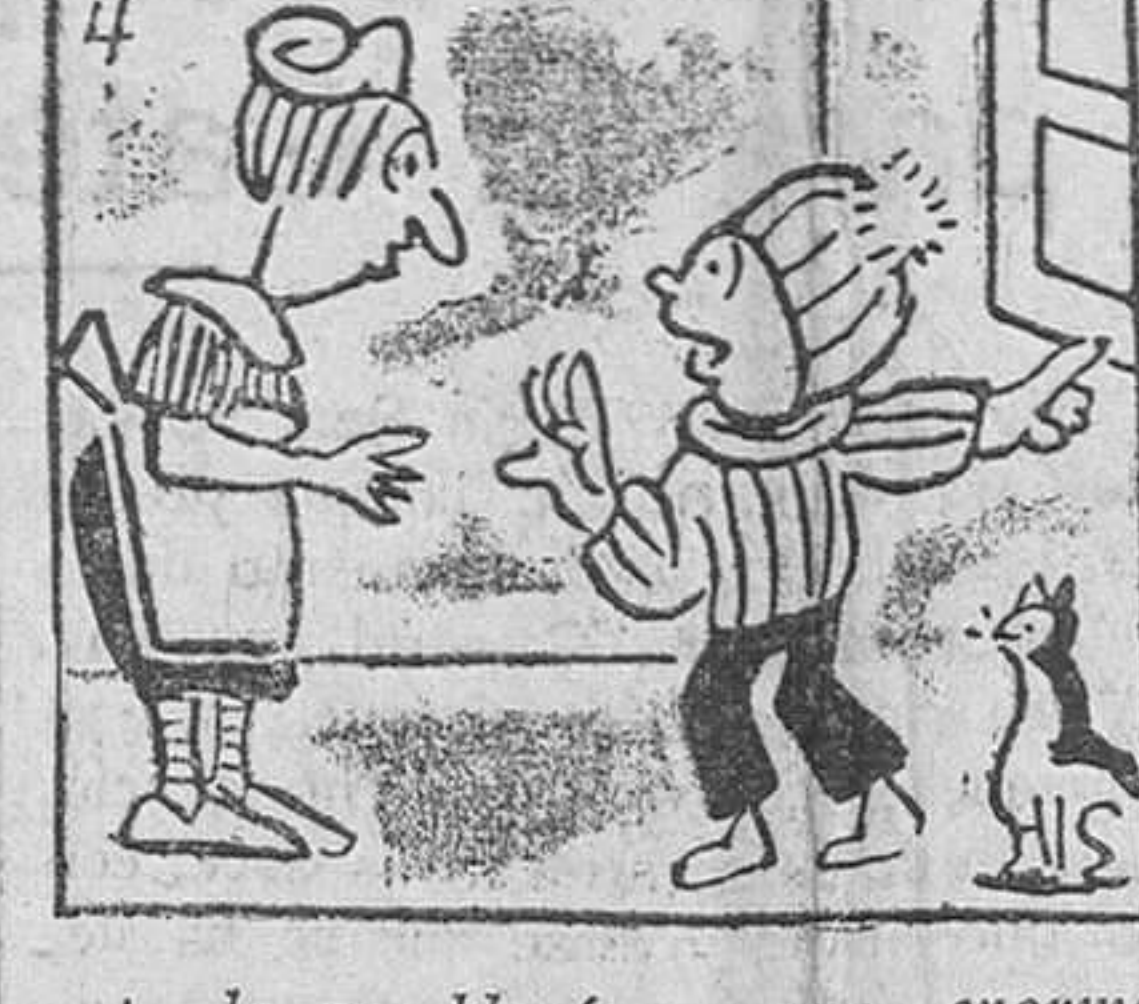
4. La que blocó con una enorme mole de nieve; y corrió a prevenir a su muchacha.