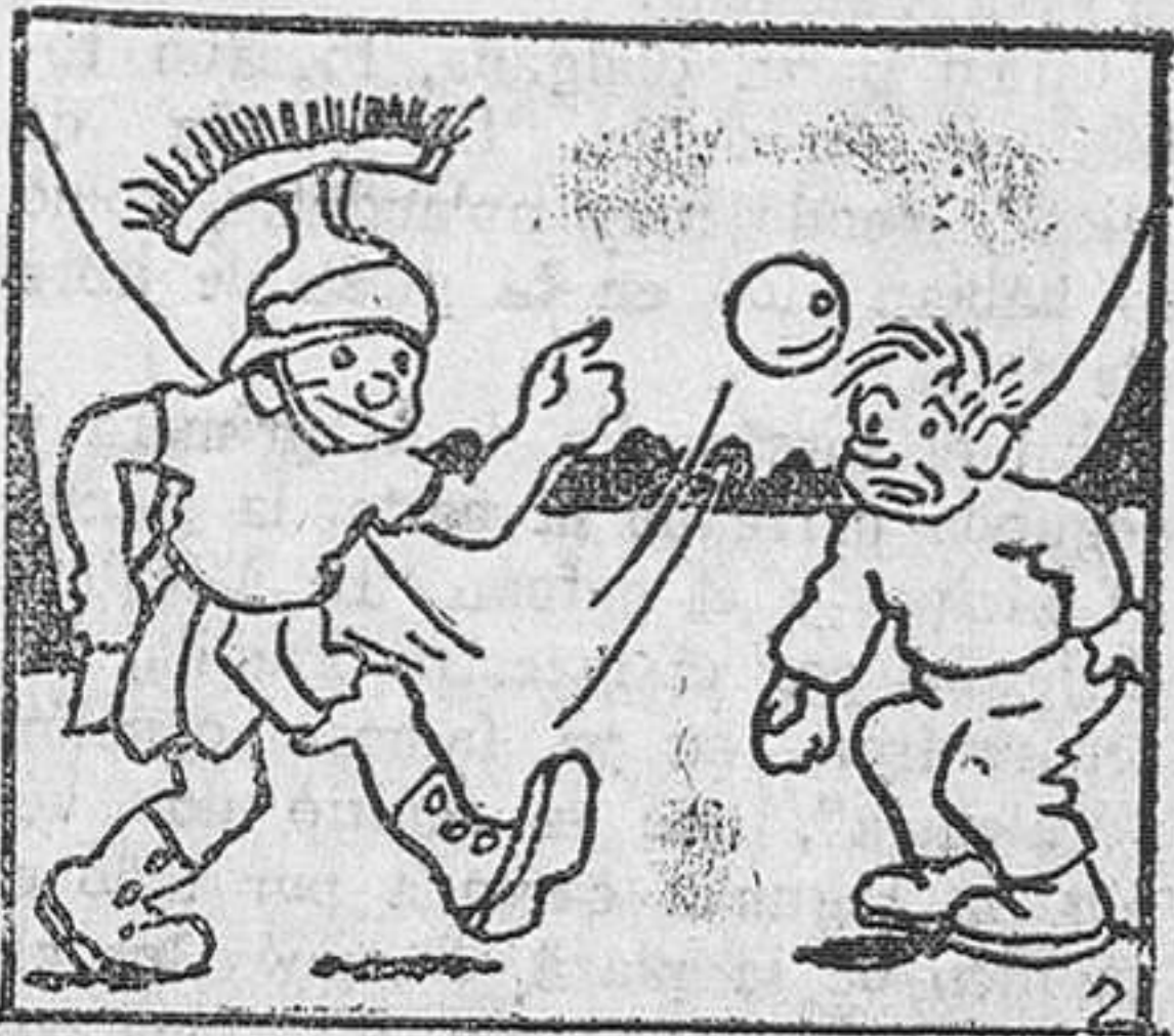
2.—granadero reexpió de un puntapié la pelota y amenazó a Pepito con hacer lo mismo con él si reincidía

—En una barbería: —Maestro, esa navajita me desuella. —¿Cómo puede ser eso! Si no le falta más que hablar.