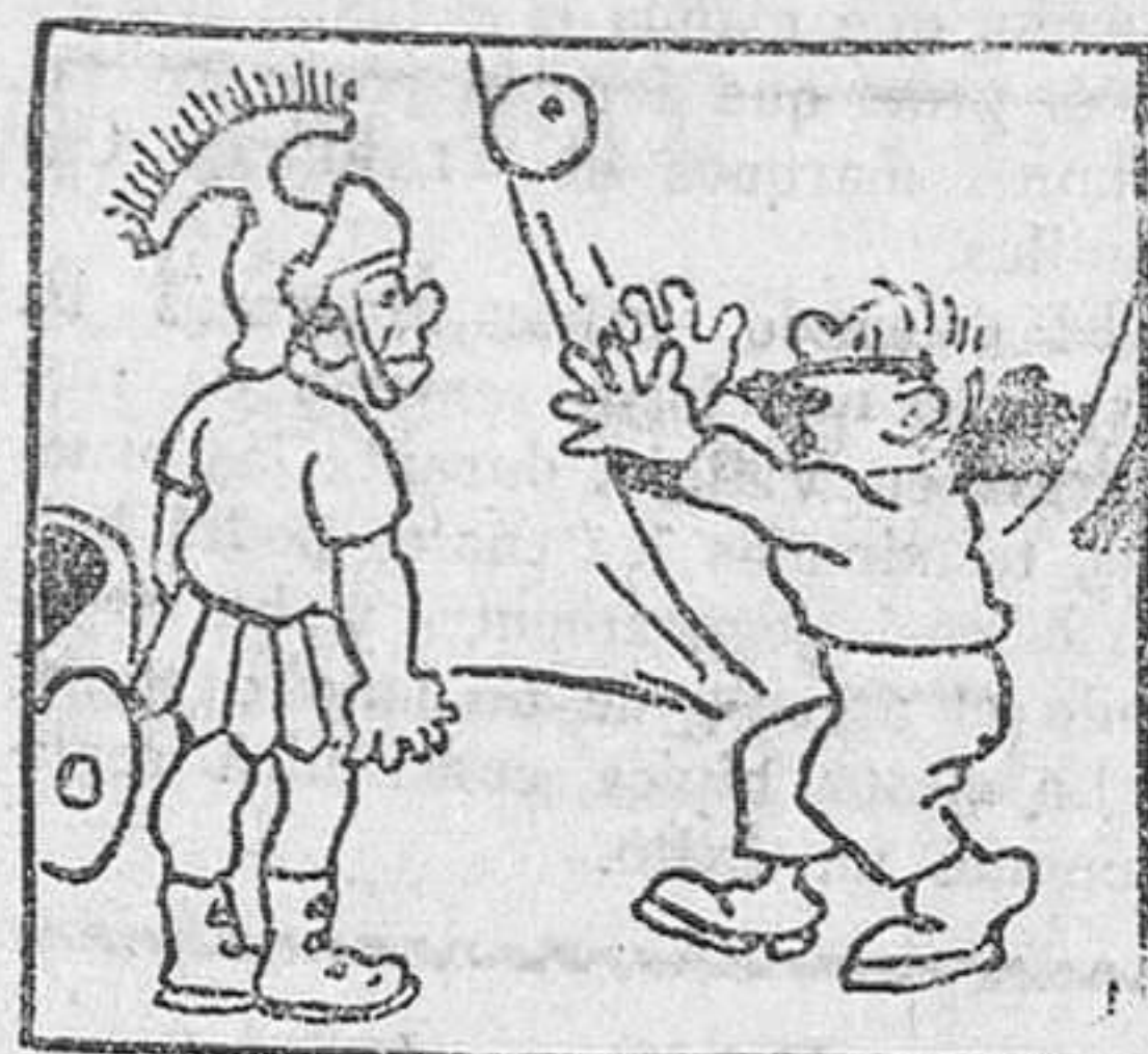
1.—Jugando, a Pepito le cayó la pelota en el campamento de legionarios, en el que un...