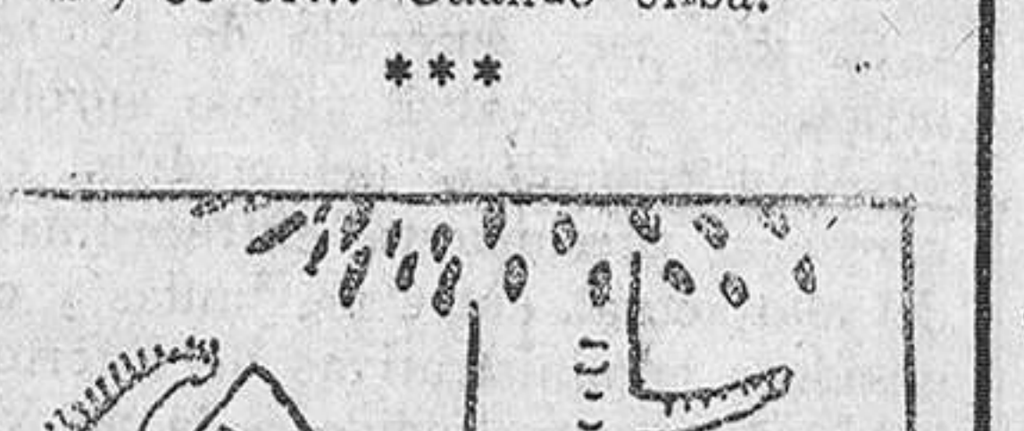
7.—y comprendiendo el soldado que había sido objeto de una broma, echó a correr tras el chiquillo,

En la estación de... —¿Haría el favor de decirme cuándo sale el tren? —Sí, señor... Cuando silba.