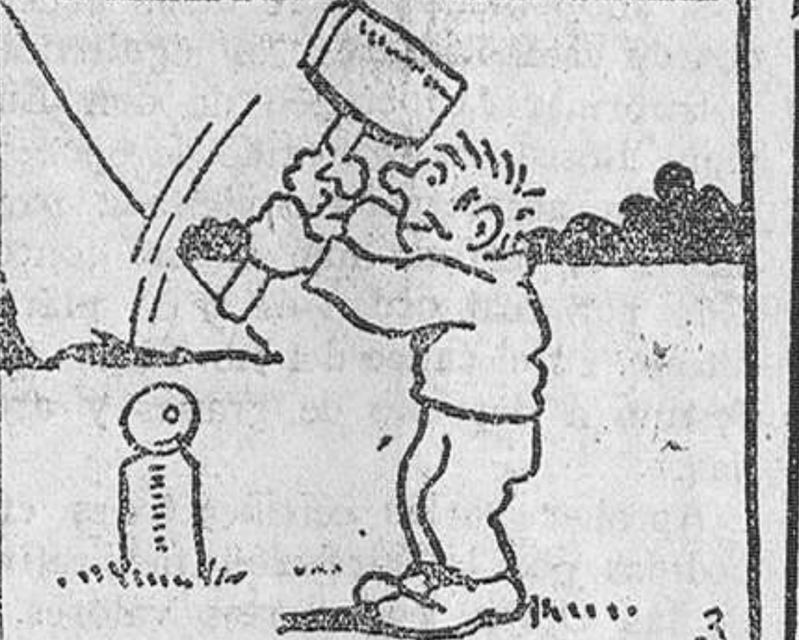
3.—Pepito aprovechó la primer ocasión para enterrar un grueso palo de botos

Aplicación práctica de este invento? Sencillísima. El tamaño del globo y de la carga de hidrógeno están calculados de forma que la fuerza ascensional es inferior en cuatro o cinco kilos al individuo que le utiliza y que va sujeto a él por un cinturón y unas sobaqueras. El globo se eleva un metro sobre la cabeza del viajero. Este, casi ingrátido, tiene que realizar un esfuerzo mínimo para deslizarse sobre la tierra. Camina como en volandas, y si hace hincapié para saltar salva distancias de 25 a 30 metros con la misma facilidad y con idéntico esfuerzo que empleamos hoy para salvar el borde de una acera.