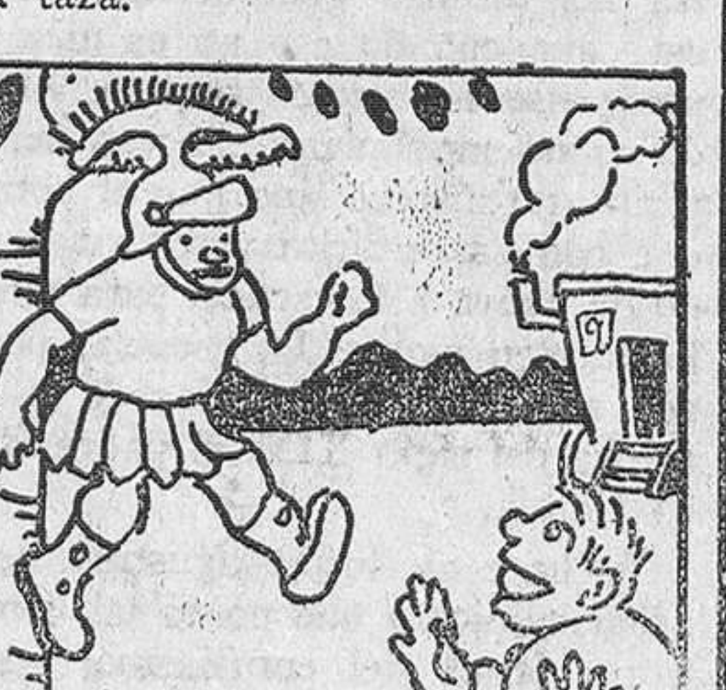
9.—como veis, colgando del casco, con lo que, ansioso vengar una pequeña broma, vino a caer víctima de una burla mayor.

Con el metal de una pieza de dos centavos ha construido un relojero de Dublin una tetera, una taza, un platillo y una cucharilla de dimensiones minúsculas, como puede suponerse. Comenzó por machacar la pieza hasta convertirla en una finísima lámina, de la que hizo la tetera, y forjó asimismo la cucharilla, el plato y la taza.