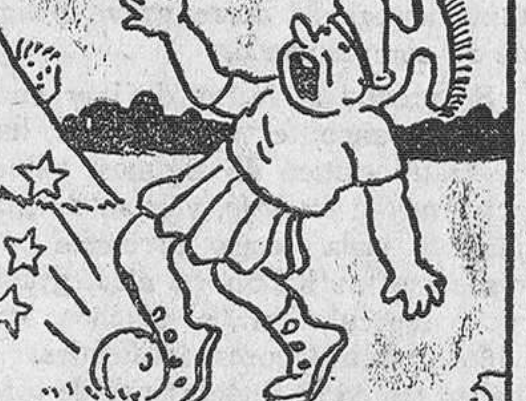
5.—lo que no pudo lograr, como podréis suponer; pero, en cambio, nuestro hombre vió todas las estrellas.

Aquel que halle gusto en contarle las faltas de los otros, ten la seguridad que no dejará de contar a los demás las que tú cometes.