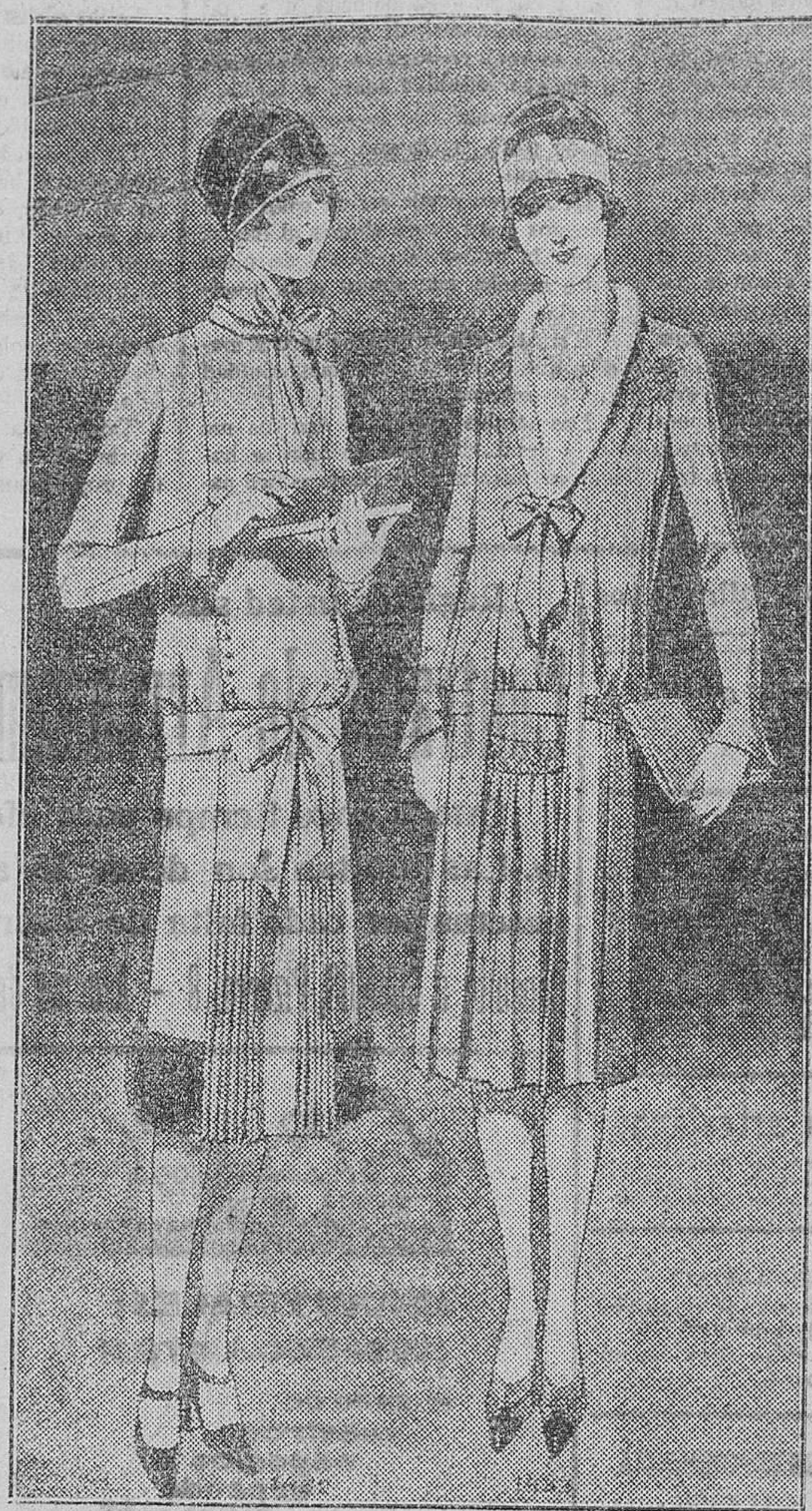
Pos elegantes trajes de tarde. El primero confeccionado en «kasha» roja y tul. Cuello derecho y corbata anudada. Cintura y echarpe de terciopelo. Botones de galali y bordes de piel oscura. El segundo confeccionado en «feline» lilas de Parma. Hombros subidos con pequeños pliegues, costados incrustados de dientes puntiagudos formando dos grandes pliegues. Cinturón de piel de oro viejo. Bordes de piel clara y corbata de tisú.