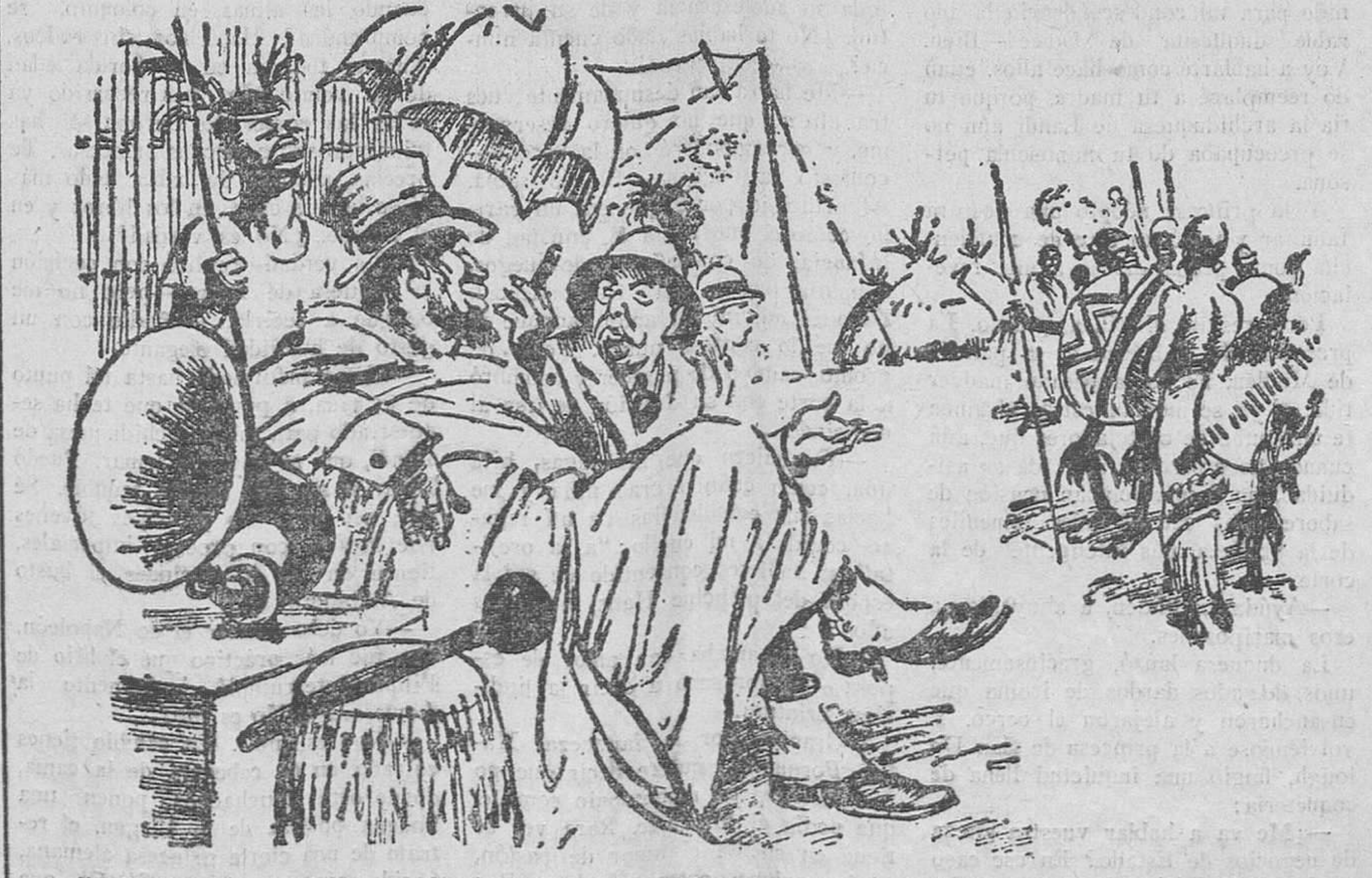
El explorador.—¿Cómo se llama esa danza que han ejecutado? El jefe negro.—No lo sé; es retransmitida de Hotel Savoy, de Londres. (De T. S. H.)