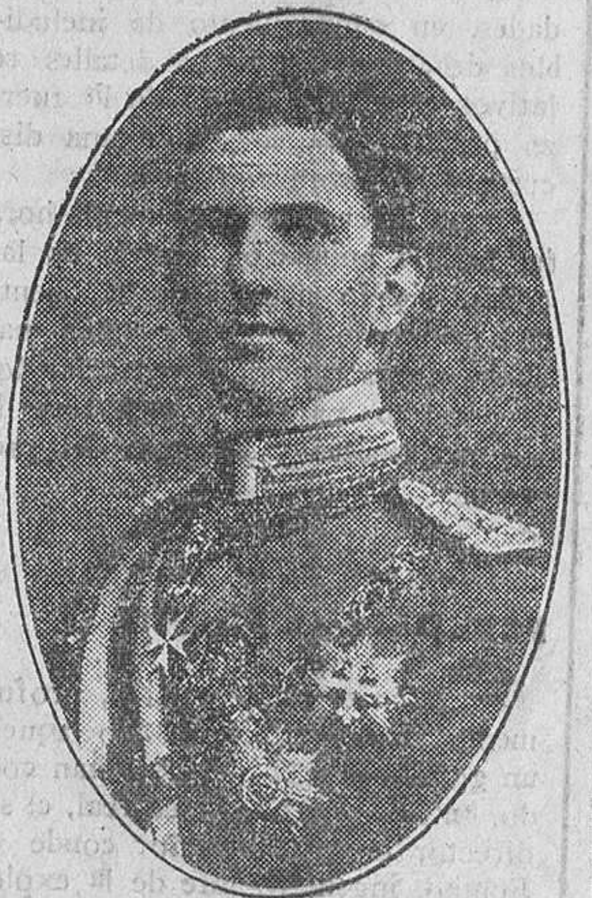
Príncipe de Piemonte Heredero de la corona de Italia

DEDICA DESDE ESTAS COLUMNAS UNA CARINOSA SALUTACIÓN DE BIENVENIDA A LOS REYES DE LA NACIÓN HERMANA