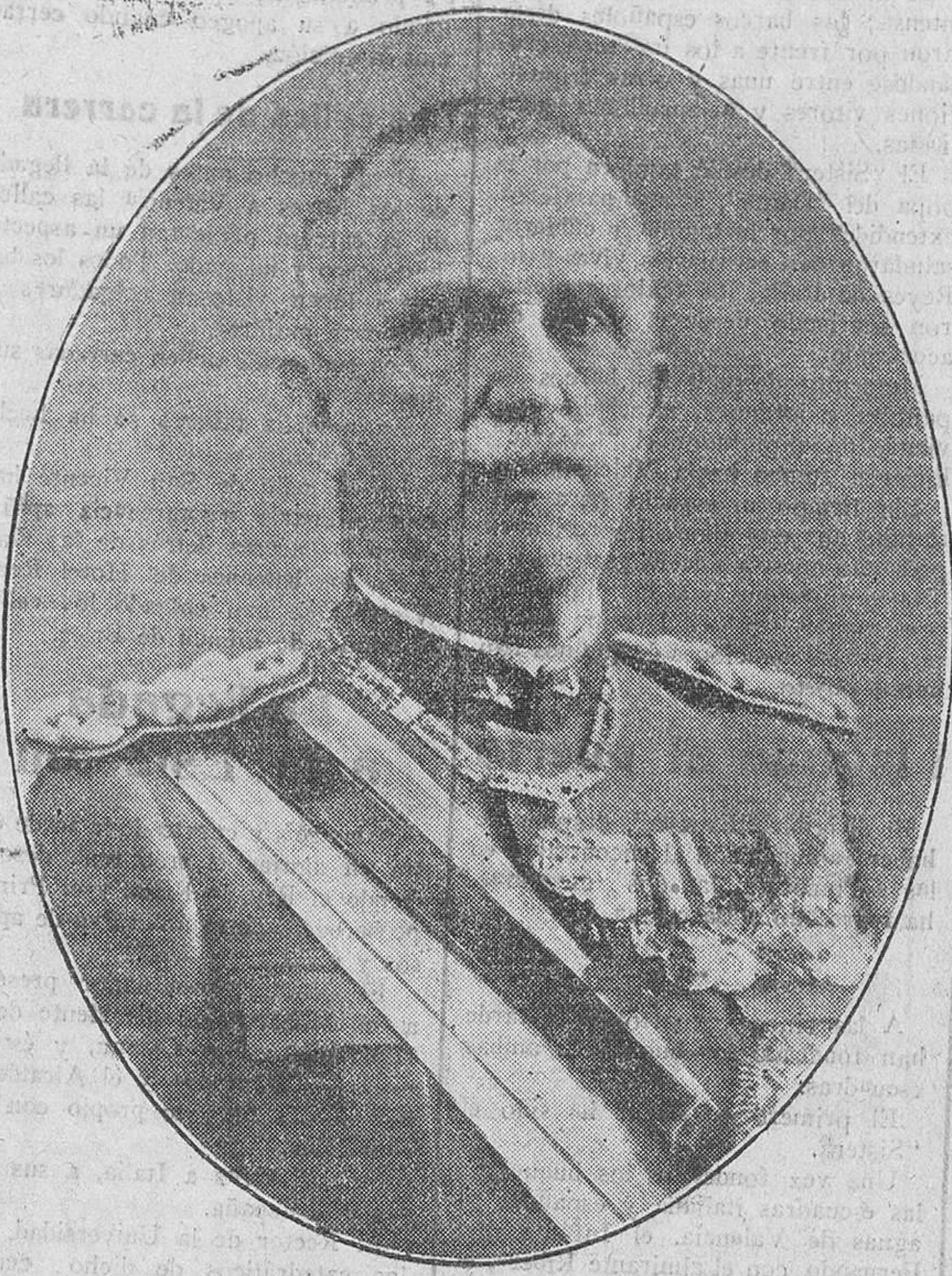
Victor Manuel III Rey de Italia

Por arbitrio de carnes: Matadero general, 3.523,74; Matadero del Grao, 515,27; Matadero del Cabañal, 265,38; Matadero de Benimámet, 3; estacion de sanitarias, 1.659,80. Por análisis y examen de sustancias, 65,47. Por circulación rodada, 875. Por pesquerías, 3.383,33. Por arbitrios extraordinarios, 95,15. Por bebidas, 5.270,90. Total, 17.032,64.