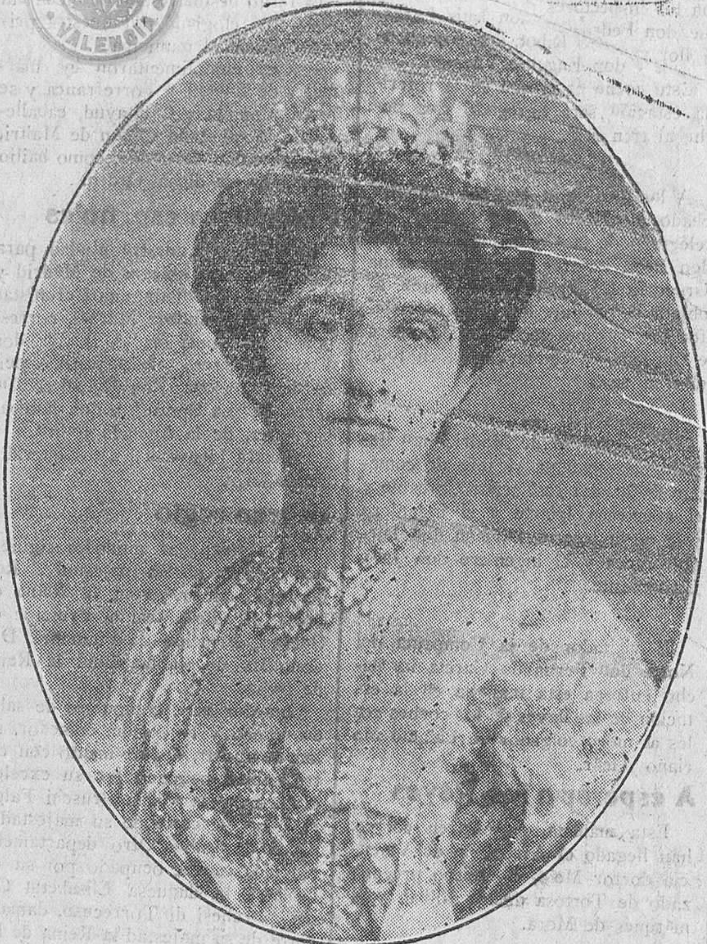
Elena de Montenegro Reina de Italia