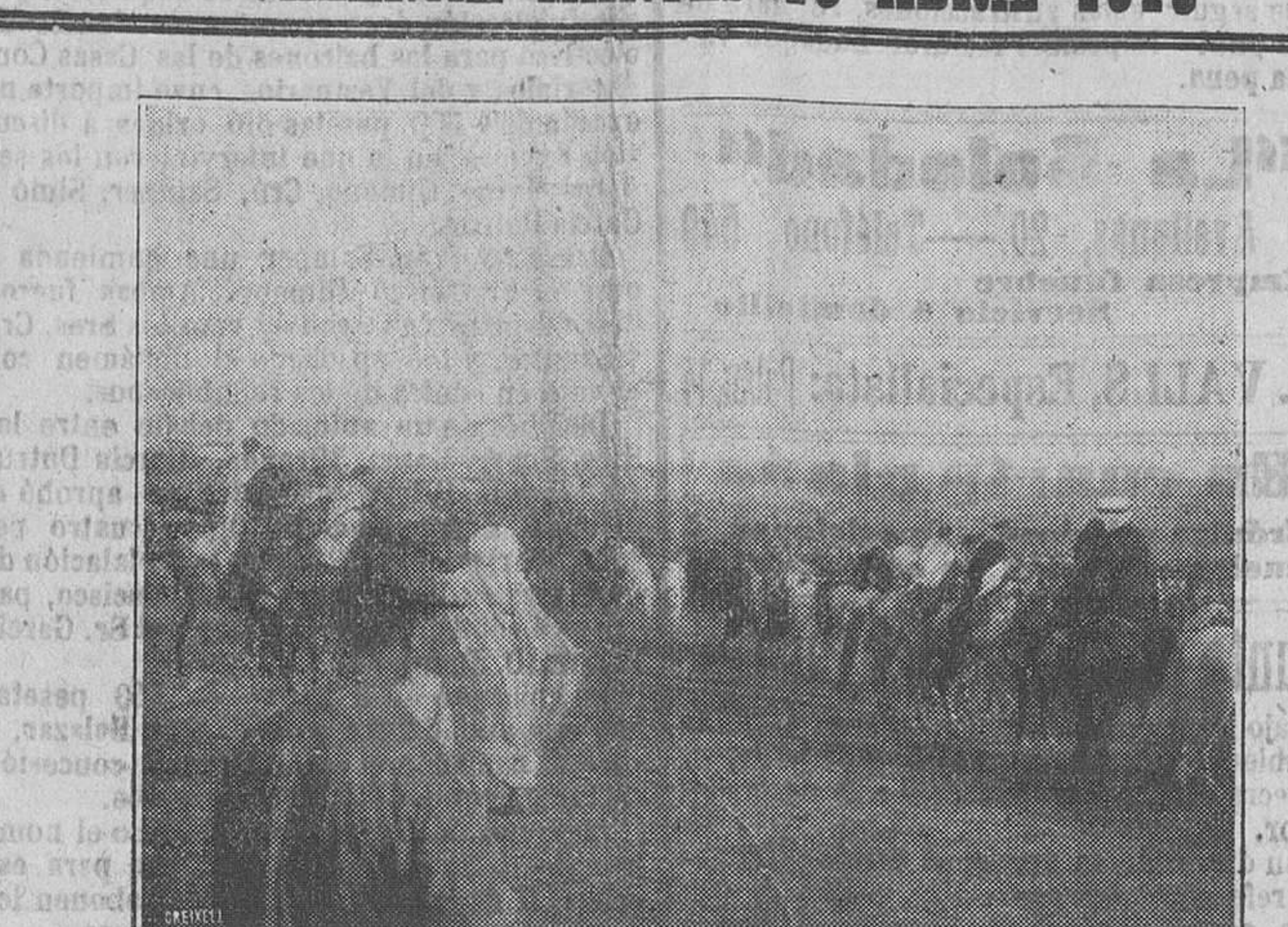
Los ginetes moros disponiéndose a maniobrar en Carabanchel

En las distintas frases que cambió con las personas que tenía más cerca continuó dando pruebas de su cinismo pasmoso.