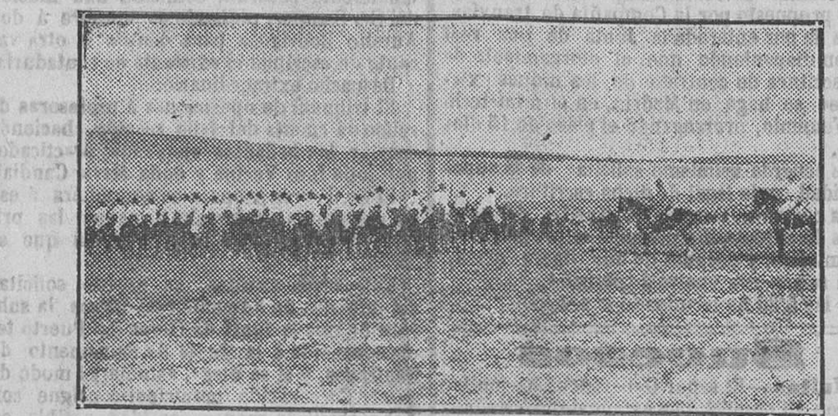
Los indígenas de caballería haciendo ejercicios en las inmediaciones de su campamento de Carabanchel

Al hablar de su revólver dijo estas palabras: «Qué rico era!»