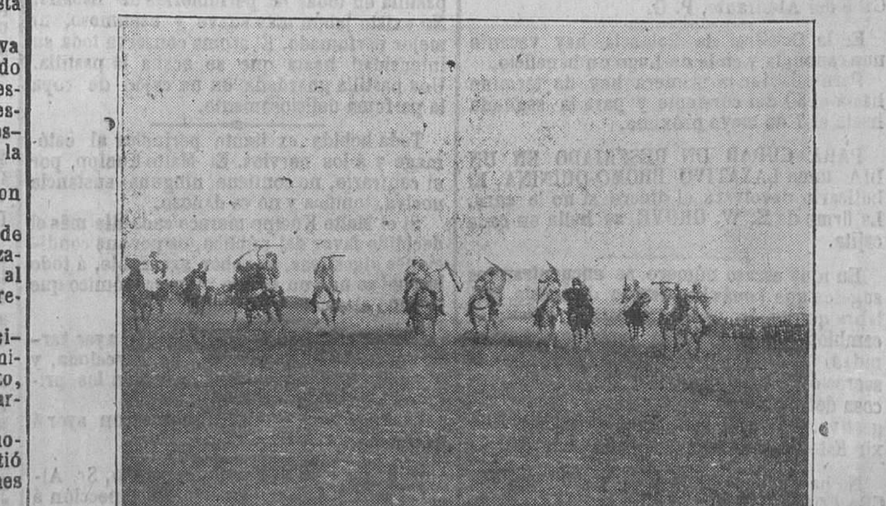
Los moros corriendo la pólvora

La cuota de inscripción es la de 10 pesetas.