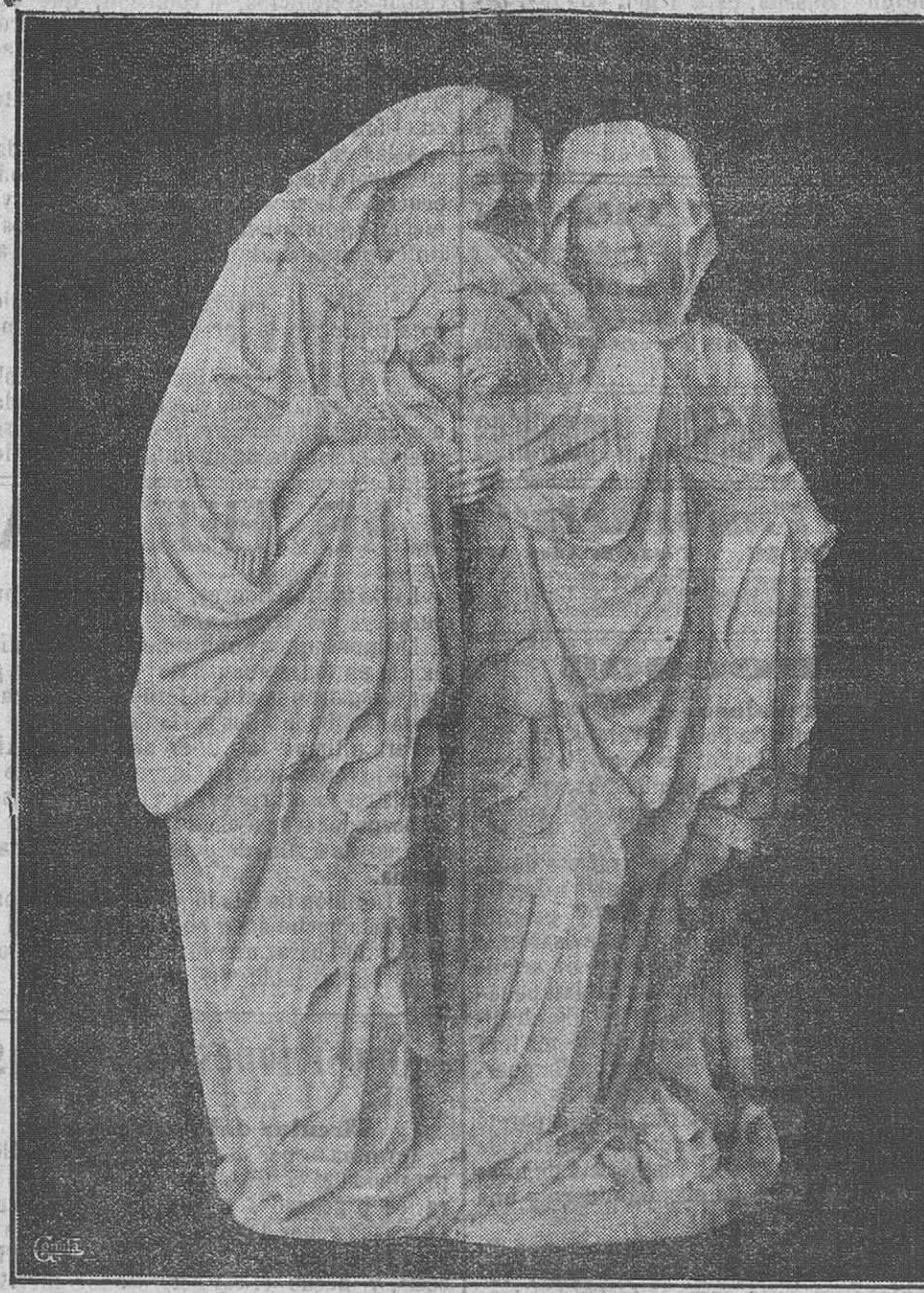
Las tres Marias.—Alabastro.—Siglo XV