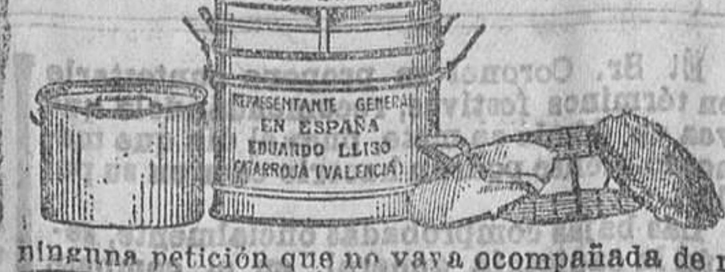
ninguna petición que no vaya acompañada de referencias a mi satisfacción.