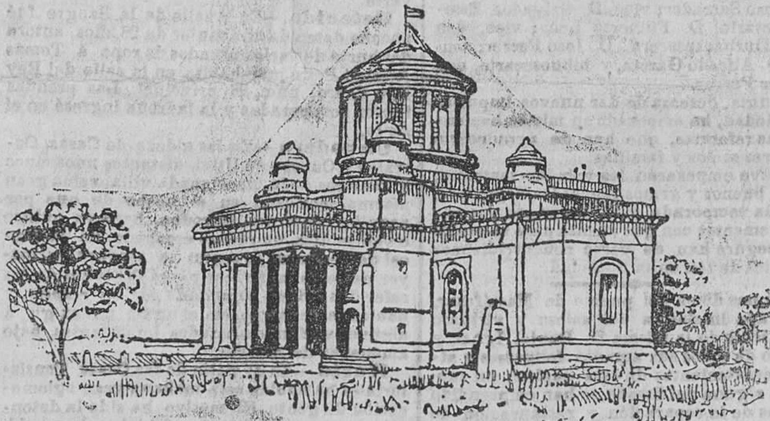
Vista del Observatorio astronómico de Madrid

El dicho año de mil e quatro cientos y setenta y ocho, a veintinueve dias del mes de julio, día de Santa Marta, a medio día, fixo el Sol un eclipse, el más espantoso que nunca los que hasta allí eran nacidos vieron, que se cubrió el sol de todo e se paró negro, e parecian las estrellas en el cielo como de noche; el cual duró así cubierto muy gran rato, fasta que poco a poco se fué descubriendo, e fué gran temor en las gentes y fanán a las iglesias, y unos de aquel ora tornó el Sol en su color, ni el día esclareció como los dias de antes solía estar, e así se puso muy caliginoso.