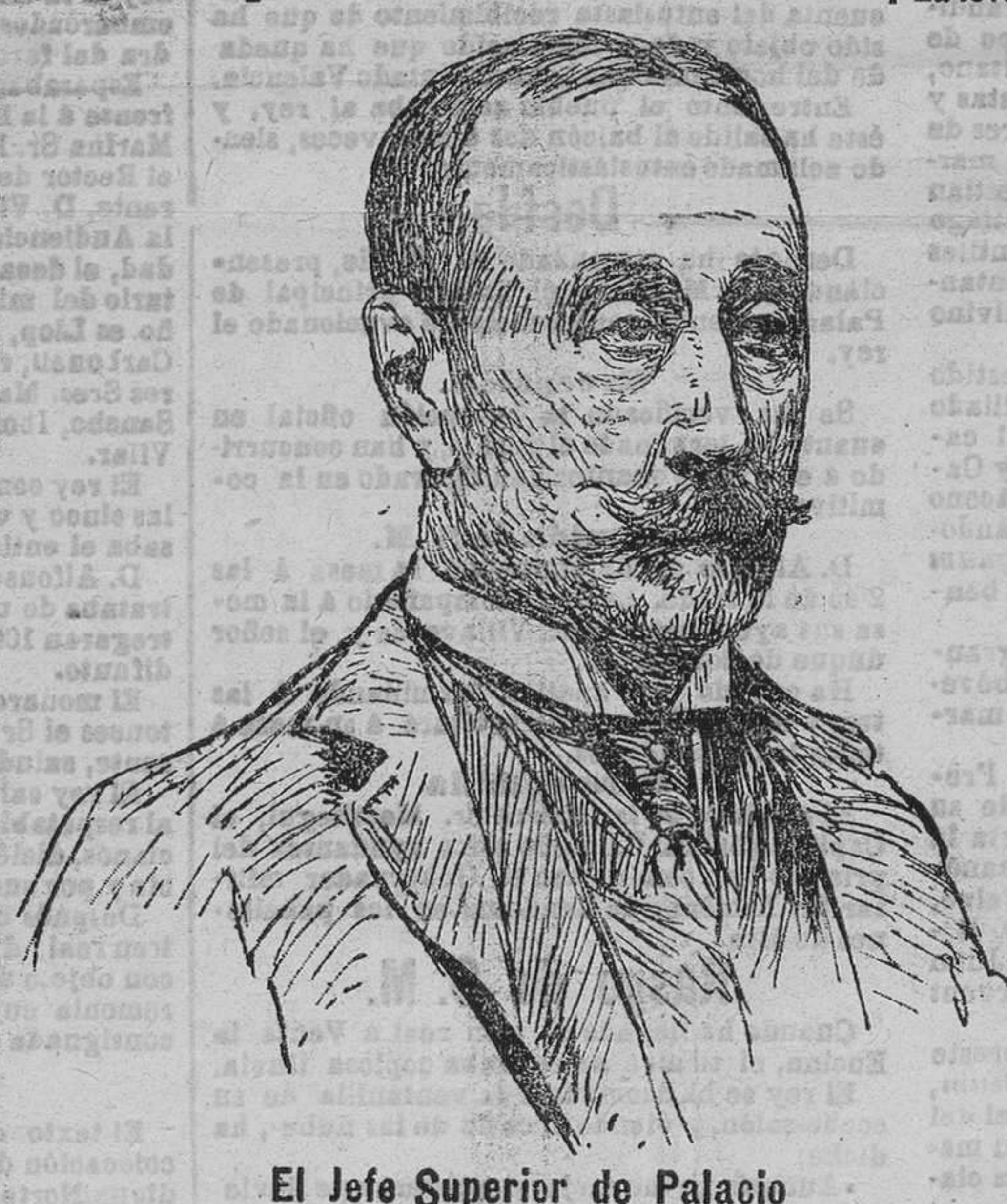
El Jefe Superior de Palacio Señor Duque de Solomayor