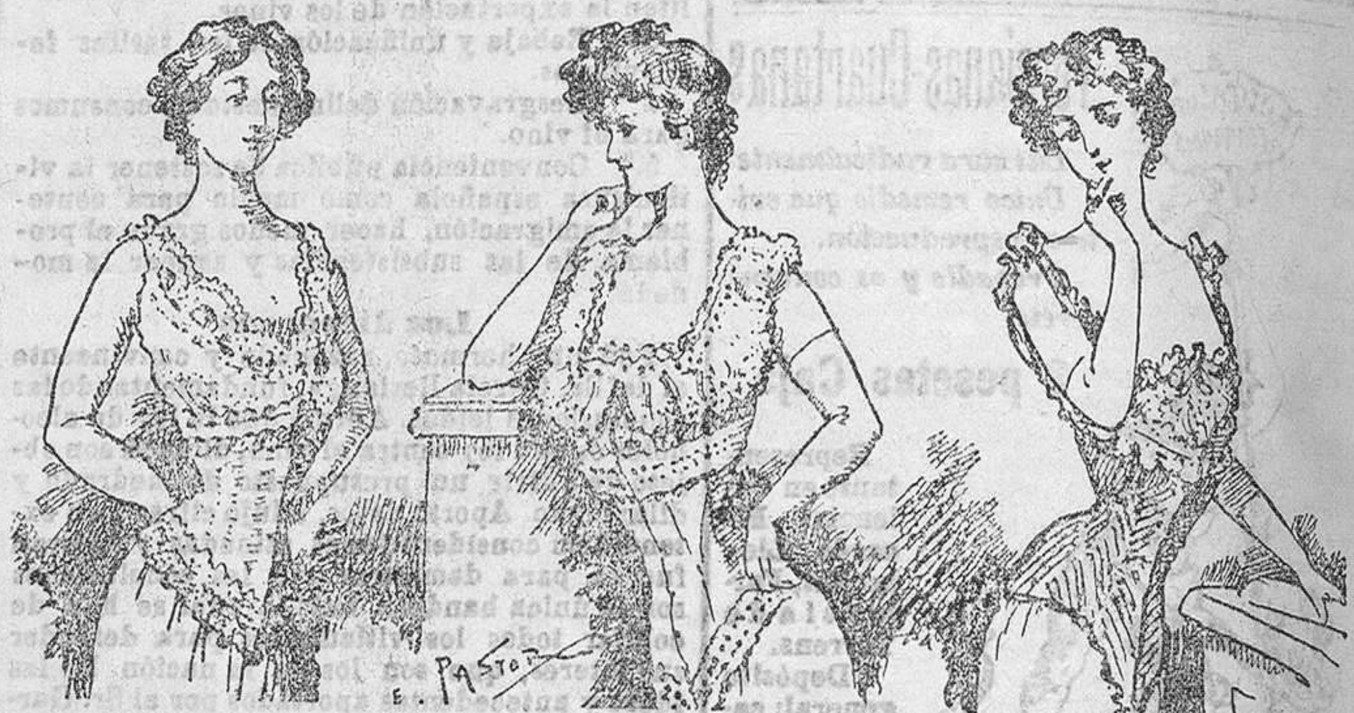
Primera casa en modelos Paris y confecciones a la medida

Corsés más elegantes no se confeccionan en ninguna parte Hay que ver lo que gana en esbeler y elegancia la señora que usa corsé de esta casa. Más barato que aquí no comprarán en ninguna parte