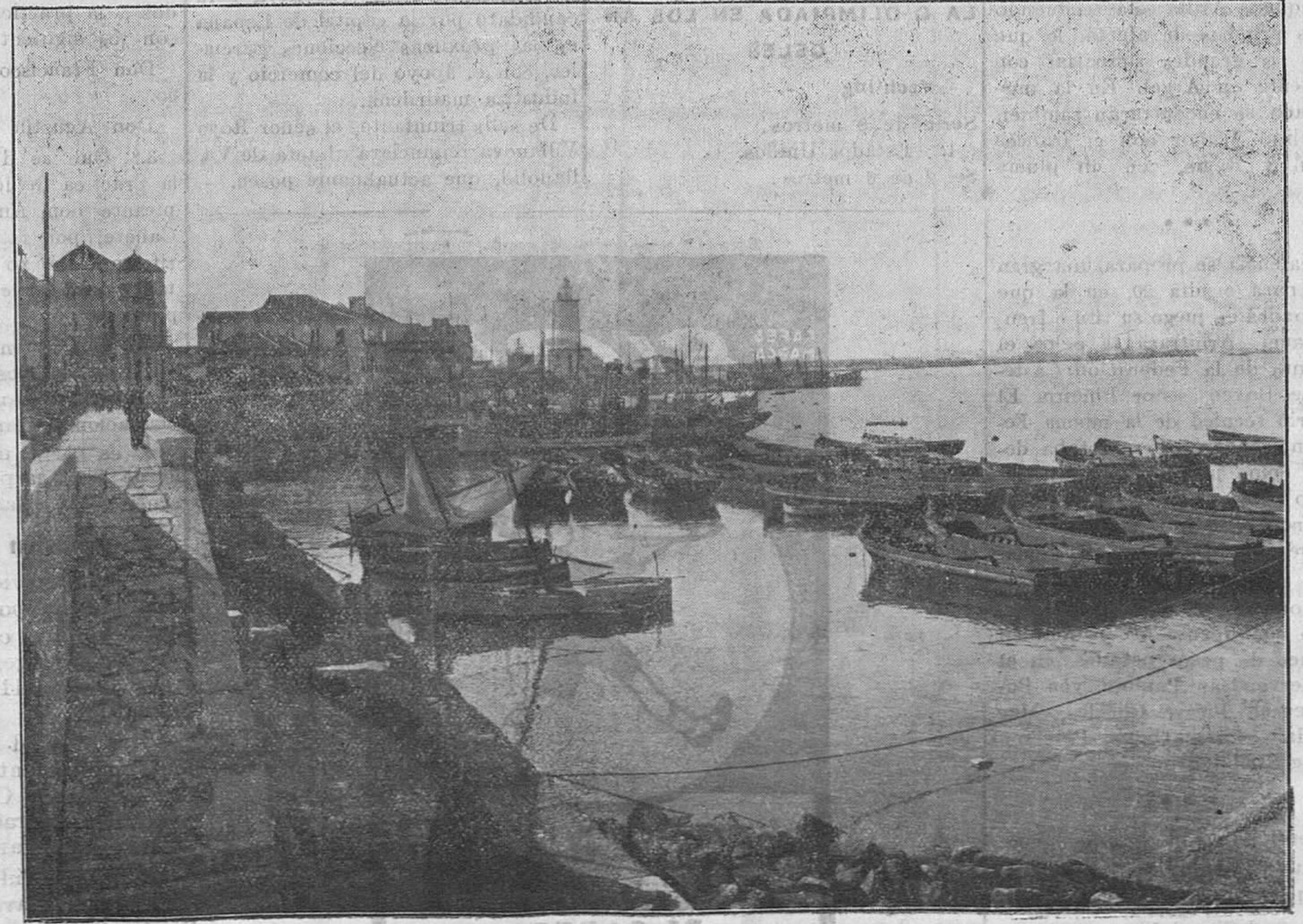
UN DETALLE DEL PUERTO Y AL FONDO LA CATEDRAL