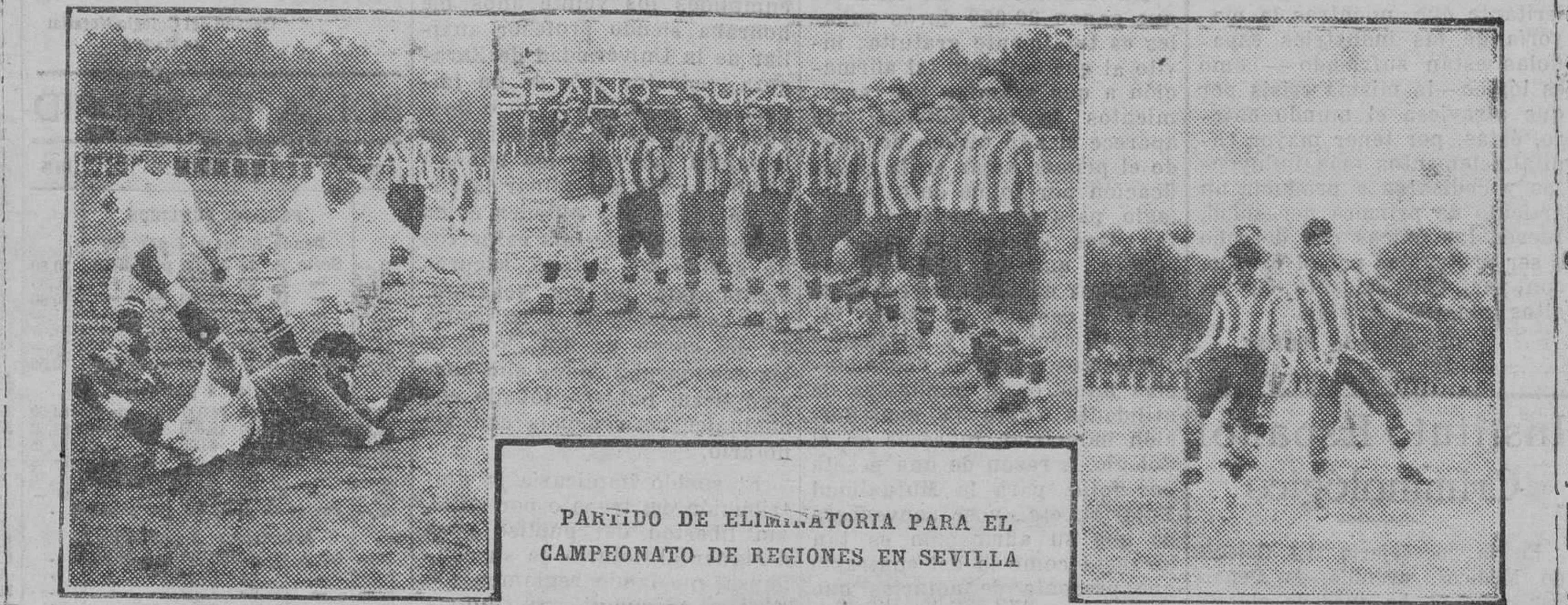
1. Soutizo arrebató el balón de los pies de Rey, borrando un pase de Spencer. 2. El equipo de los posibles, que ha sido vencido por el Sevilla F. C. 3. Una "melée" peligrosa en la portería de los posibles.