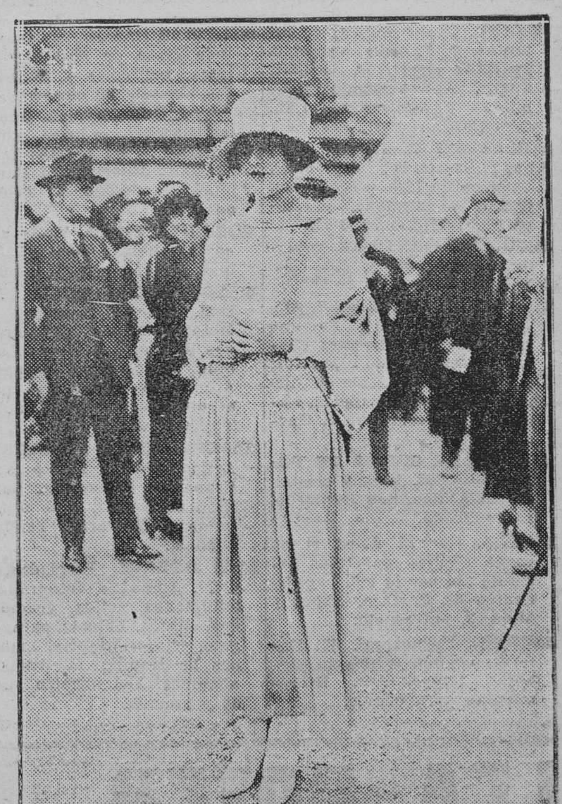
Otra creación de los modistos de París, exhibida en Biarritz.