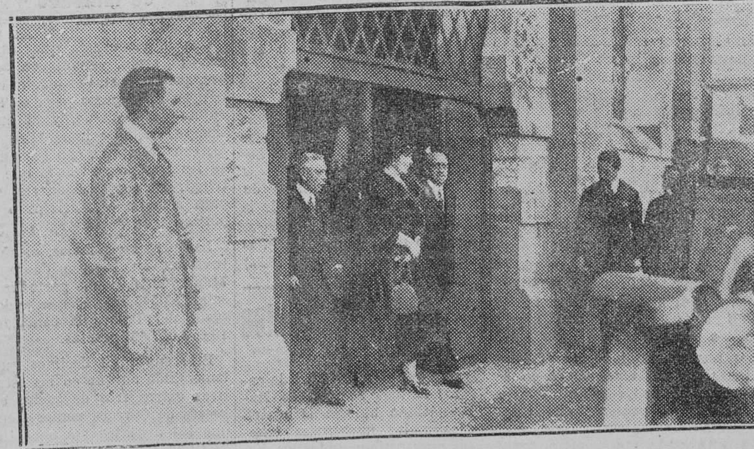
Su Majestad la reina Victoria saliendo de la plaza de toros, acompañada del capitán general de la región, Sr. Moltó, y el gobernador militar, Sr. Querol.