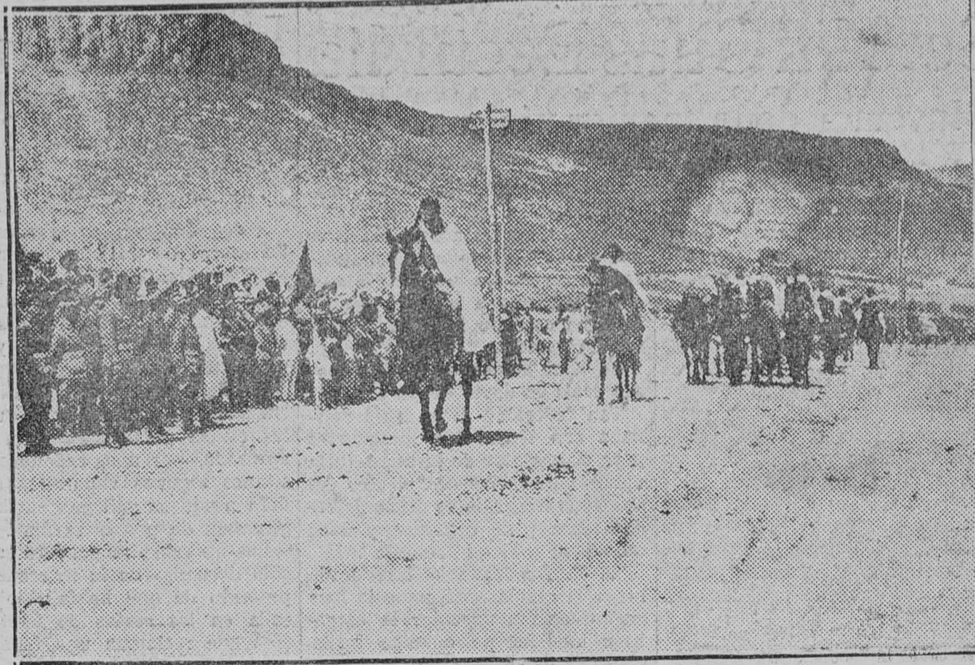
EN EL CAMPAMENTO DE SEGANGAN

Almería 21.—Ha fondeado el "Dédalo", procedente de Melilla, adonde regresará al tomar 600 toneladas de agua.