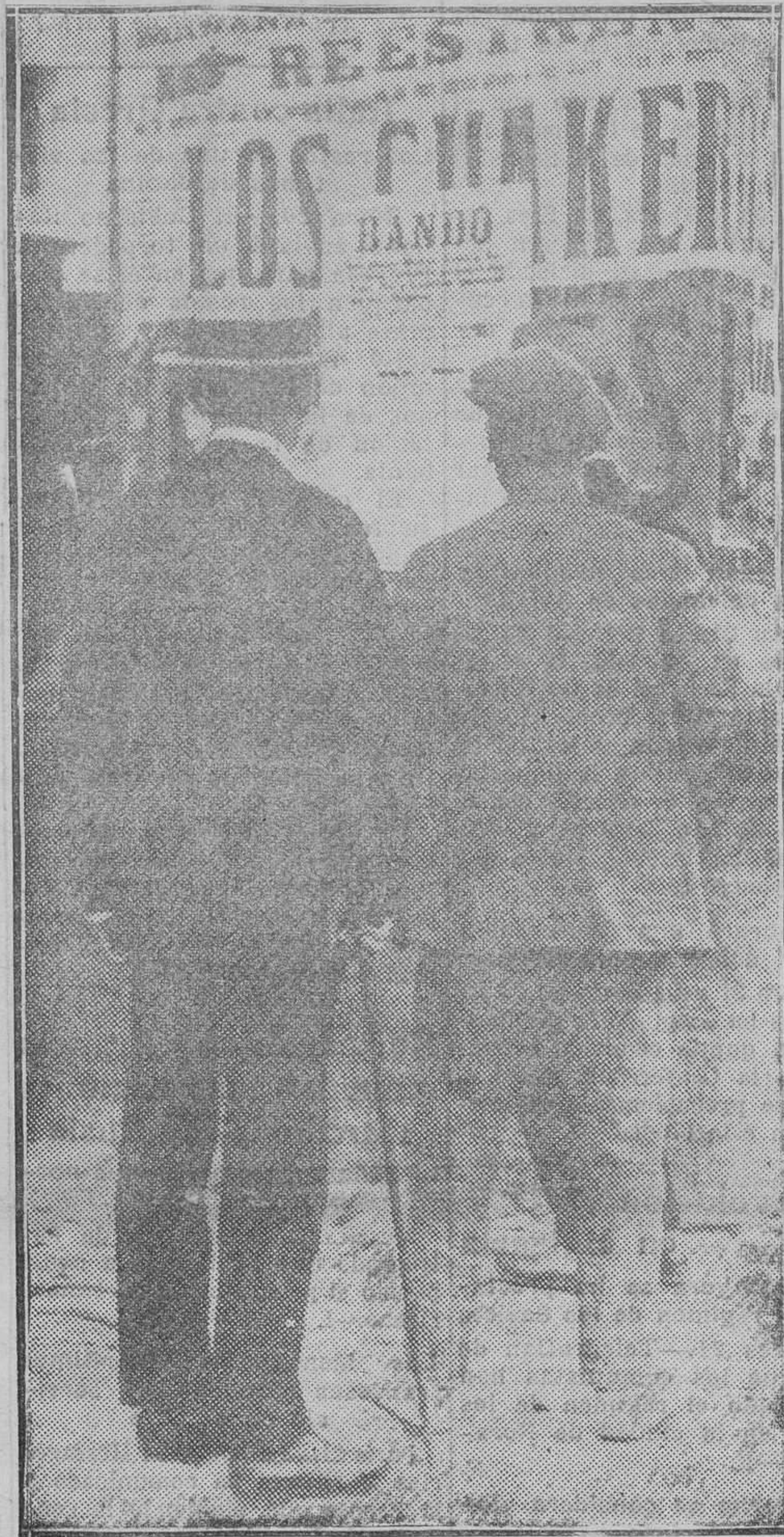
El público leyendo el bando del capitán general.

Por orden del juez han ingresado en la cárcel los tres lecheros y el guardia municipal detenidos por vender una fórmula que, según ellos, servía para conservar la leche en buenas condiciones durante varios días.