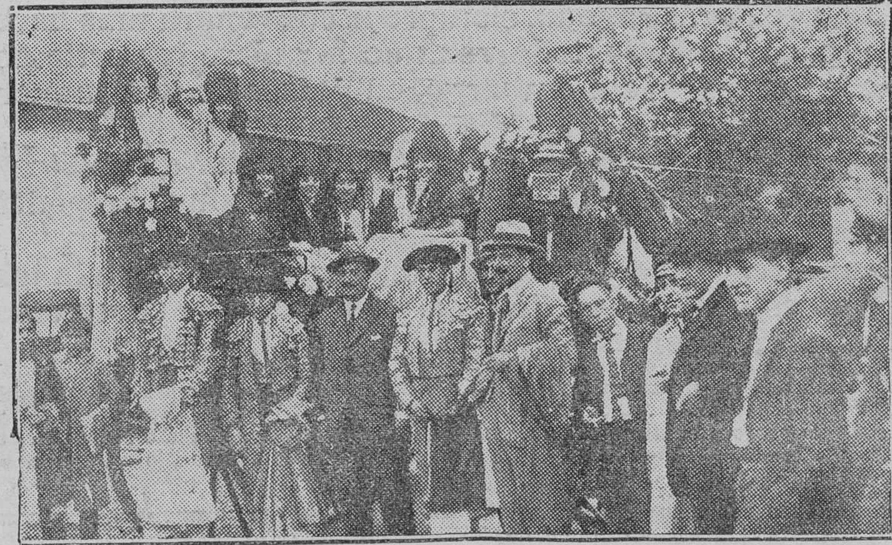
Señoritas de la aristocracia que presidieron la corrida de Beneficencia con los diestros que tomaron parte en dicha corrida.