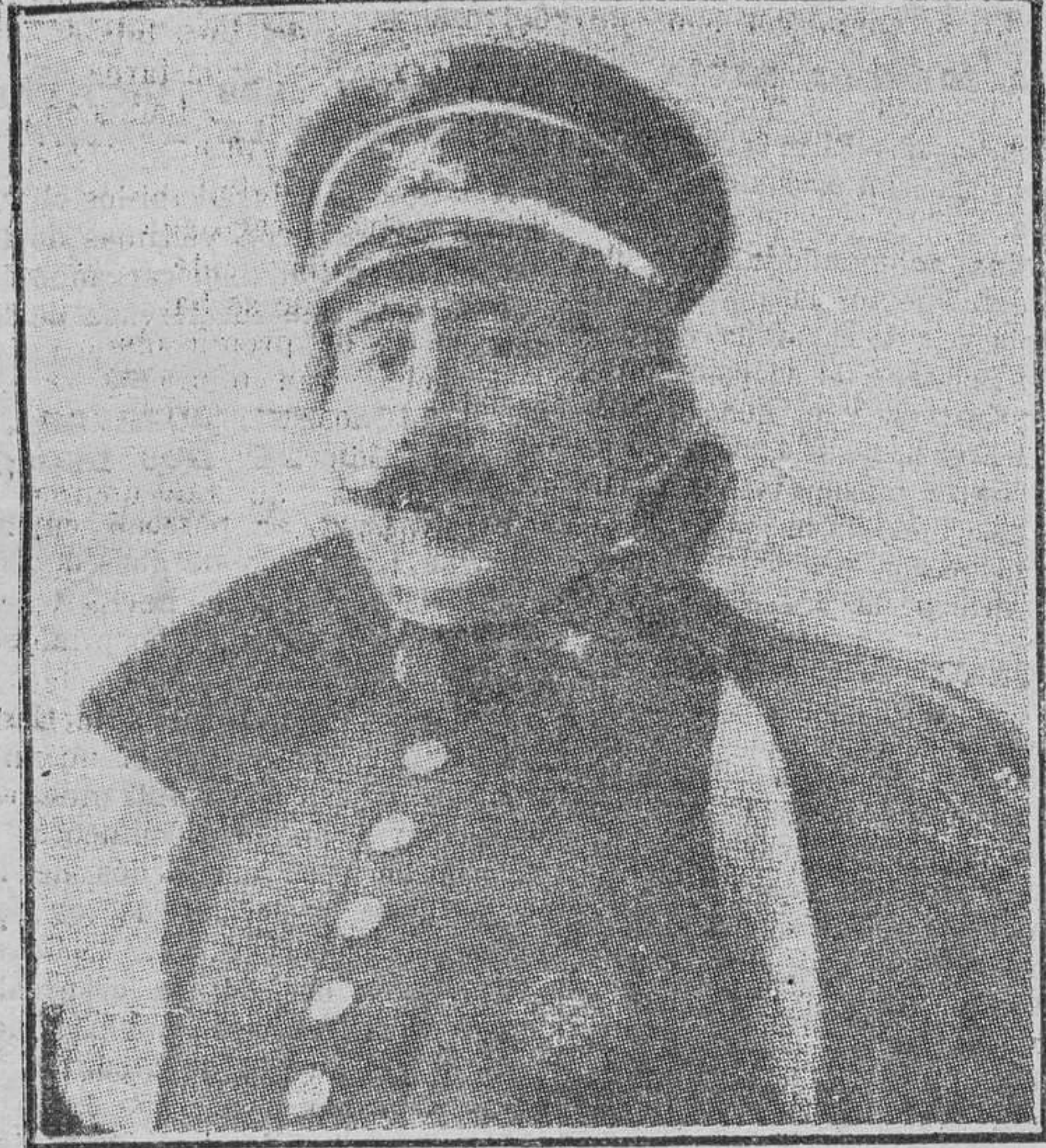
El general Burguete, que, con la autorización o por mandato del Gobierno del Sr. Sánchez Guerra, pactó con el Raisuni, error político y militar cuyas consecuencias se apreciarán algún día.