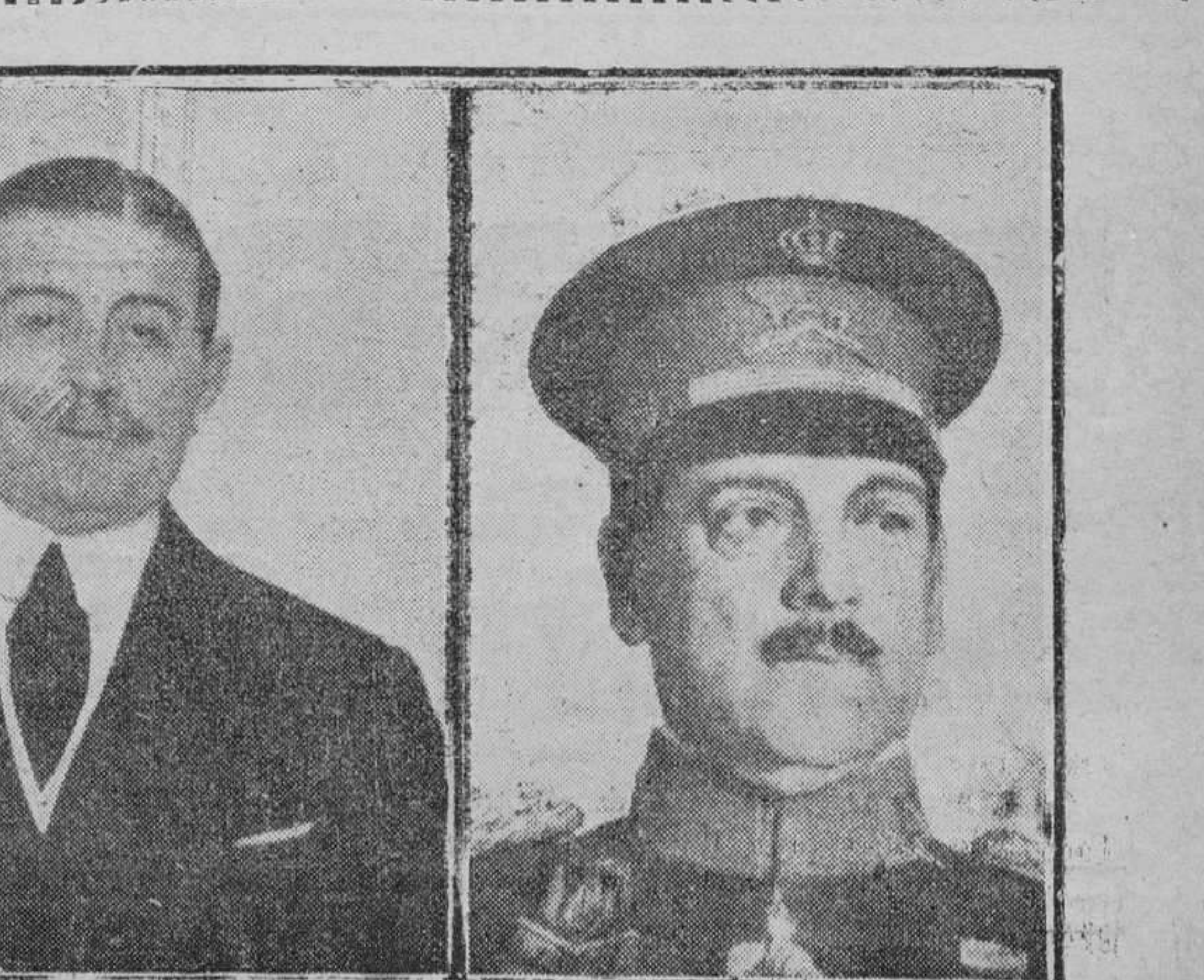
Presentes están los que actualmente rigen nuestros destinos en Africa: ministros de la Guerra y Estado, Sres. Aizpuru y Alba; alto comisario, Sr. Silveira, y comandante general de Melilla, general Martínez Anido, que mantiene en su zona la autoridad de su cargo, subalterno del alto comisario, frente a la del señor Silveira.

Es verdad que en los "círculos" teatrales se dice que si el Sr. Gayarre, perdón, si el se-