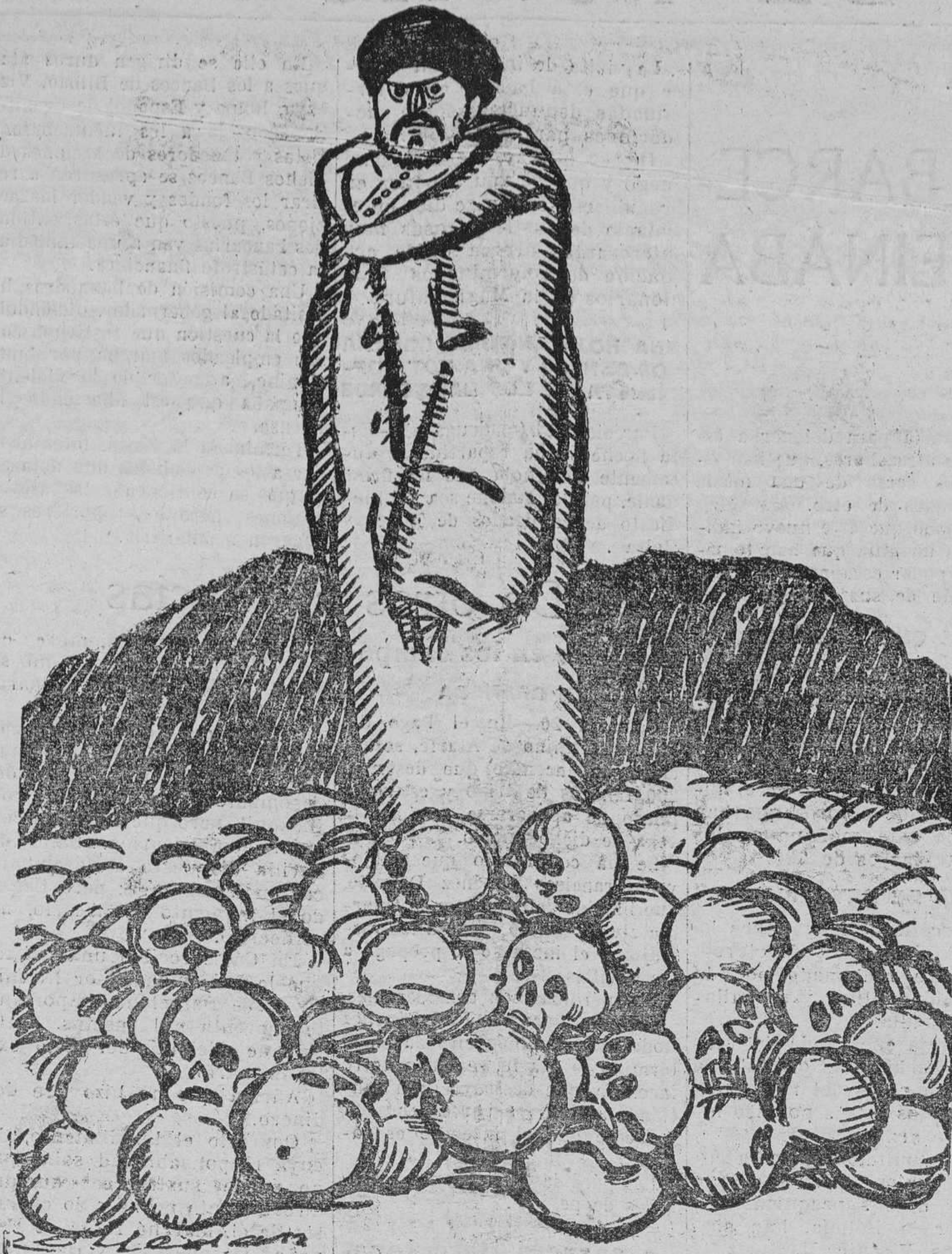
EL ESPECTRO Y LA REALIDAD ¡Ayer! ¡Hoy! ¡Mañana!