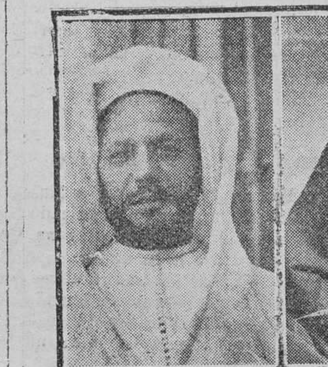
Abd-el-Krim, en el centro; a su izquierda, dos moros amigos, Dris-er-Riffi y Mu: áh Ben Raisuni; a su derecha, otros amigos, el Penuna y Dris-Ben-Said, muerto hace poco.

Estas modificaciones importantes, y formulada la protesta oportuna por la minoría socialista durante el curso del debate desarrollado ayer, fomentan la impresión de que el martes podrán suspenderse las sesiones.