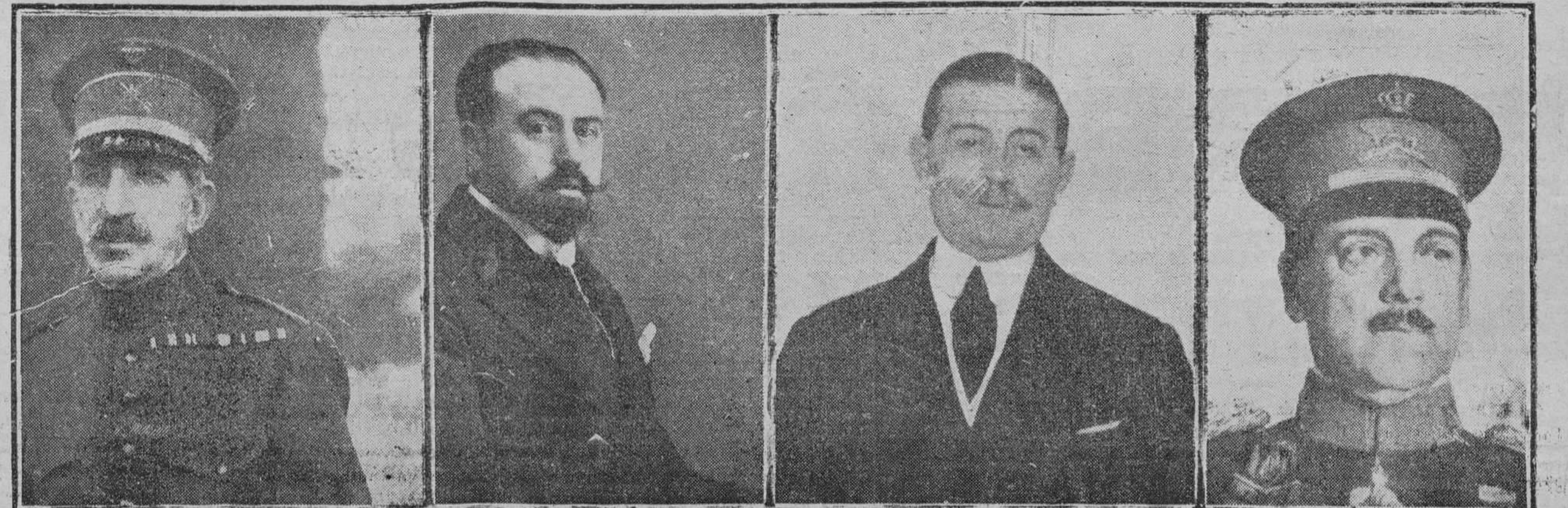
Presentes están los que actualmente rigen nuestros destinos en Africa: ministros de la Guerra y Estado, Sres. Aizpuru y Alba; alto comisario, Sr. Silveira, y comandante general de Melilla, general Martínez Anido, que mantiene en su zona la autoridad de su cargo, subalterno del alto comisario, frente a la del señor Silveira.

que una asociación de gentes que viven de él y debieran vivir para él lo maltratan, aplaudimos a la Directiva por su acuerdo discreto e invitamos a los actores obstruccionistas a que reflexionen un poco. Consideren que ese tuntún con que hacen uso del derecho a pedir la palabra y a discursar profusa y difusamente, es el verdadero peligro, la única cosa