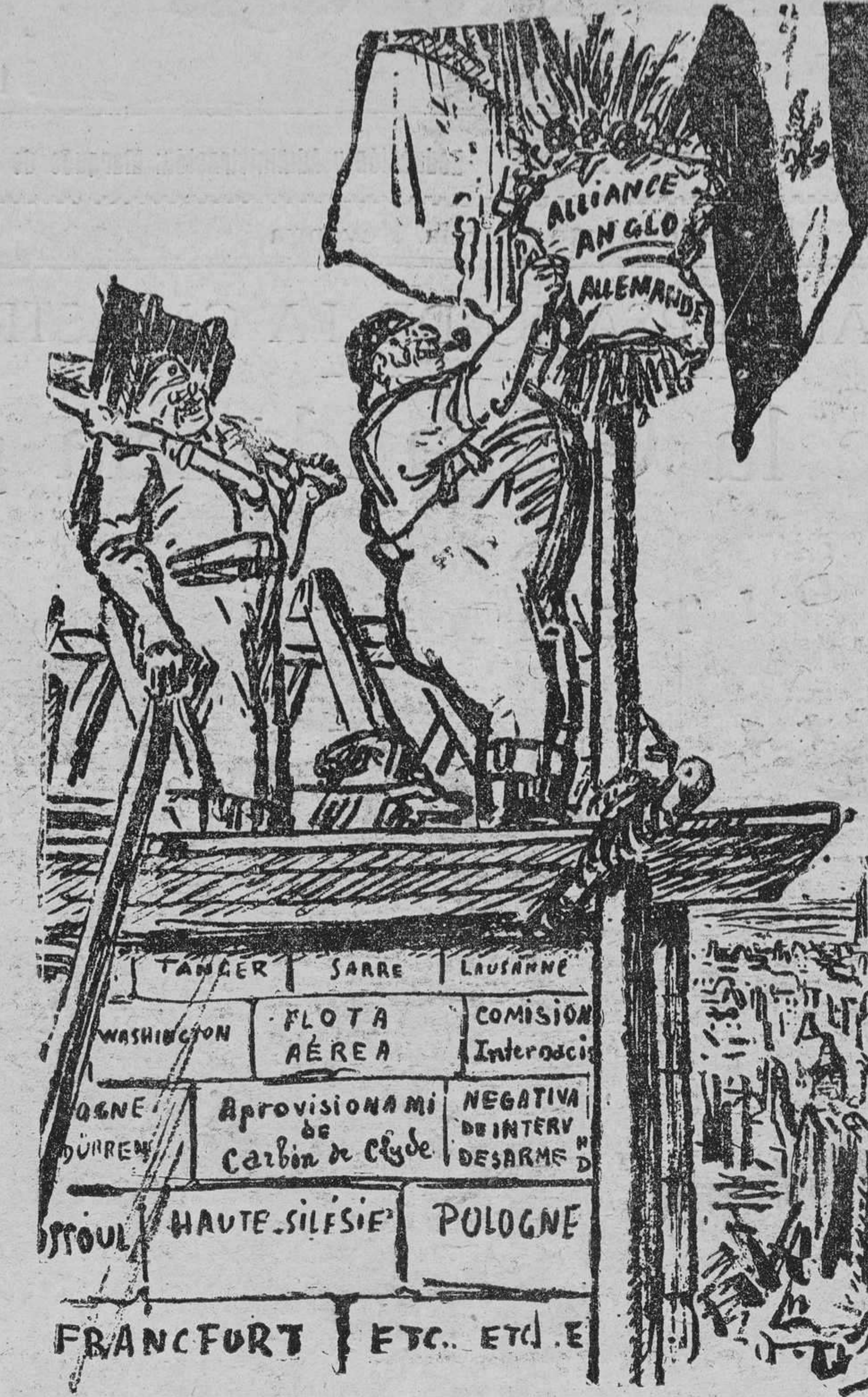
Trabajo y tiempo no costado, pero ya hemos puesto el ramo (Le Rire, de Paris.)

Bratiano. El periódico "Adevărul" escribe que la acogida de la Prensa francesa ha sido no solamente fría, sino maléfica.