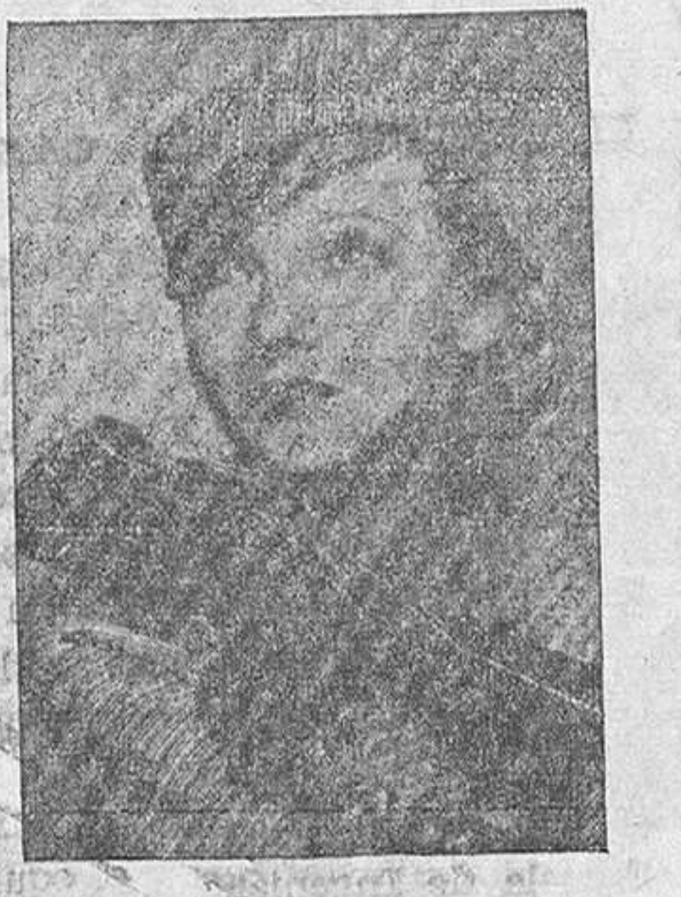
ASTRID ALLWYN que forma parte del nuevo elenco de la 20th. Century Fox

Benito Perojo es casado y tiene una hija de corta edad.