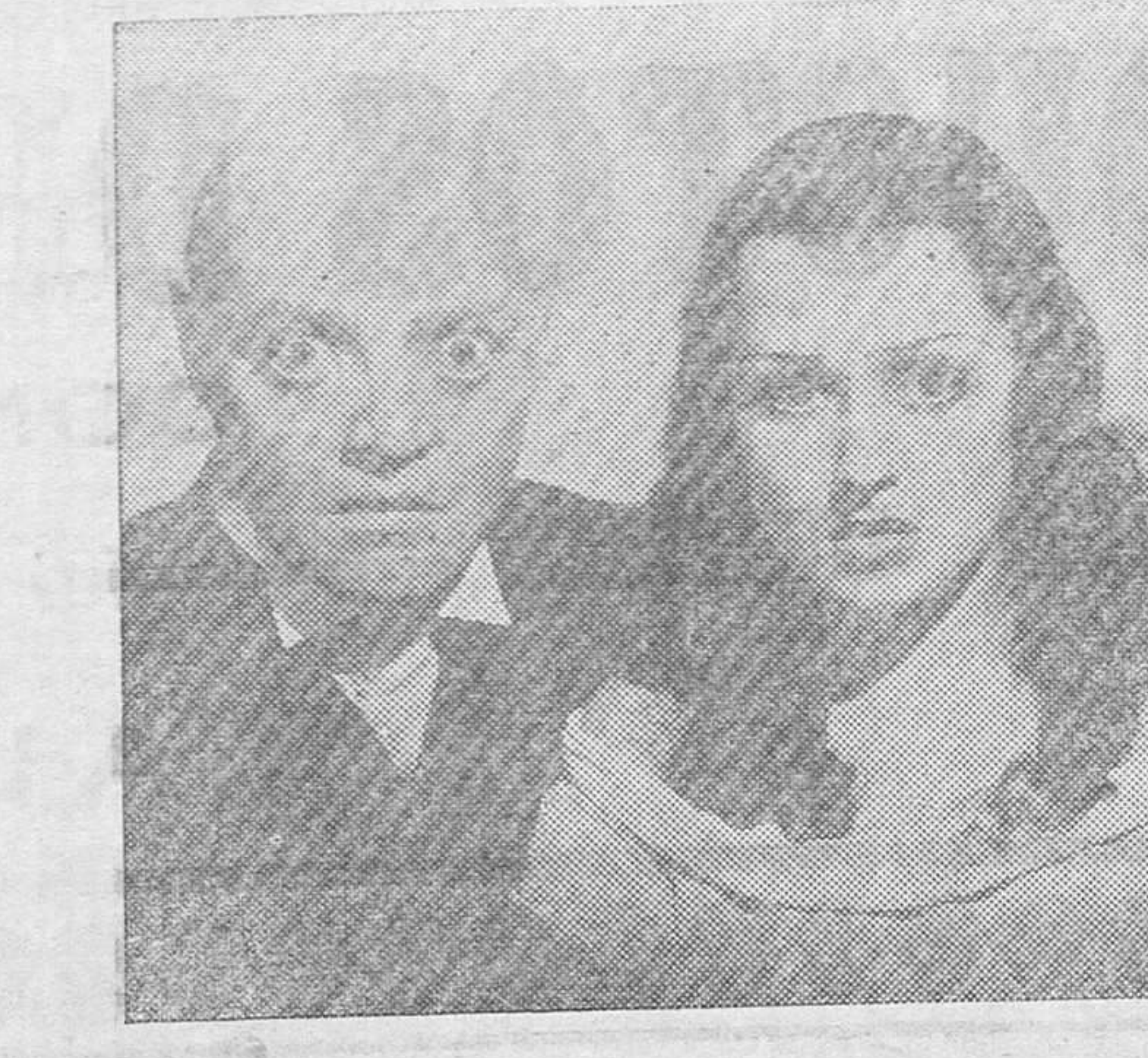
PETER LORRE y FRANCIS DRAKE en una escena de la superproducción M. G. M. «LAS MANOS DE ORLAC»