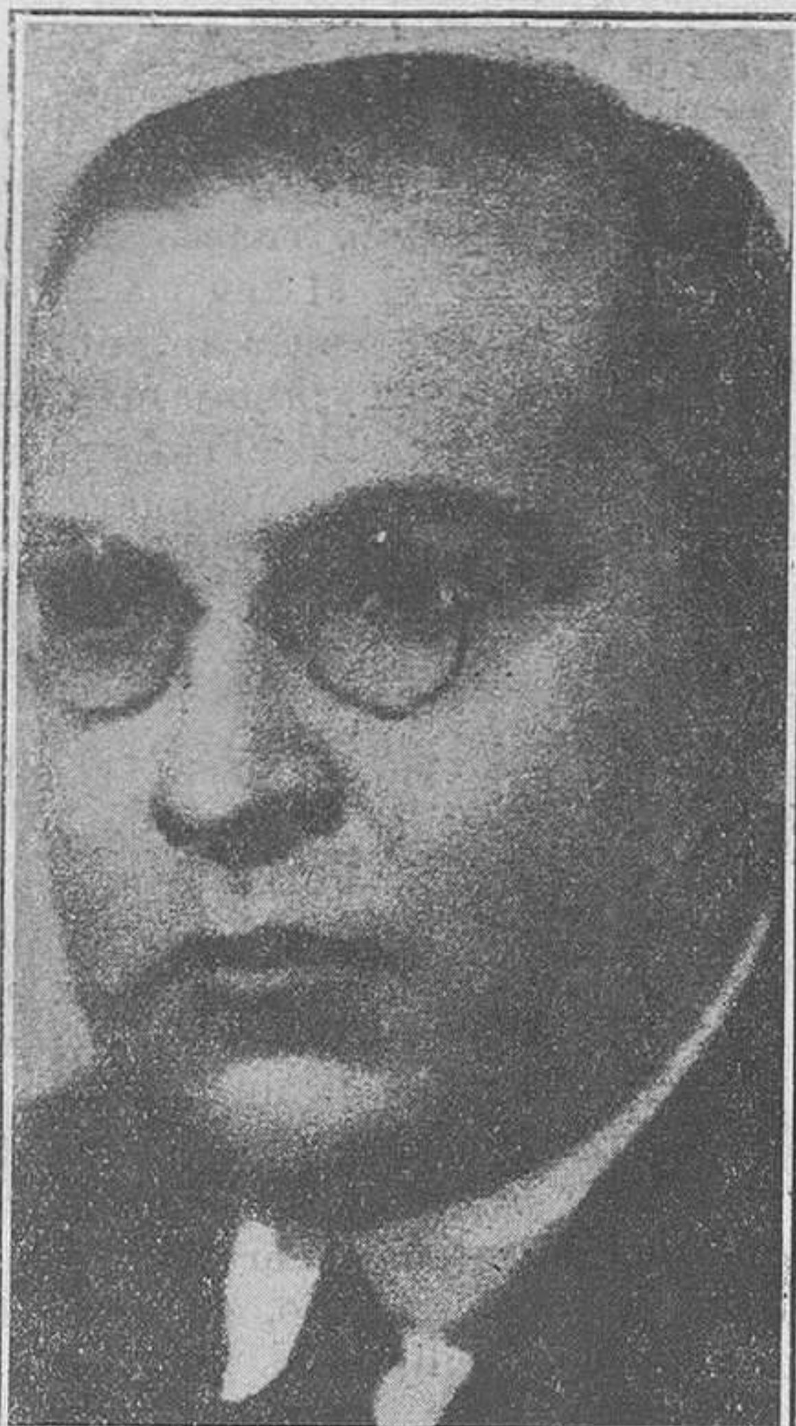
Don Genaro de Estrada, ilustre poeta mejicano.

En la diplomacia, como lo ha demostrado en su cargo de embajador,