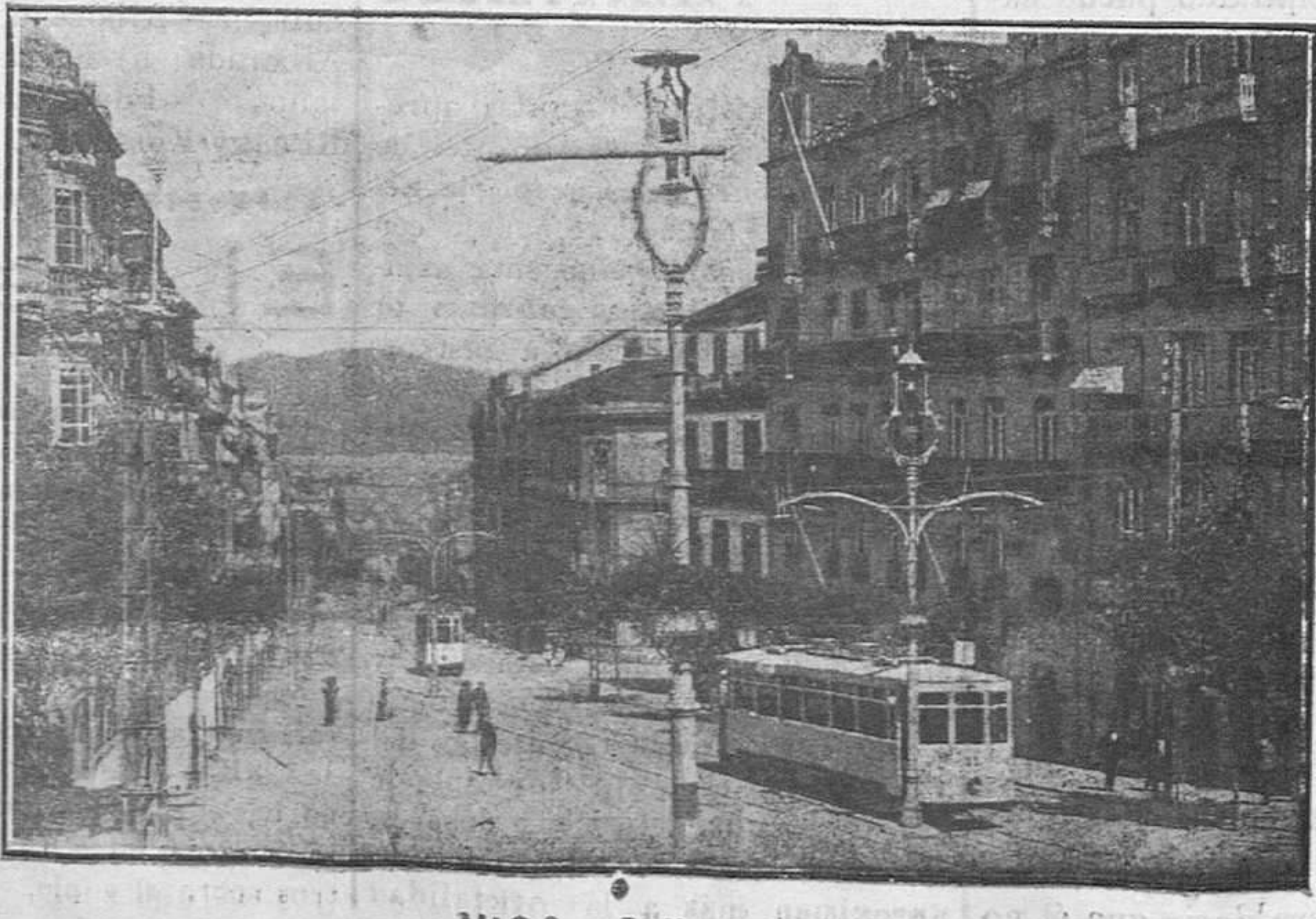
VIGO.—Calle de Colón.