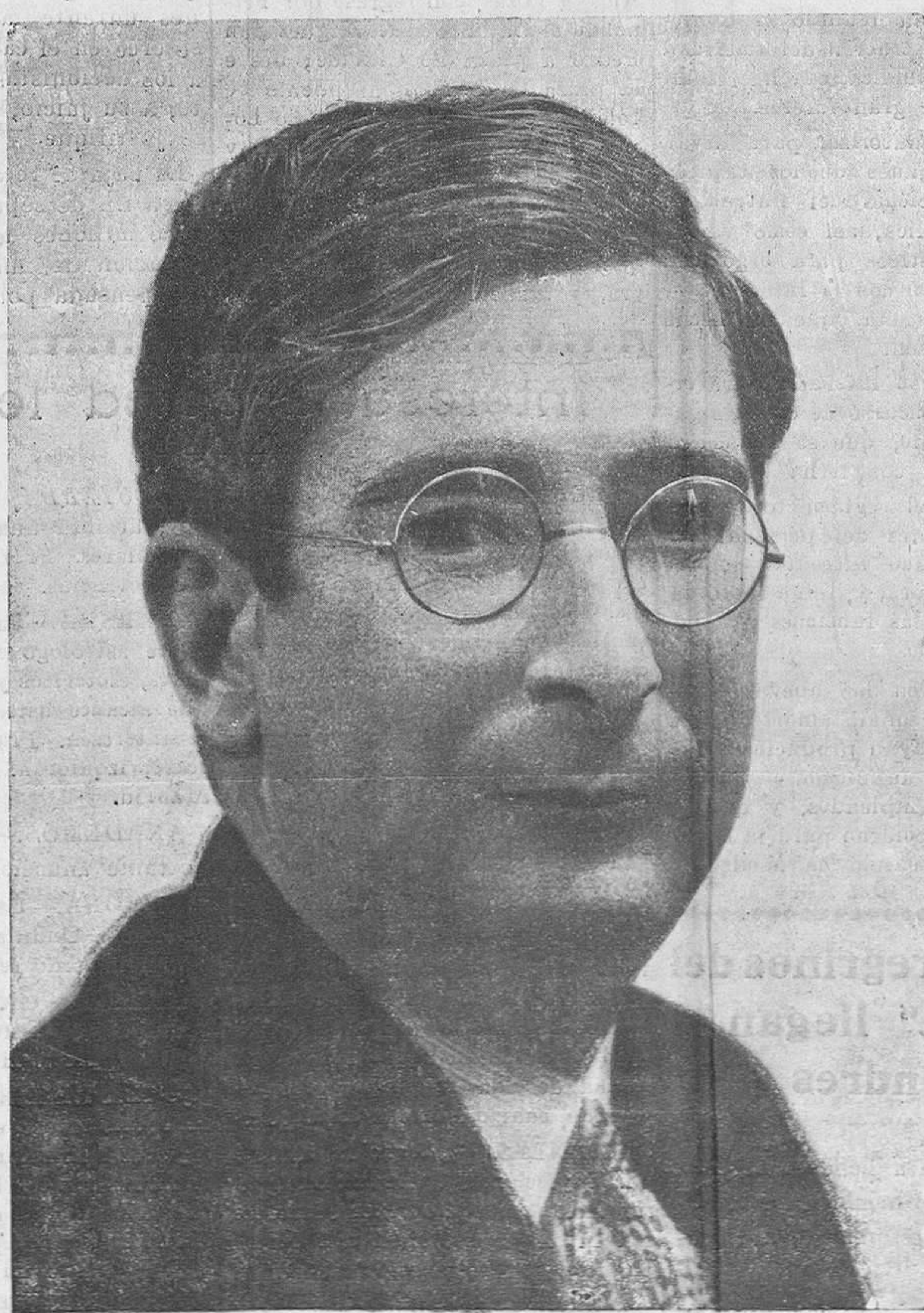
D. MARCELINO DOMÍNGUEZ, ministro de Agricultura de la República.

—¿...? —En efecto, he sido «incapacitado» por esos «señores» para asistir a las sesiones municipales y, por tanto, para ejercer un cargo para el que fui elegido legalmente, y lo más gracioso es que después de decir pestes del famoso Estatuto municipal, se fundan para incapacitarme en el artículo 252 del mismo, exhumado en 16 de junio del 31 y hecho ley en 15 de septiembre del mismo año.