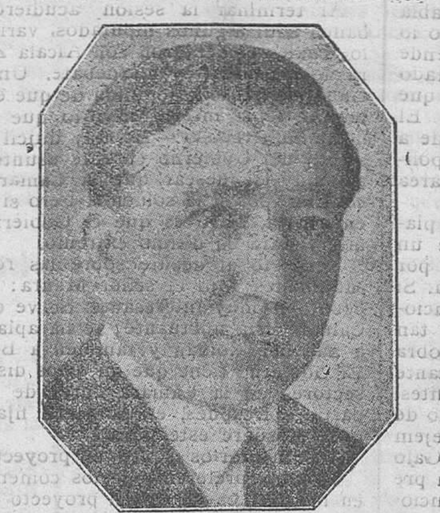
Don Julio Carabias, ilustre gobernador del Banco de España

que la monarquía dejó y no se hubiese metido, como Primo de Rivera y como el estueto Julio Wais en malandanzas eco-