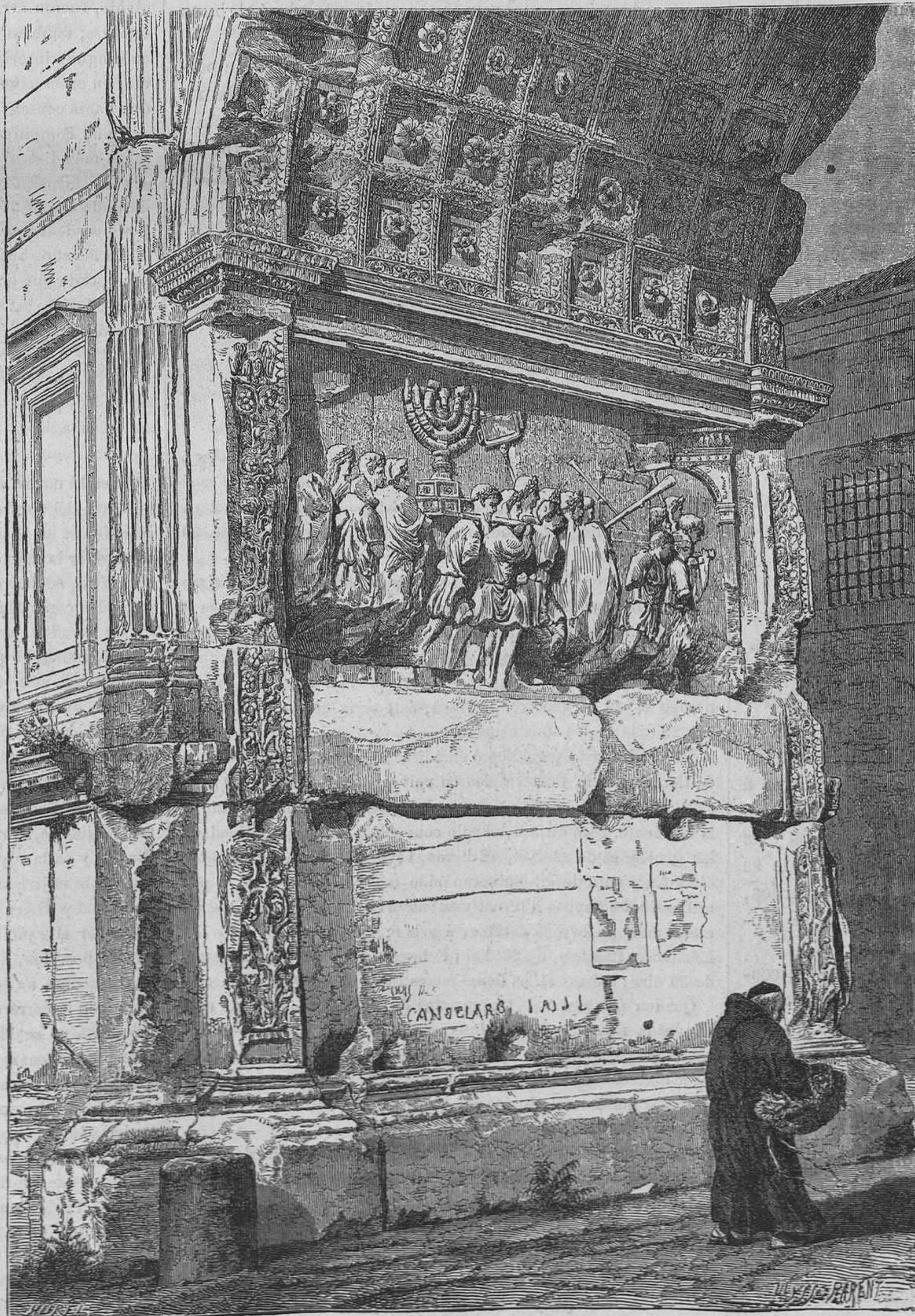
ROMA.—EL ARCO DE TITO.

Las esculturas todas son las más bellas entre las de todos los monumentos de la antigua Roma.