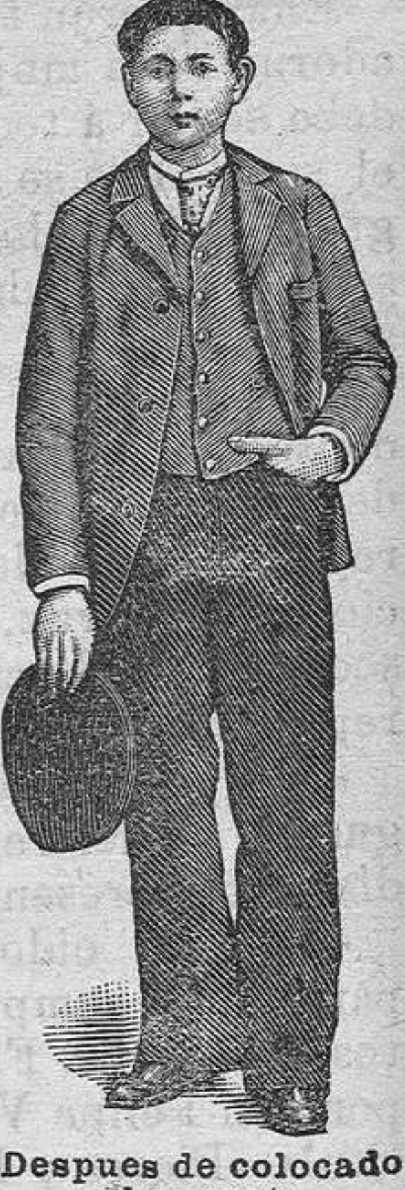
Después de colocado el aparato

Se hallará en Valladolid Hotel del Siglo los días 8, 9 y 10 y lleva consigo un especial surtido de aparatos para hernias (quebraduras) para por si mismo adaptar al paciente según sus necesidades respondiendo él de su seguridad.