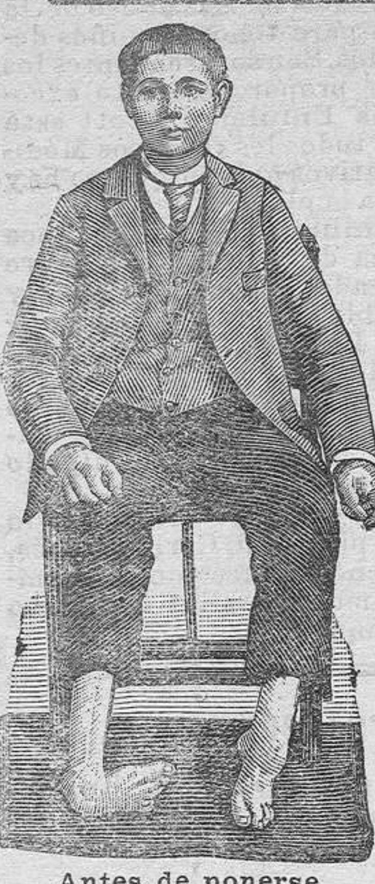
Antes de ponerse el aparato

Instrucciones muy útiles para las Hijas de María y demás jóvenes. Véndese en la librería de Polo; 2 pesetas pasta.