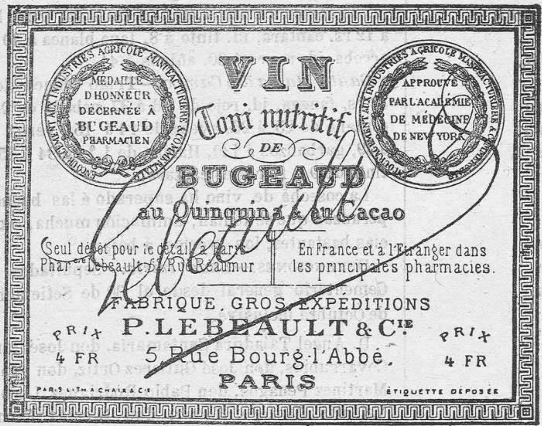
REPRODUCCIÓN DEL RÓTULO DEL VERDADERO VINO de BUGEAUD (impresión negra en fondo gamuza, firma encarnada).

P. LEBEAULT & C ia , 5, Rue Bourg-l'Abbé, PARIS