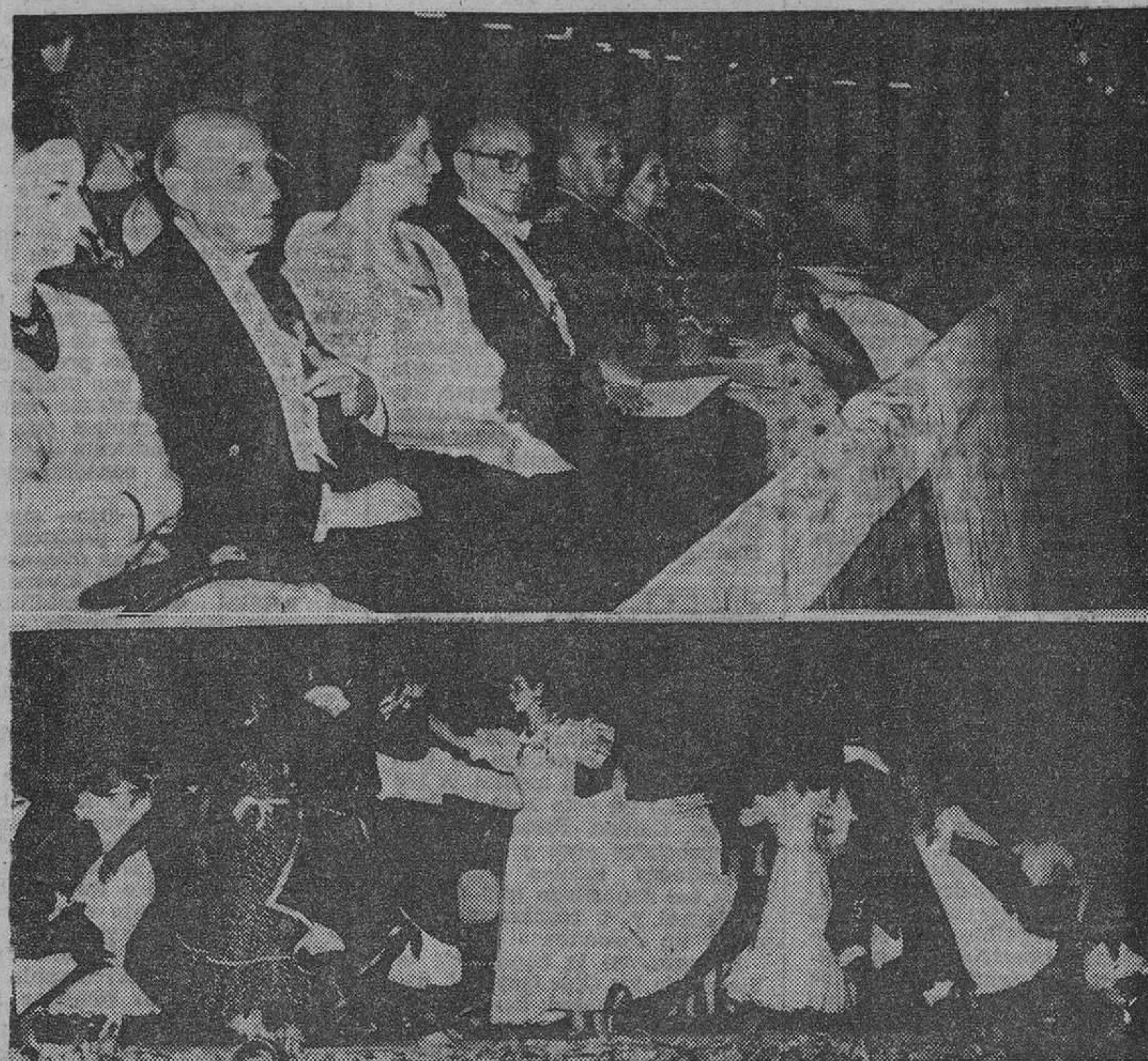
MADRID. — SU EXCELENCIA EL JEFE DEL ESTADO Y EL PRESIDENTE FRONIDZI, ACOMPAÑADOS DE SUS RESPECTIVAS ESPOSAS Y OTRAS PERSONALIDADES, DURANTE LA FIESTA QUE, DESPUES DE LA COMIDA OFRECIDA POR EL AYUNTAMIENTO, SE CELEBRA EN LOS JARDINES DEL RETIRO, Y EN EL TRANSCURSO DE LA CUAL UN GRUPO DE BAILE TIPICO ARGENTINO INTERPRETO EL PERIGON PORTENO EN HONOR DE LOS ILUSTRES VISITANTES.