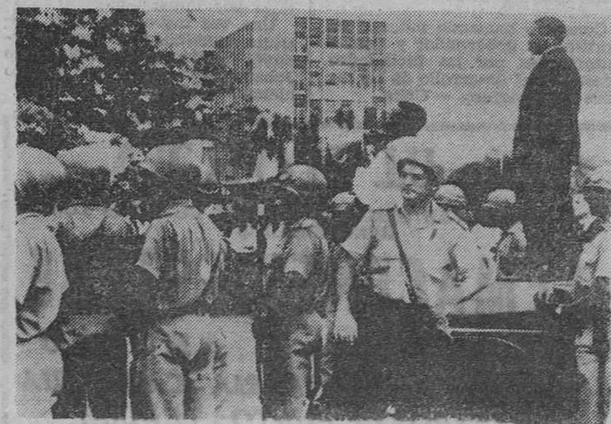
Leopoldville. — Fuerzas del Ejército, con cascos de guerra, en situación de alerta frente a un nutrido grupo de levantiscos congoleños, después de los recientes disturbios.

Roma, 10. — Ciento ochenta refugiados belgas procedentes del Congo han salido por vía aérea con dirección a Bruselas.