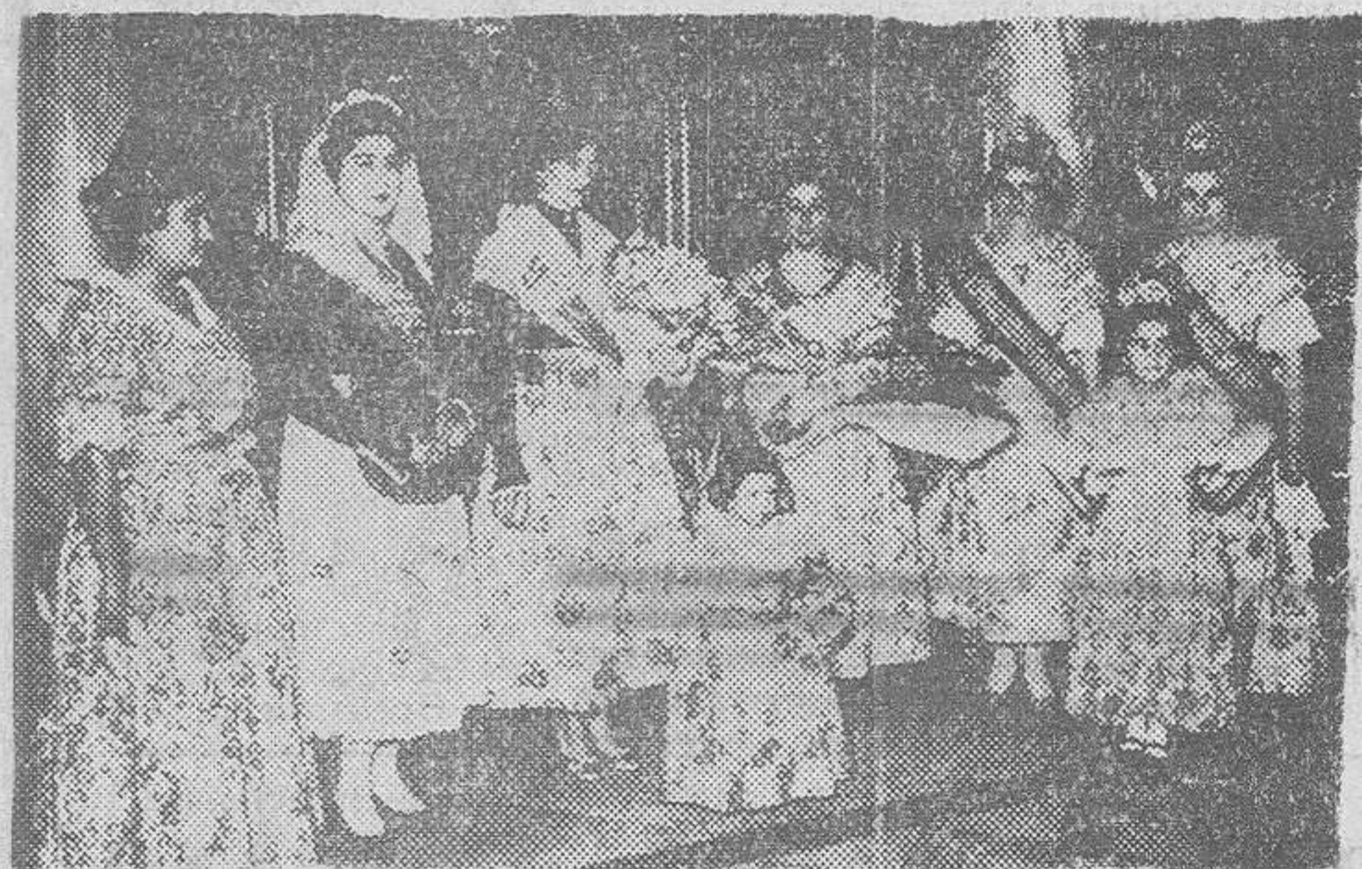
Valencia. — La fallera mayor de Valencia, con las señoritas falleras mayores de las casas de Valencia en Madrid, Barcelona, Alicante y Castellón, durante el recibimiento que les fué tributado por el alcalde y la Junta Central Fallera en el Ayuntamiento

Solemne ofrenda de flores a la Virgen de los Desamparados