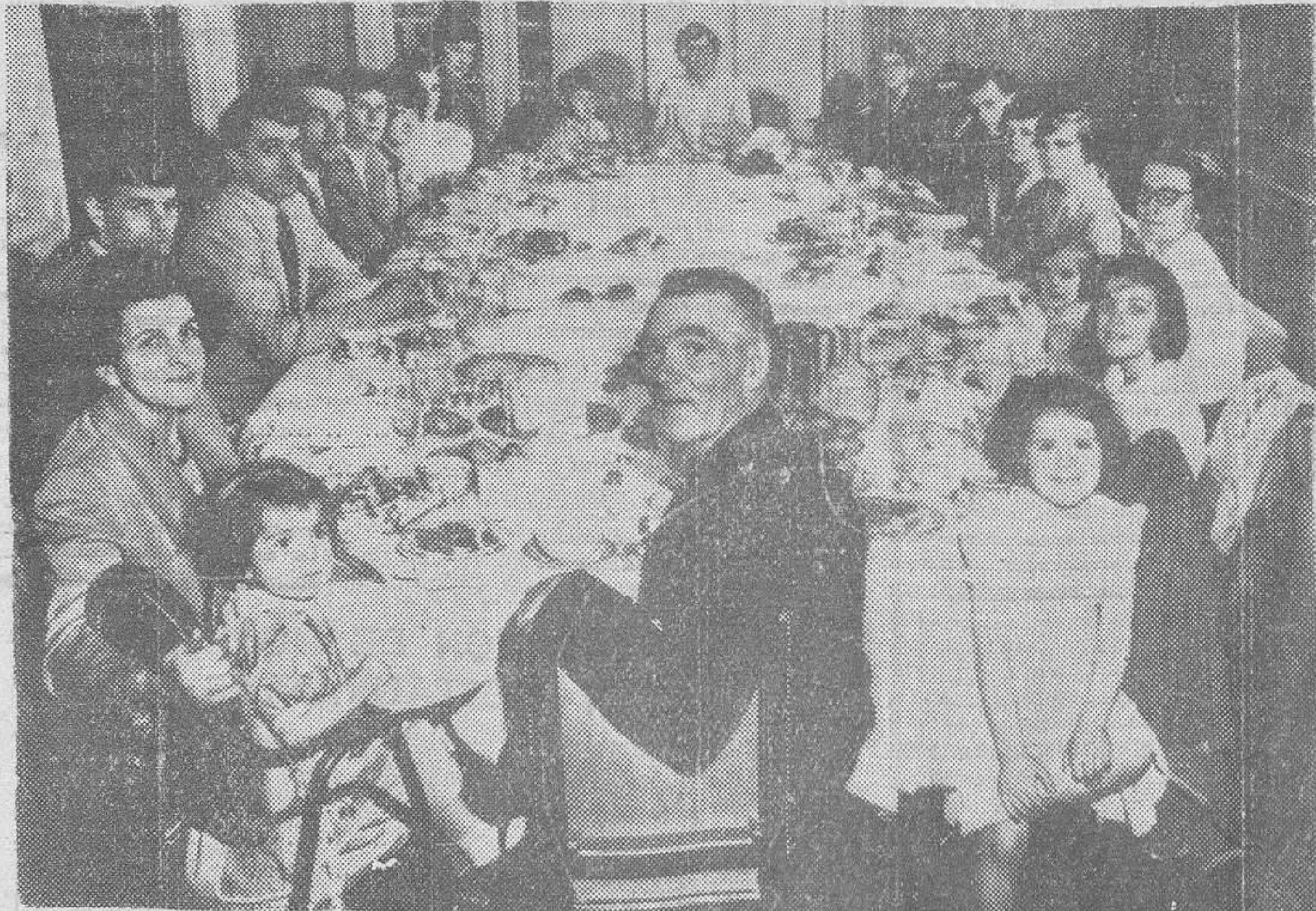
Nueva York. — He aquí la familia más numerosa de Norteamérica compuesta por el matrimonio, trece hijas y siete hijos, fotografiados a la hora de comer en el hotel de esta ciudad donde se hospedan con motivo de su asistencia a la Feria Internacional de Juguetería. Ha sido la primera vez que ha viajado toda la familia junta y el coste del viaje ha sido sufragado por un adinerado fabricante de juguetes. La madre tiene 48 años y el padre, de 55, cultiva 30 acres de terreno propio.