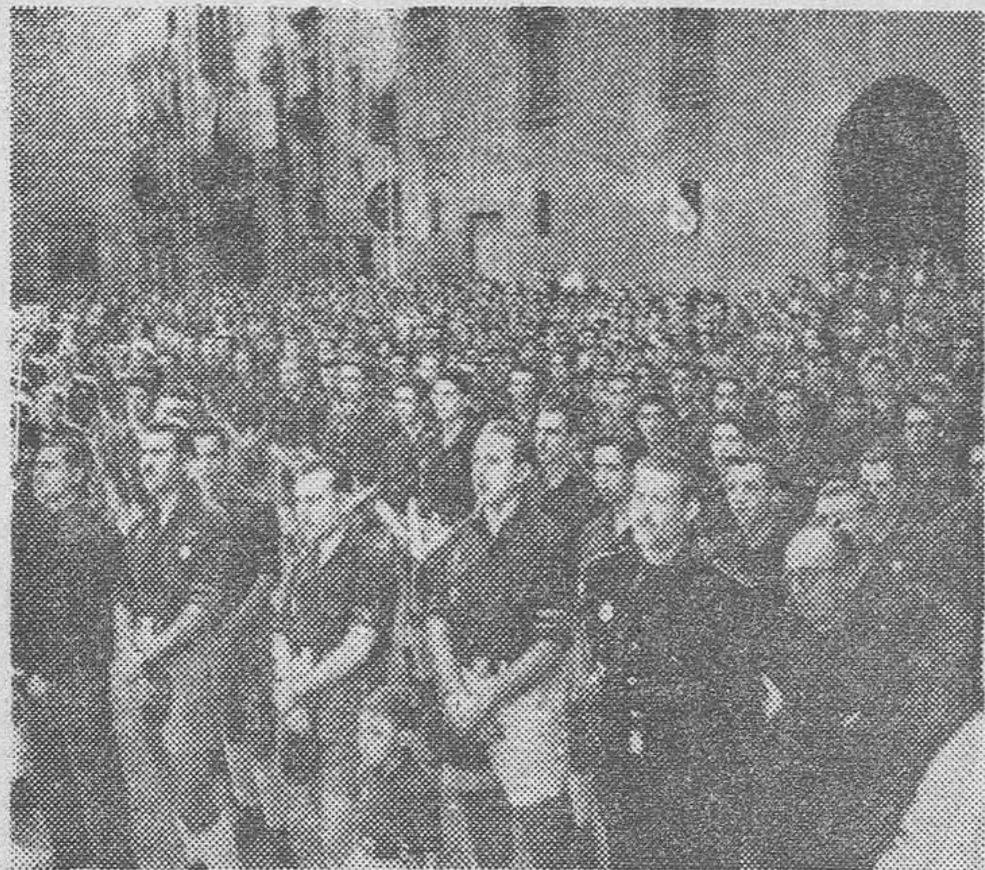
Aspecto de la plaza del Rey durante la concentración del Frente de Juventudes, celebrada ayer, con motivo del «Día de la Fe».

Presidió el acto el Secretario nacional, y durante el día tuvo efecto la cuestación anual de la Organización Juvenil