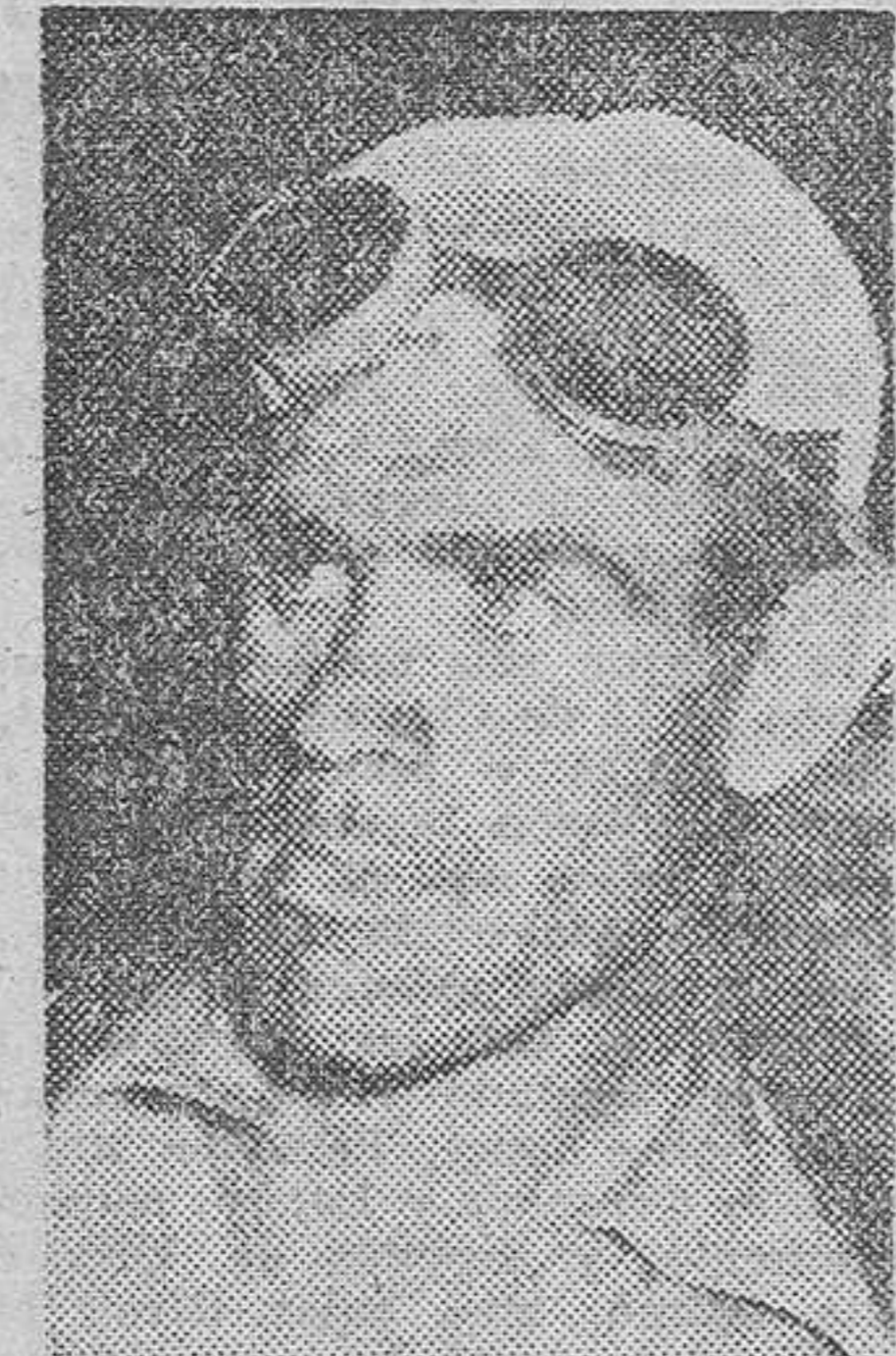
el magnífico corredor, capitán del equipo de España, que se clasificó tercero en la Vuelta Ciclista a Francia.