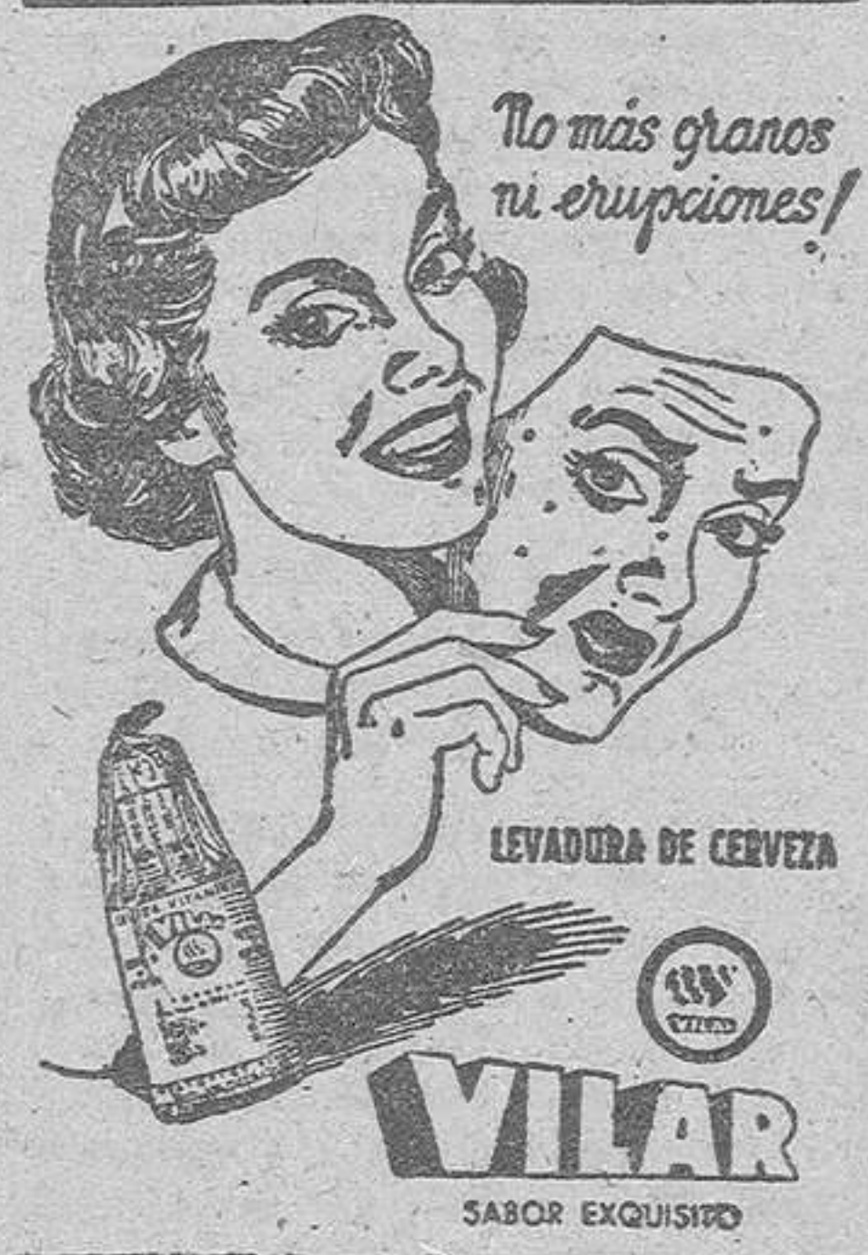
LABORATORIOS VILAR S. A. - Distribuidores VILAR, PARANANDA - BARCELONA