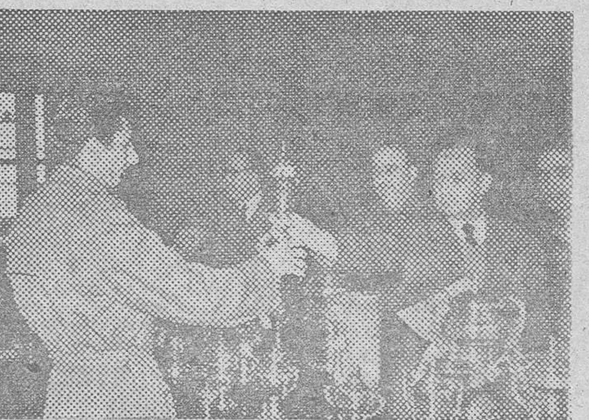
El momento de entregar al representante del C. N. Atlético la copa dedicada al club de mayor número de clasificados de la XXIV Travesía a nado del Puerto de Barcelona