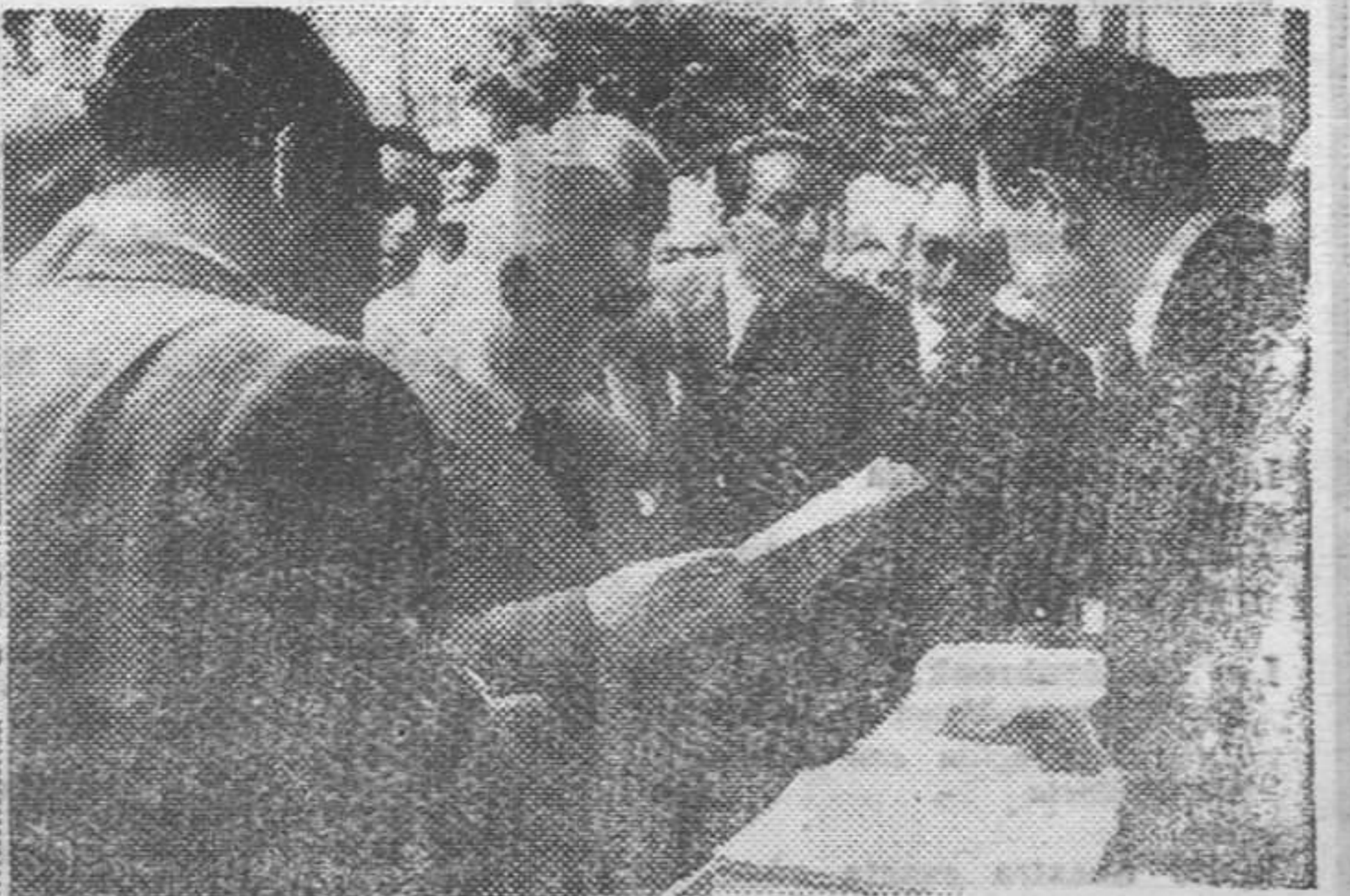
El Ministro de Industria y Comercio, con las demás autoridades y jerarquías, visitan la FERIA Nacional del Libro, deteniéndose especialmente en los pabellones de los M...