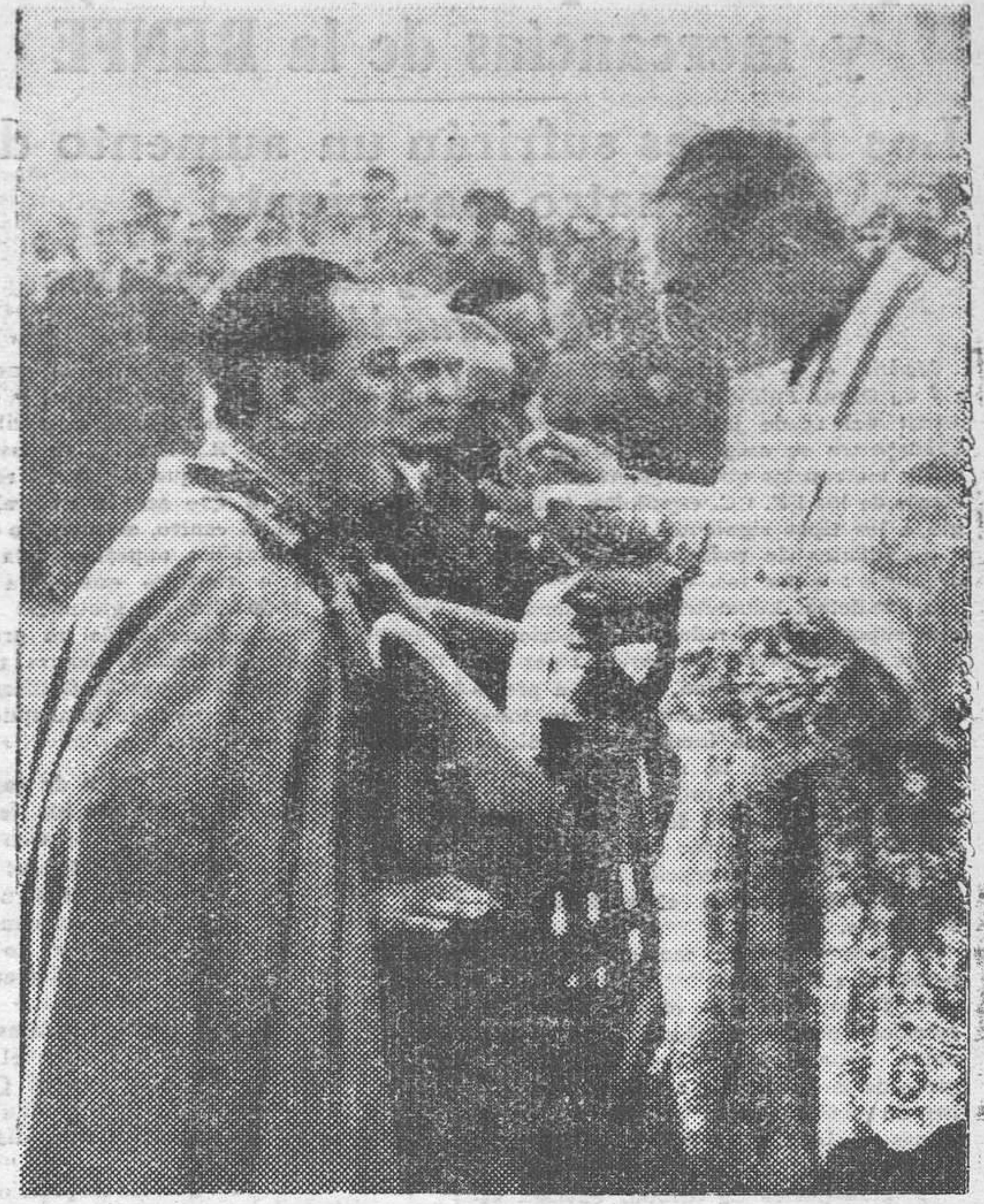
El Presidente Perón comulga durante el solemne acto de entrega de los sables a los nuevos Generales del Ejército argentino, en la avenida del 9 de julio.