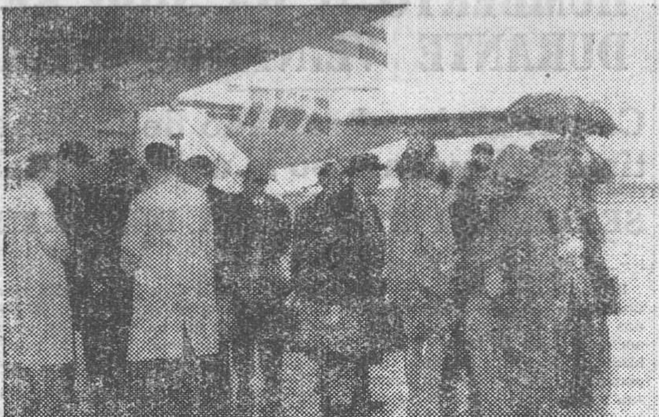
Llegada al aeródromo de Barajas de los delegados americanos que asistirán al Congreso Internacional de Pax Romana, que se celebrará en España próximamente