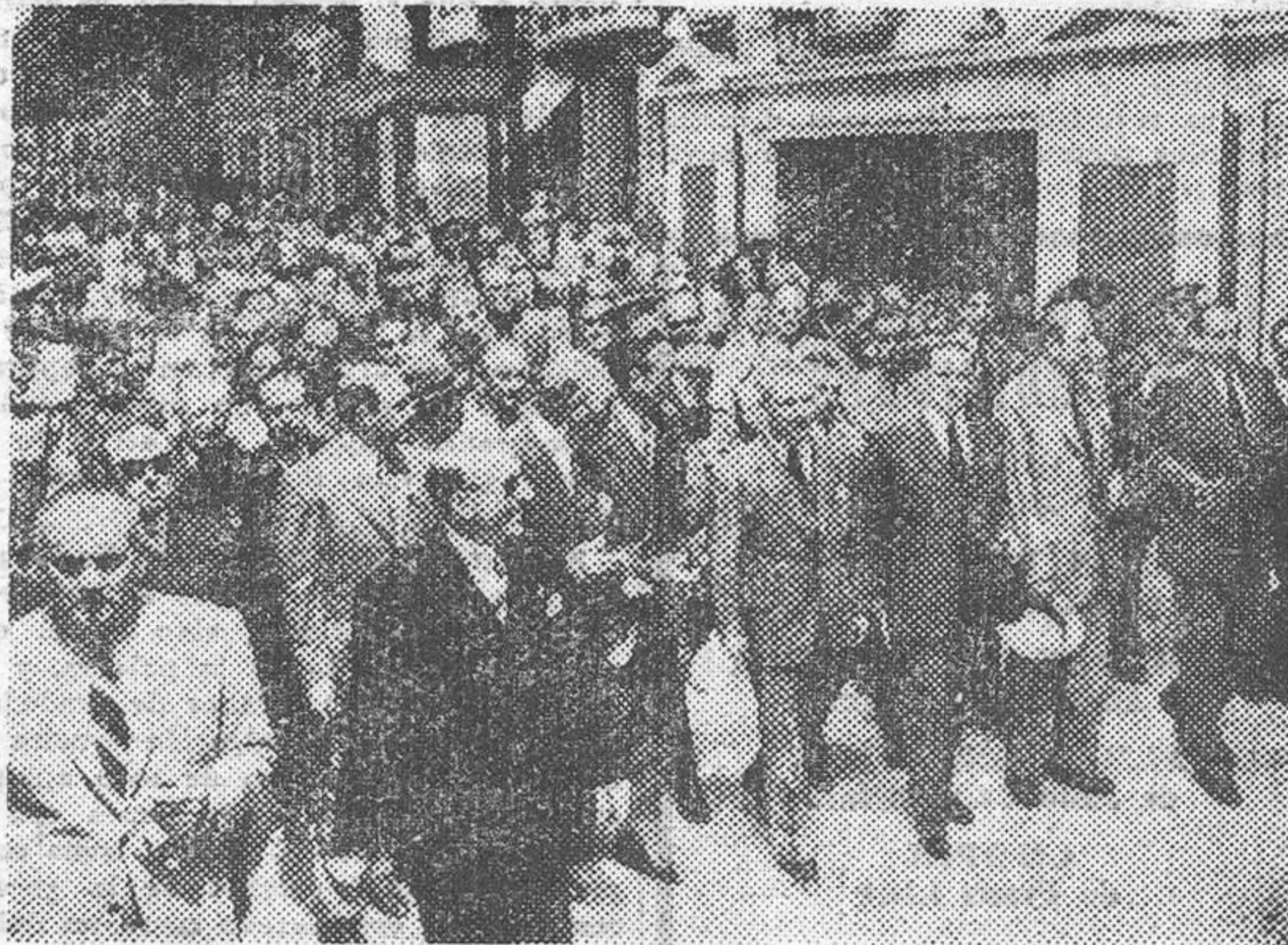
Las personalidades asistentes al acto inaugural, durante su visita a la FERIA

El Ministro y demás autoridades visitaron el Pabellón de la Subsecretaría de Educación Popular, y se detuvieron también en los de los Ministerios de Industria y Comercio, y del Aire, y en el de Correos y Telégrafos, como también, entre otras muchas casetas, en las de la Dirección General de Relaciones Culturales del Ministerio de Asuntos Exteriores, Editorial Naval, Instituto de Cultura Hispánica, Consejo Superior de Investigaciones Científicas, Ministerio de Trabajo, Ayuntamiento de Barcelona, Edi-