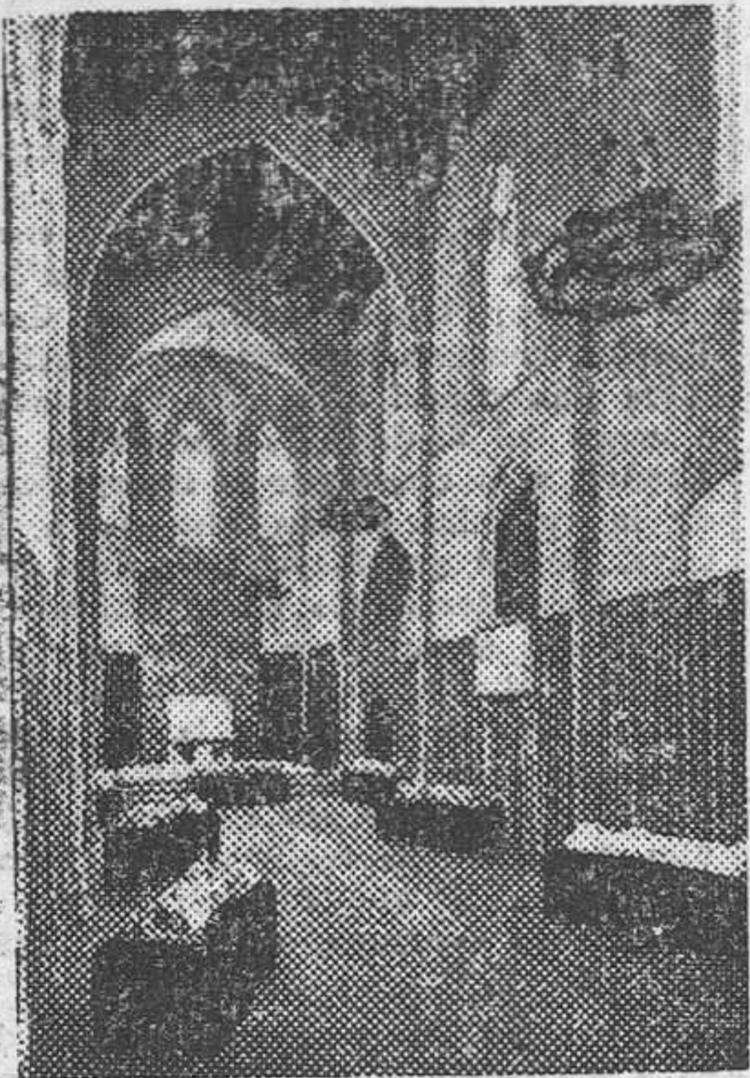
Aspecto general de la Exposición de las estatuas de Poblet, en la Real Capilla de Santa Agueda