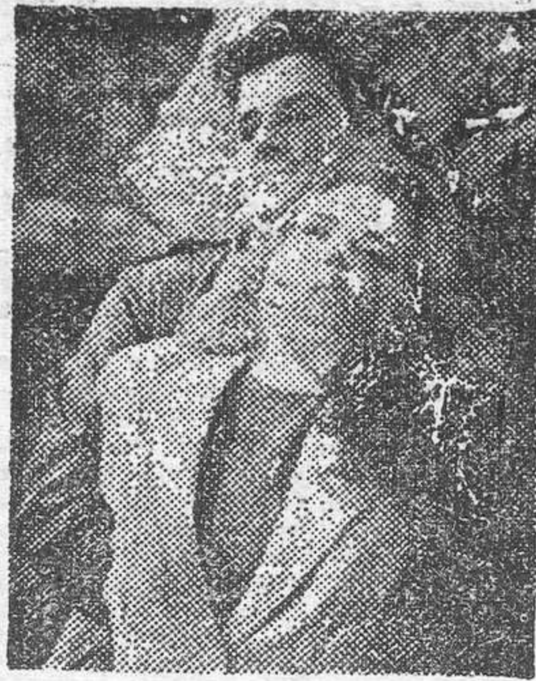
Priscilla Lane y Robert Cummings, en una dramática escena de Sabotaje.