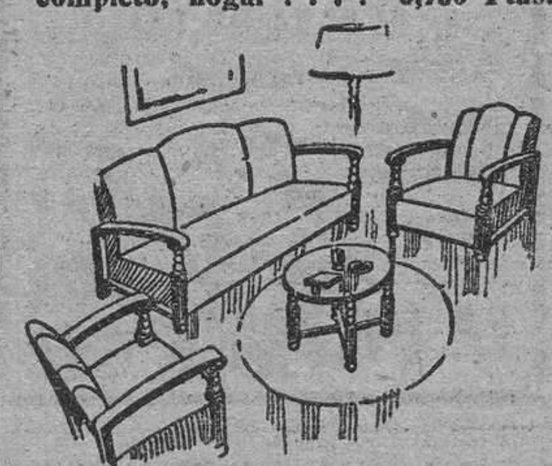
Tresillo tapizado, con mesa . . . . . 1,150 Ptas.

Invierta bien su dinero comprando directamente en LA FABRICA, y si su presupuesto no llega a lo que desea, nuestra organización comercial le allanará las dificultades.