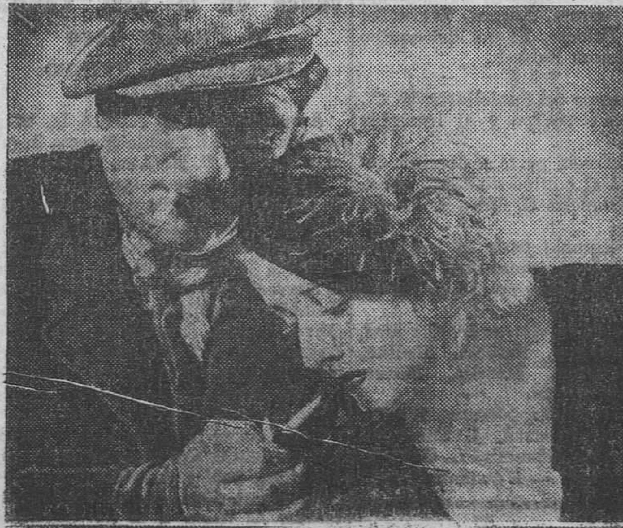
Victor Mac Laglen y Margot Grahame protagonistas del vigoroso film premiado por la Biennale de Venecia EL DELATOR