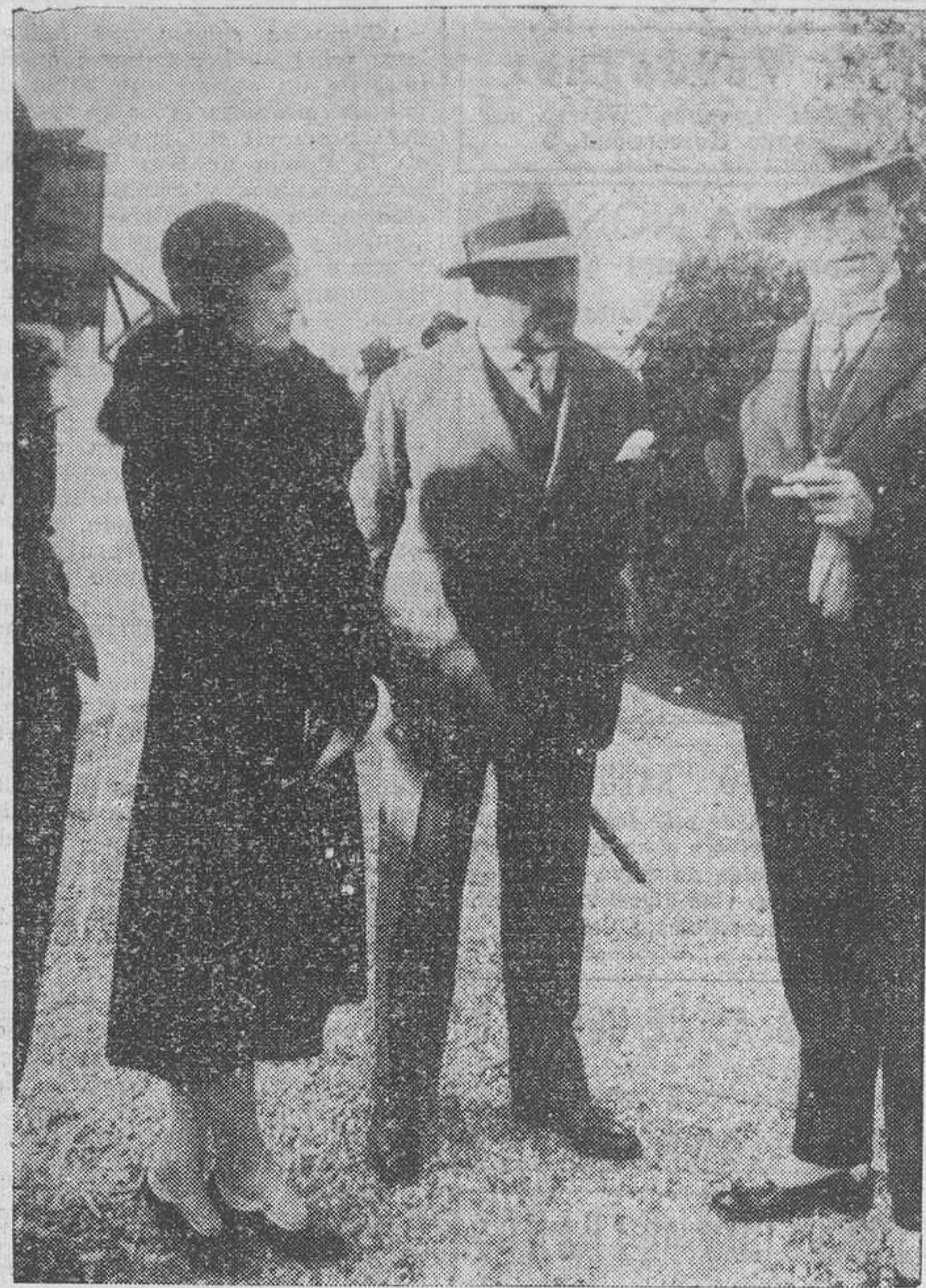
El ex ministro don Santiago Alba, actualmente huésped de Barcelona, presenciando, ayer, las carreras de caballos.

Leo que, en estos momentos, Amics de l'Art vell se preocupan por la conservación del trozo de muralla romana de Tarragona, llamada Médol, y de las iglesias románicas de Alcover y Coll de Nargó, del mosaico romano de Tossa, del castillo de Torroella