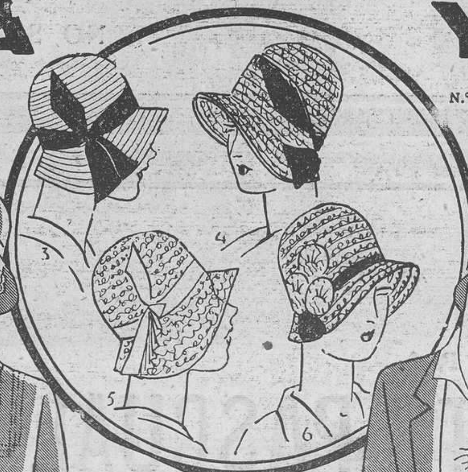
N.º 5. — Sombrero de paja encaje, bonito cocardé gros-grain. Ptas. 16