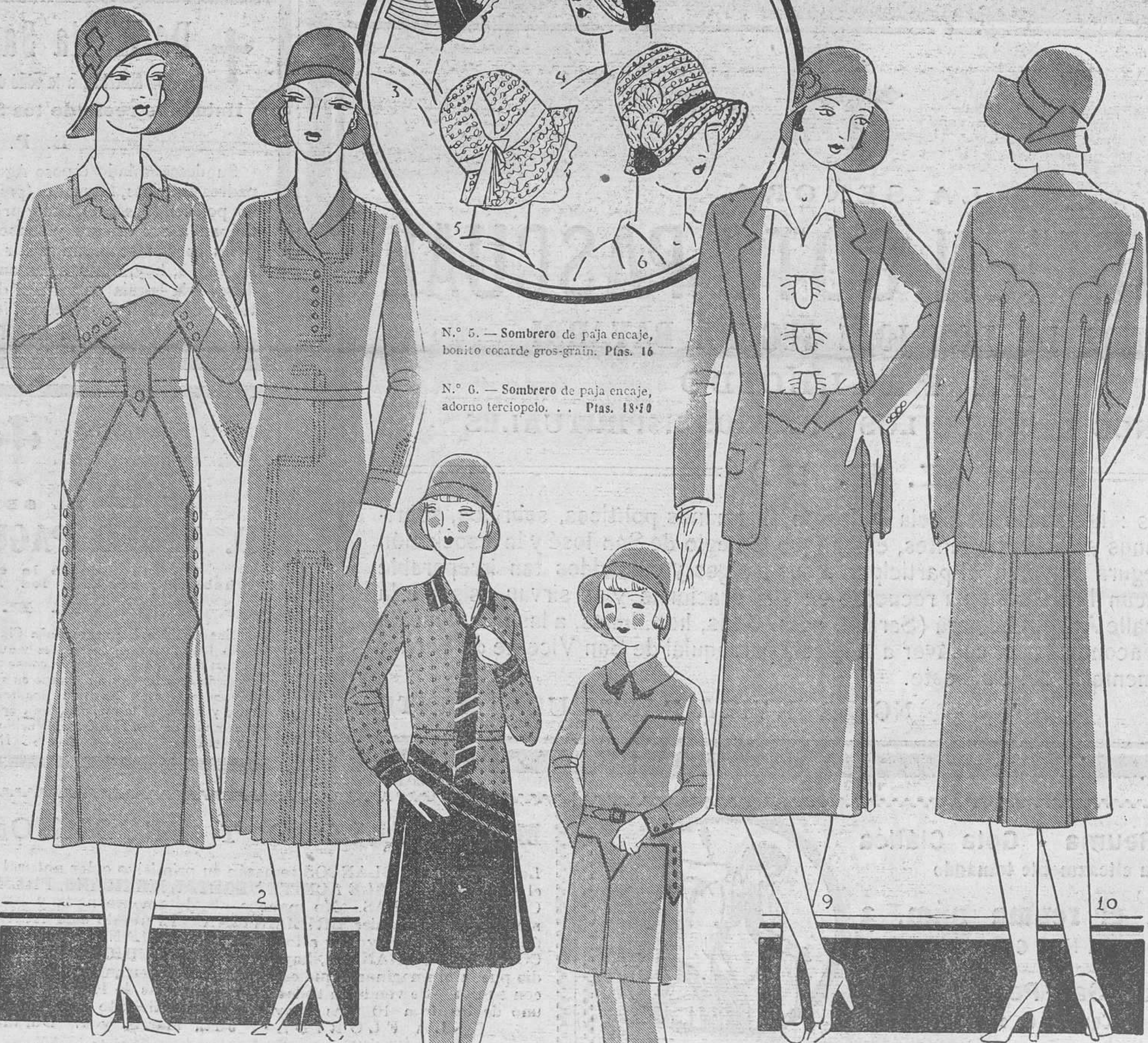
N.º 1. — Vestido de crepón de seda artificial, adornado con cuello de crepón y botones de metal, bonito modelo: Tallas 42, 44 y 46. . . Ptas. 48 Tallas 48 y 50. . . . Ptas. 52