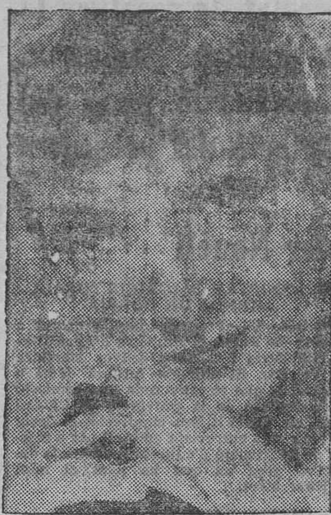
CLAUDETTE COLBERT protagonista del film Paramount El Lirio dorado, que aquesta nit se estrena al Coliseum

Un film impregnat del bell romanticisme de la música hongaresa, maistralment interpretada per L'ORQUESTRA RODE