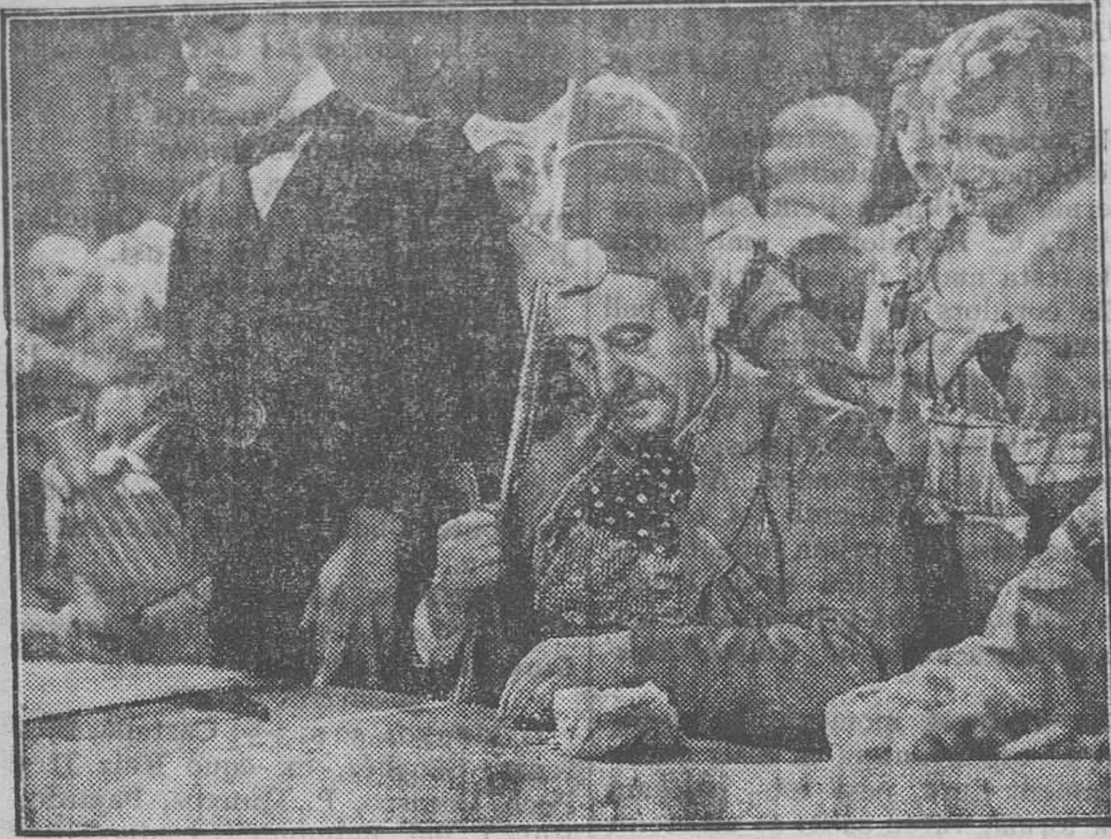
Raimu, en una escena de «Tartarin de Tarascón» film «Cinaes»