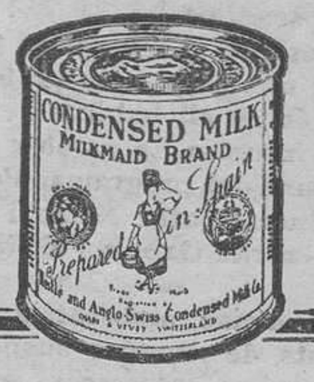
Demani avui mateix a Sociedad Nestlé, (Secció LA 21) Via Laietana, 41, Barcelona, un exemplar del magnífic folletó il·lustrat "Recetas La Lechera".

Ara també s'expenen en el comerç "botes degustació" "LA LECHERA" molt a propòsit per a una esplèndida dosi.