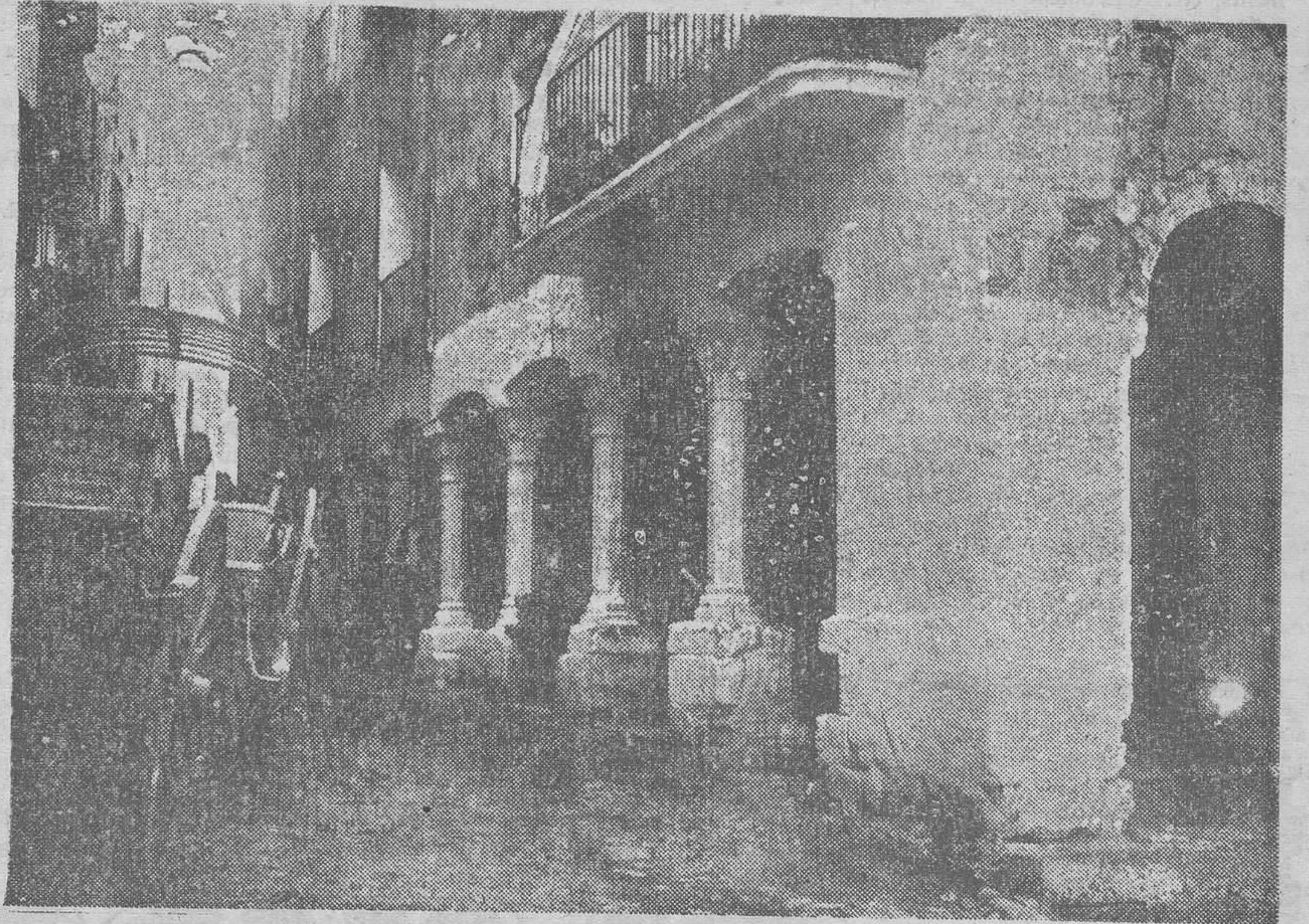
CATALUNYA PINTORESCA. — Típic carrer de Besalú (Girona)

Confio que l'afluència turística registrada a Catalunya durant l'any 1933, que ha superat la dels anys an-