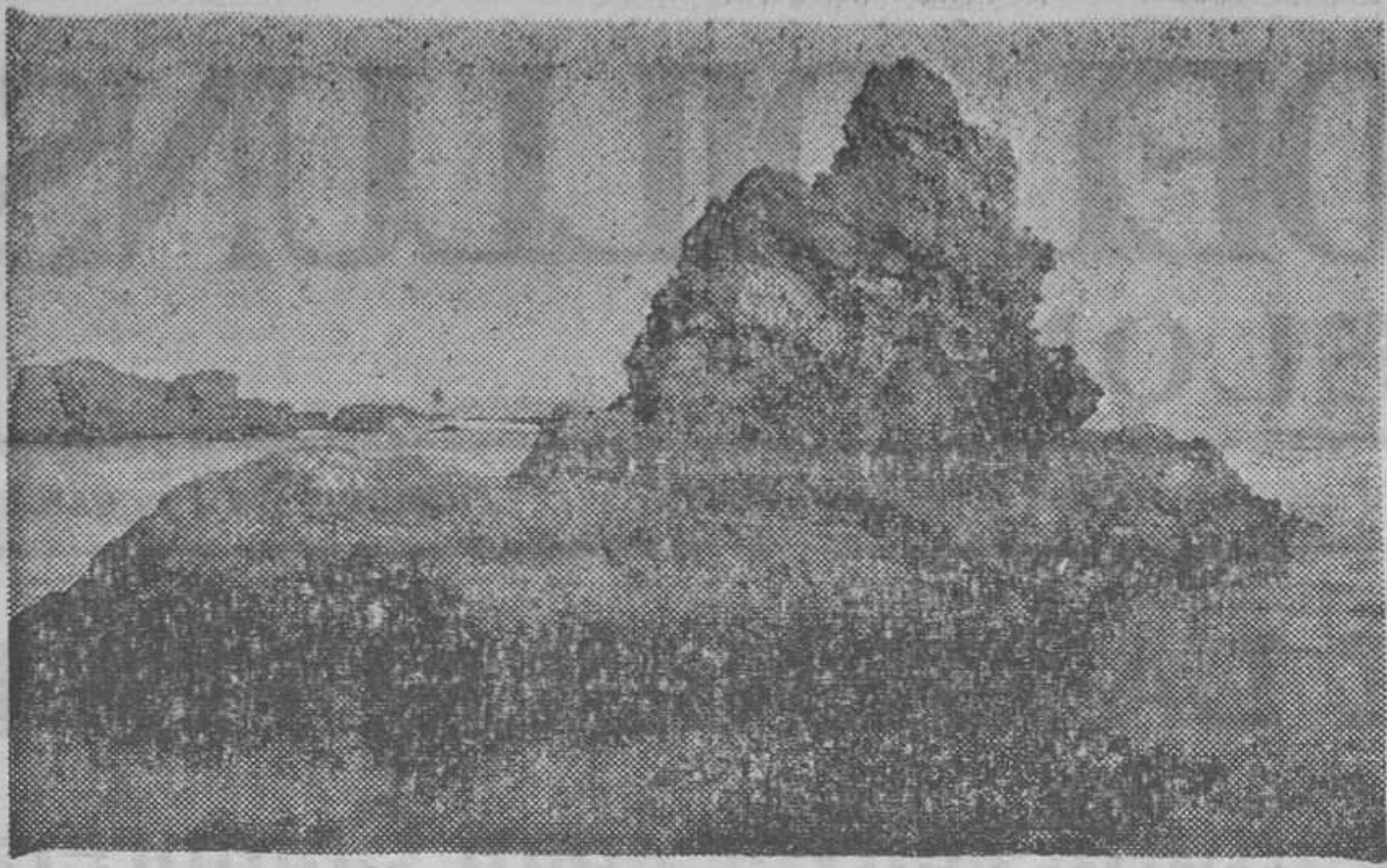
CATALUNYA PINTORESCA. — Costa Brava, Illot de la Farella, a Llançà

itineraris, indrets turístics, monuments, etc. Actualment tenim inscrits a les nostres oficines cent seixanta guies-intèrprets, entre els que presten servei en hotels i agències de viatges i els que treballen pel seu compte. Jo espero que aquests exàmens serviran per evidenciar la preparació que durant aquests darrers temps han anat adquirint aquests obrers, per a exercir llur missió amb el turista.