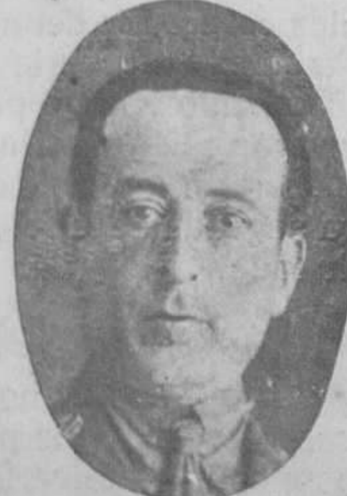
Capitán (E. R.) de Infantería