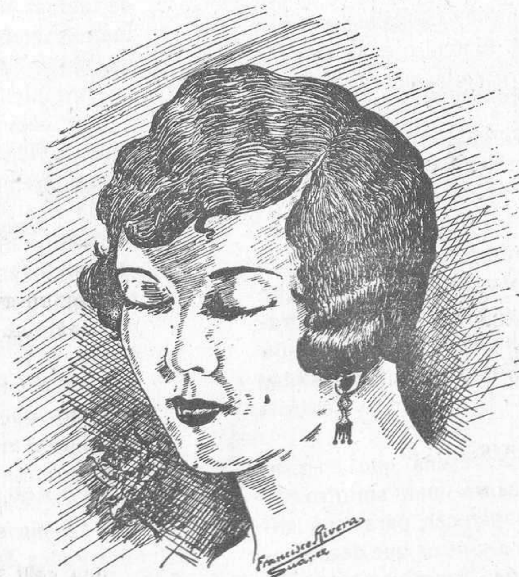
Linda flor de Menorca.