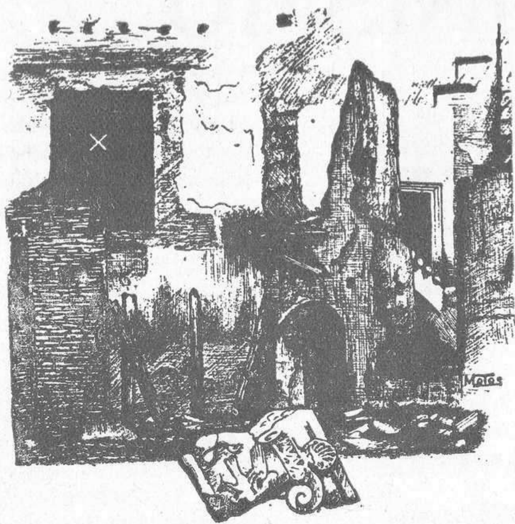
Del Castillo de Vélez-Blanco. Patio del mismo, x Cuesta que daba acceso al salón del Triunfo. Estado actual.