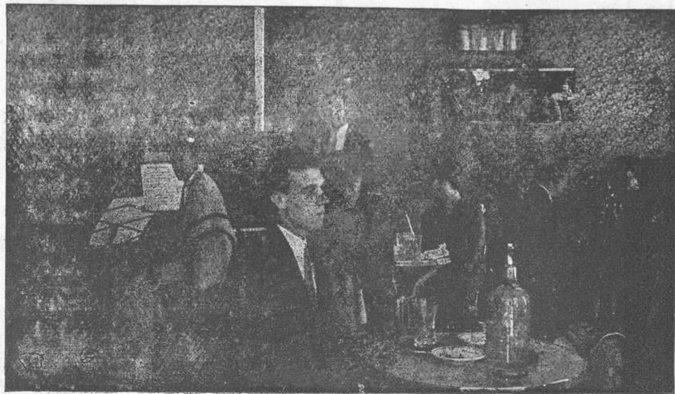
Pintor Calbo y Carlos III.--MAHON

El más elegante y preferido por el público de buen gusto