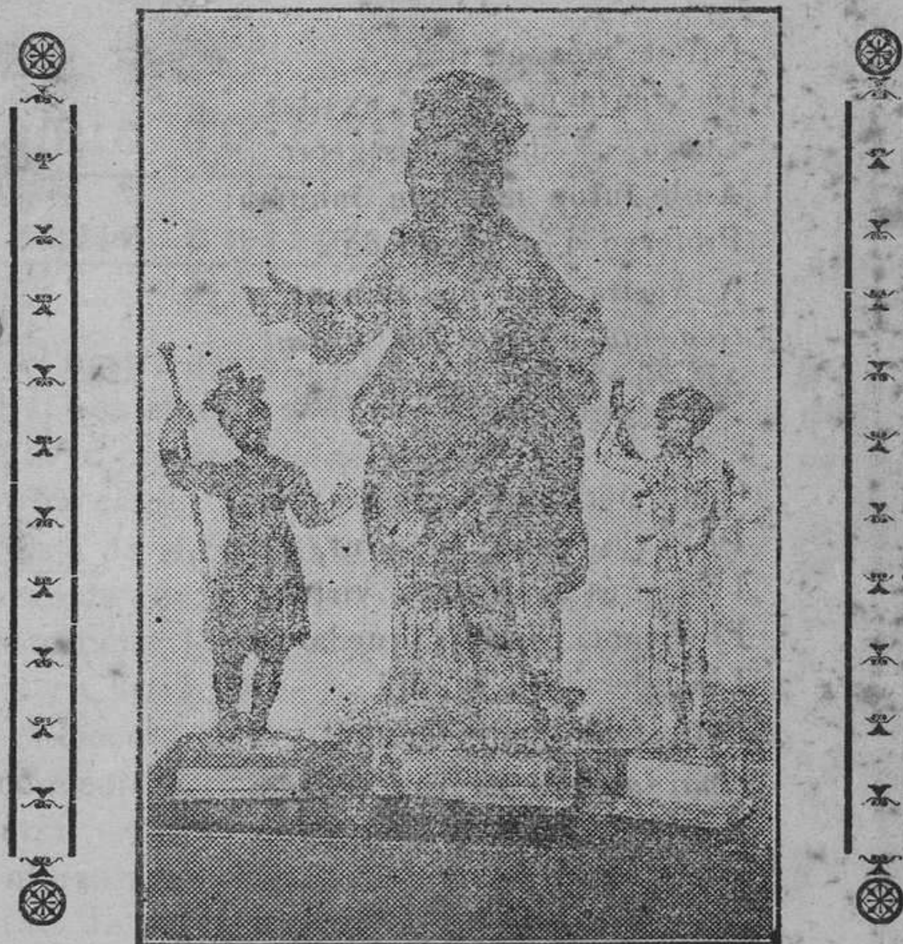
Imagen de Santa Rosalía de Palermo, que se veneraba en la pequeña iglesia de los PP. Antonianos.

Universidad que tenía a gran honra su fidelidad en la observancia de los compromisos, y consideraba un deber ineludible su atención al bien de los menorquines, en concejo general del 25 del mismo mes empezó a ocuparse, en tono enérgico, de dicho acto del se-