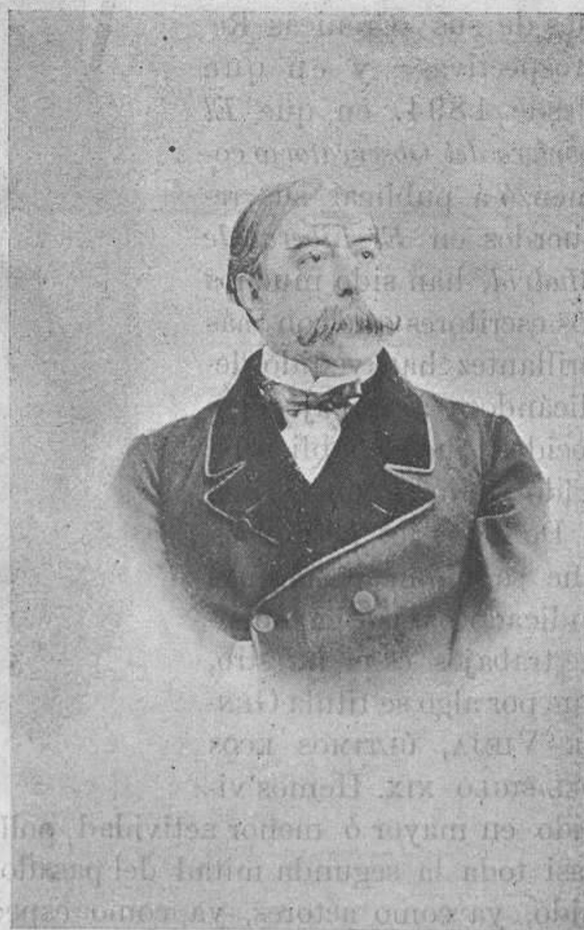
Don Luis González Bravo, último presidente del Consejo de Ministros de la Reina Isabel.