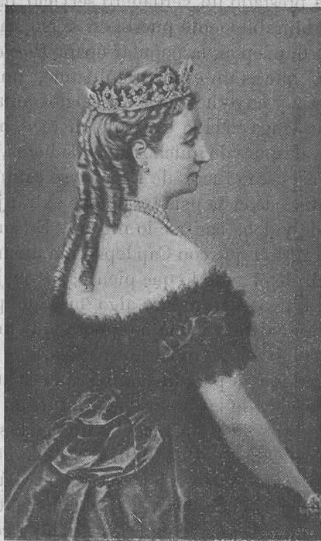
La Emperatriz Eugenia en 1868.

Los que hoy pasan por la plaza del Angel, donde está el Casino Militar, y son como nosotros hombres de cierta edad, recuerdan las reuniones de casa de la Condesa de Montijo, una de cuyas hijas, Eugenia la de Teba, como en Madrid se la llamaba, era una hermosísima muchacha llena de espíritu, que ahora se dice, y que