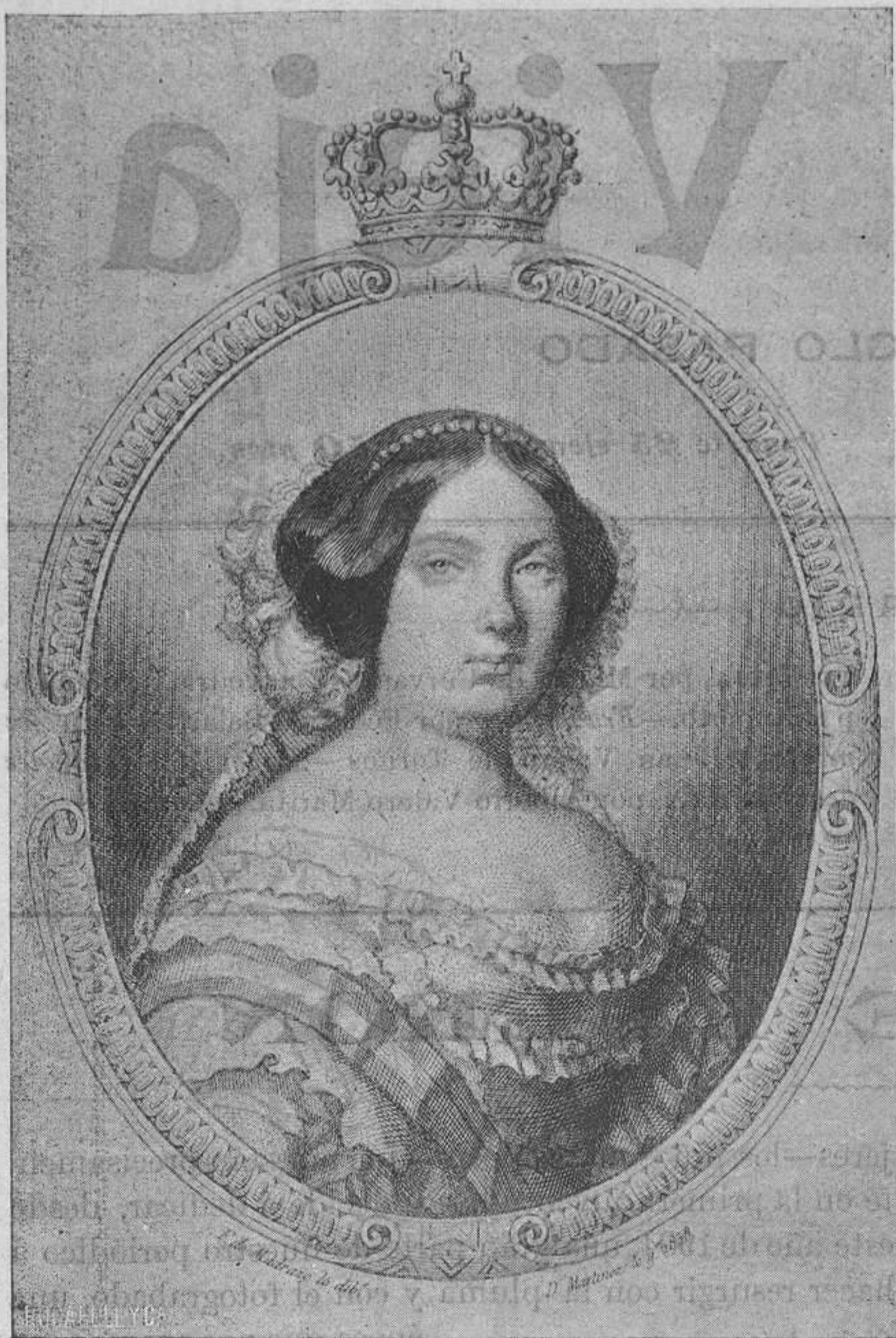
La Reina Isabel II en 1860.

Al publicar más adelante retratos de políticos, autores y actores de esta época; al narrar las intrigas palácicas y algo de la política de entre bastidores, tendrá necesariamente que volver á hablarse de doña Isabel II, que si anciana y casi olvidada, como hoy está, volviese á Madrid y fuese con mantilla y coche abierto á los toros y á la Virgen de la Paloma, todavía había de tener en las calles de la corte una ovación, porque ha sido siempre esencialmente española y generosa.