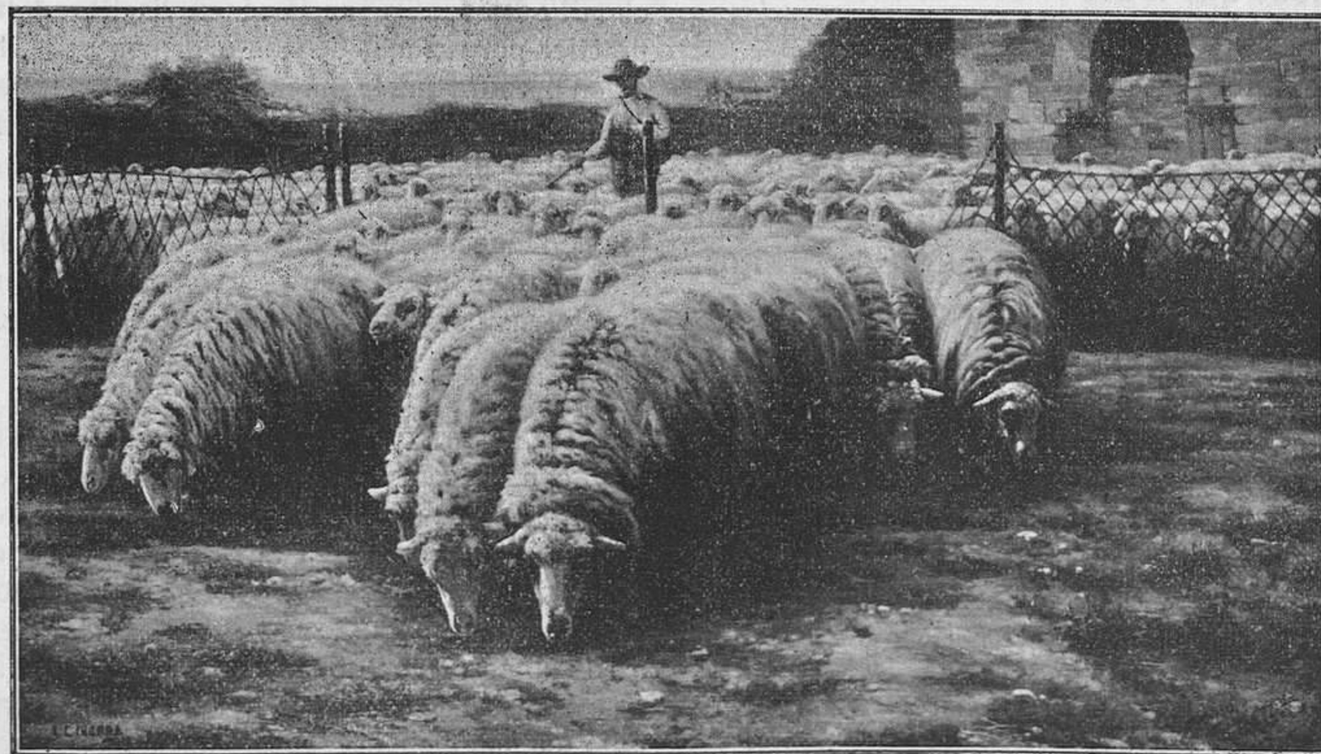
EN EL REDIL

Iborra es respetuoso con el Arte y con el público; Iborra se respeta á sí mismo y no acude á lo convencional y artificioso: su pincel sólo sabe de la verdad, como sus ojos, como su conciencia artística, que le prohíbe abandonar los caminos por donde anduvo Van-Dik. Sobran facultades al pintor santónés para descubrir horizontes; pero no pretende