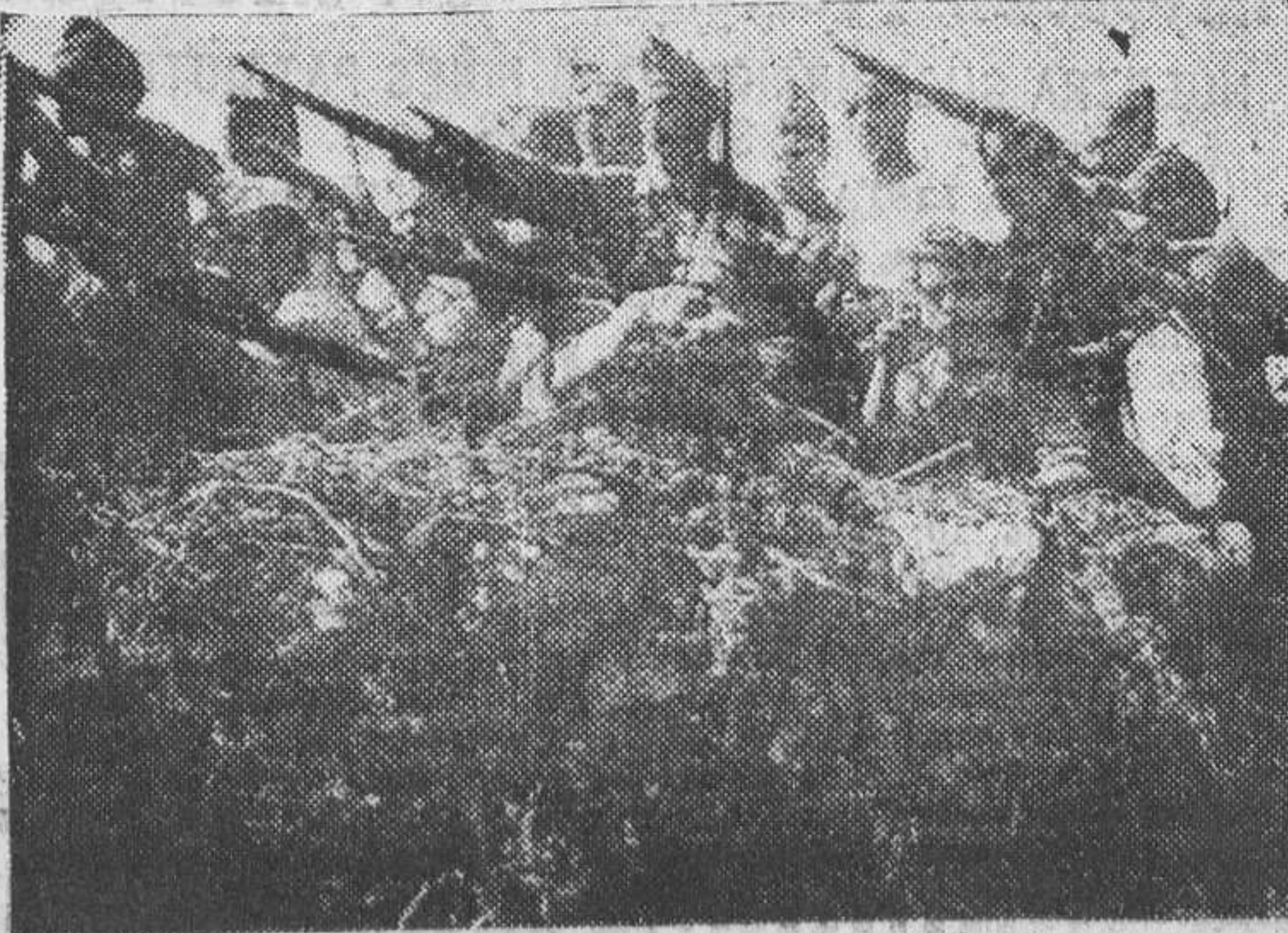
En el parapeto, los milicianos gráficos se preparan para la defensa

Uno de estos refugios es el que nuestro grupo debe vigilar. Está instalado en la cima del montículo Los Cerrillos, ?