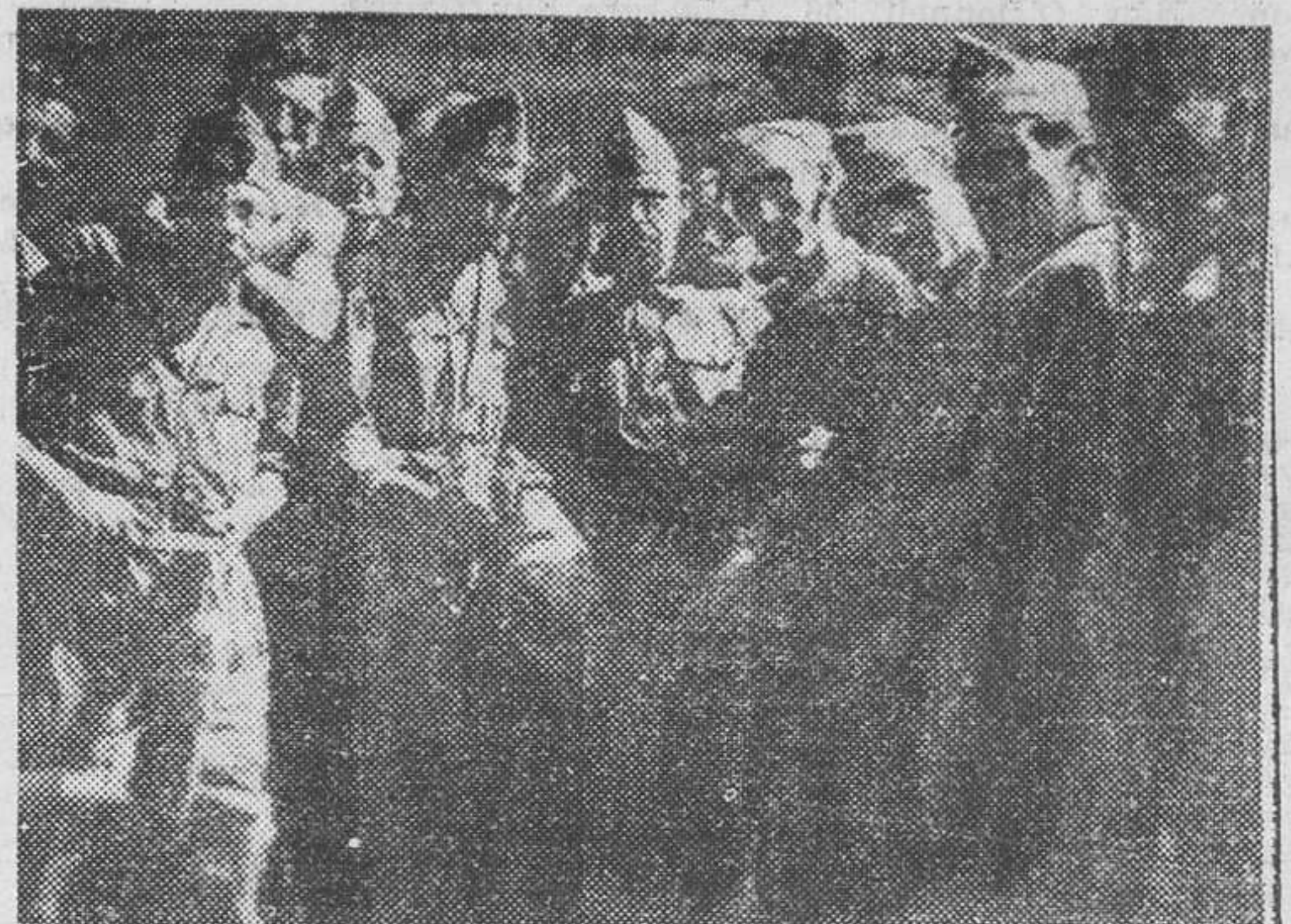
Pelando un jamón, para el alimento diario