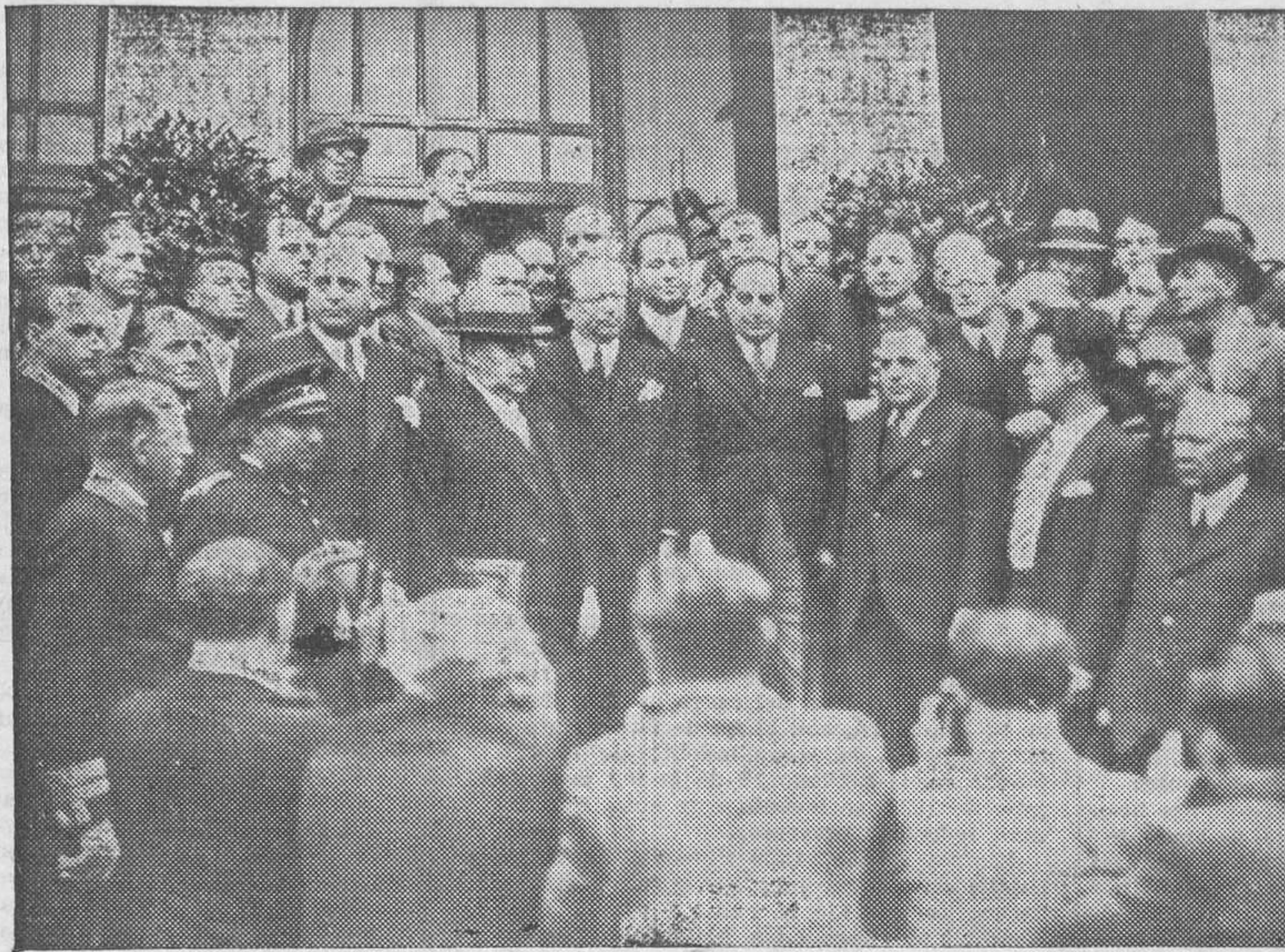
El señor Jiménez de Asúa, los vicepresidentes y secretarios de la Asamblea, a la puerta del Palacio de Cristal, antes de dar comienzo la sesión solemne de ayer

He aquí los juicios expuestos por algunas destacadas personalidades políticas con referencia al acontecimiento histórico desarrollado ayer en el Palacio de Exposiciones del Retiro: