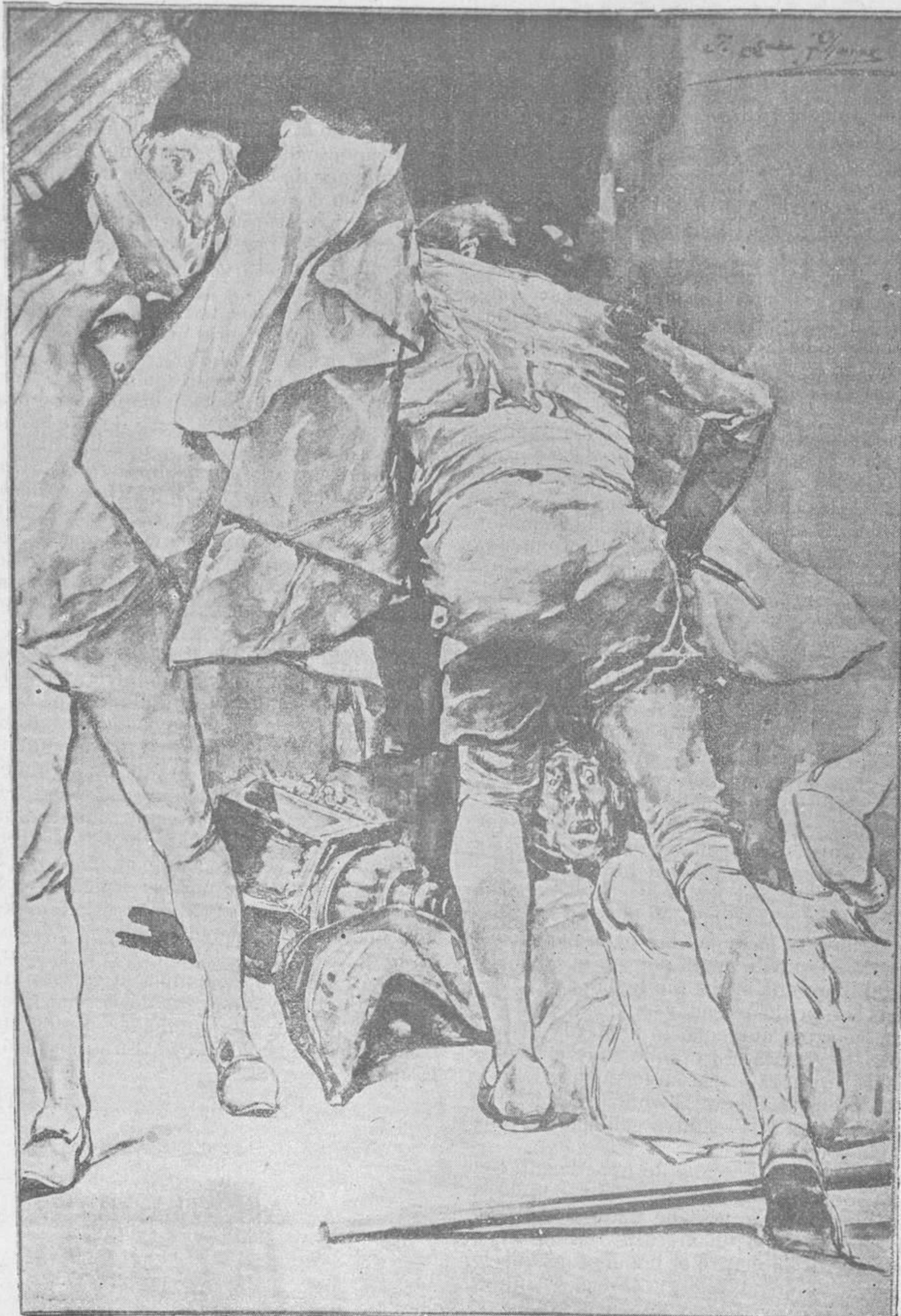
GARCÍA RAMOS. — EL ROSARIO DE LA AURORA.

El sacerdote es la conciencia del árbitro del hogar