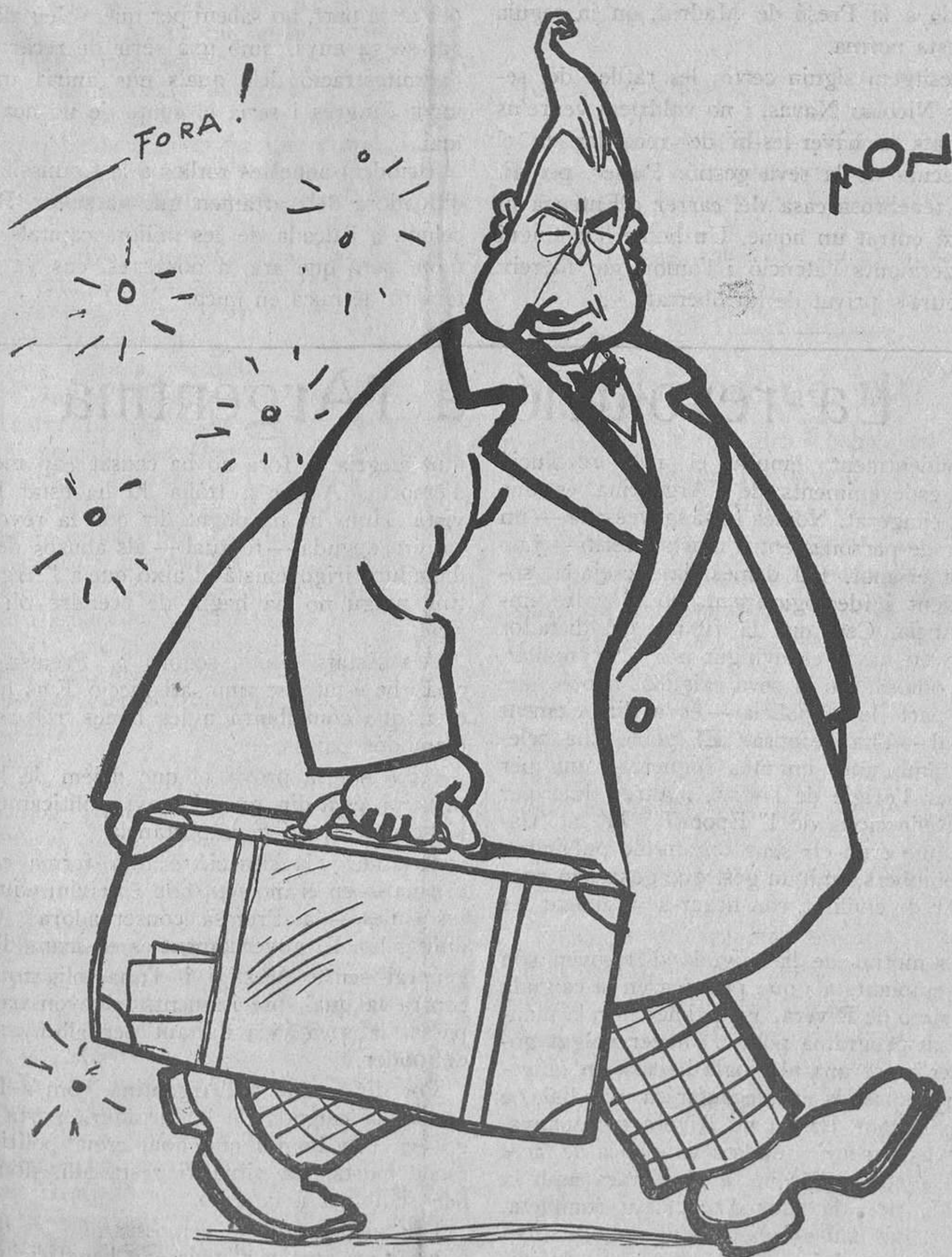
L'Irigoyen, el dictador argentí